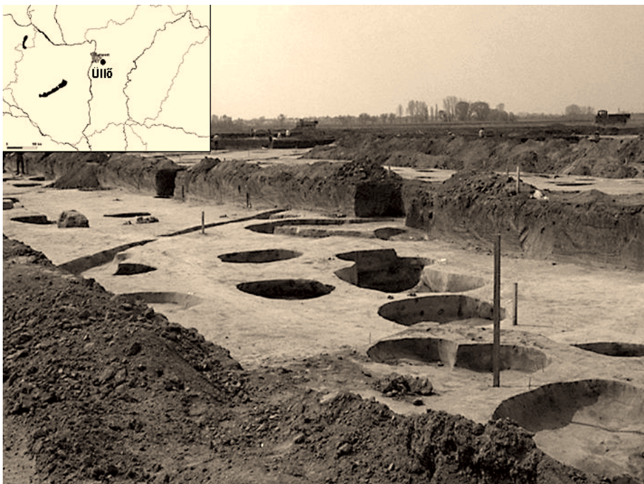
1. ábra A feltárt terület Figure 1. The excavated area

Jelen munkánk keretében Üllő külterületén, a fővárost elkerülő M0-ás körgyűrű új szakaszának építését megelőző leletmentő ásatásnál nyújtottunk segítséget egy i. sz. IV–V. századbeli szarmata fazekasfalú feltárása kapcsán felmerült talajtani kérdésekben. Az egykori szarmata település feltárása 2001-ben kezdődött, a területről több mint hét-ezeröttszáz régészeti objektum (sír, ház-, égetőkemence-maradvány, gabonátároló) került elő (1. ábra). Az ásatás során a régészek részéről számos talajtani vonatkozású kérdés merült fel az antropogén és pedogén folyamatok és rétegek elkülönítésével, a feltárt égetőkemencék elhelyezkedésével, és a temetkezési halmokkal kapcsolatban. Részletesen a lelőhely Ny-i részén található temetőrészlet feltárása során észlelt cementált vas kiválások talajképződési folyamatainak rekonstrukciójával foglalkoztunk.