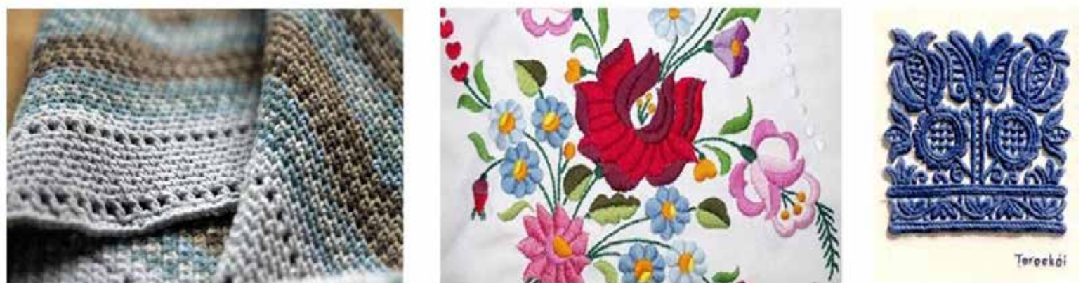
1. ábra: Horgolt sál, kalocsai és torockói hímzés

A művészeti rekreáció mint a kulturális rekreáció alrendszere (Fritz, 2015) vizsgálata még kevésbé elterjedt. Emiatt a textilművészeti szokások, illetve hatások feltérképezését egy online elérhető kérdéssorral (ELTE-KEB: 2020/385) végeztük 2020. november 17. és 2021. február 28. között, amelyben a kérdéseket magunk állítottuk össze. Célkitűzésünk volt feltárni, mik a leggyakrabban alkalmazott technikák, a foglalkozásokat milyen gyakorisággal űzik, a flowt mennyire érik el a megkérdezettek. Az adatelemzés leíró statisztikai módszerrel (MS Excel) történt. A kérdőívet 246 fő töltötte ki (Nnő = 243), többségében a 45-54 éves (36,6%) és az 55-65 éves (17,5%) korosztályból (N18-24év=8,9%; N25-34év=12,2%; N35-44év=16,3%; N65év+=8,5%). Magas a mintában a felsőfokú végzettségűek aránya (65,4%). Munkapiaci státusz szempontjából a kitöltők több mint fele (55,7%) alkalmazott jelenleg, 13,4%-uk vállalkozó, 11,8%-uk nyugdíjas és 9,8%-uk hallgató.