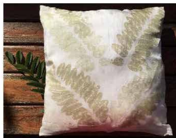
2. ábra: Shibori-termékek, patchwork táska és eco-print párna

Figure 2. Products made with Shibori technique; patchwork bag and eco-printed pillow