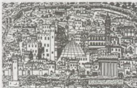
Ferrara a 15. század végén (Modena, Biblioteca, Estense)