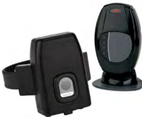
2. számú ábra: 3M ITrack nyomkövető (balra) és beacon (jobbra) egység