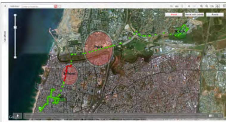
3. számú ábra: Integrációs és kizárási zónák. A zöld és piros háromszögek az őrizetes mozgását jelölik.

Gyakorlatilag ez a három fő funkciója a programnak. A Büntetés-végrehajtási Szervezet a reintegrációs őrizet alkalmazása során is ezt használja. A programba be kell táplálni a reintegrációs őrizetes adatait, majd hozzá kell rendelni egy nyomkövetőt és ez után meg kell adni az őrizet kezdő és utolsó napját óra és perc pontossággal. Ezt követően körbehatárolással vagy sokszögeléssel, a Google térképes szolgáltatásával létre kell hozni a zónákat (ahol az őrizetes tartózkodhat vagy nem tartózkodhat). A zónáknak két változatát különböztetjük meg, az egyik az úgynevezett integrációs, ebben kell az őrizetesnek tartózkodnia, a másik pedig a kizárási zóna, ahol nem tartózkodhat. Ezeket a zónákat a program is eltérő színnel jelöli, illetve ezeknek nevet is lehet adni, mint például lakás, munkahely.