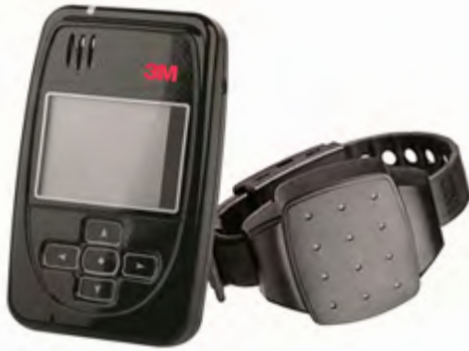
4. számú ábra: 3M 2Track nyomkövető (balra) és „óra” (jobbra) egység

A 2Track eszköz szintén két részből áll, melynek egyik eleme egy mobiltelefonra hasonlító jeladó, a másik pedig egy végtagra rögzíthető egység, mely olyan, mint egy karóra. Ezen egység működése teljesen megegyezik az 1Track eszközzel, szoftvere és a központi architektúrája ugyanaz. A tesztelés során egyértelművé vált, hogy ez lehet az az eszköz, amely a büntetés-végrehajtási feladatok ellátása során alkalmazható. Ezt bizonyította az is, hogy mint elődjénél, úgy ennél az eszköznél is egymáshoz vannak rendelve az egységek, így amennyiben tíz méternél távolabb kerülnek egymástól, azonnal jelzést ad a felügyeletet ellátónak. Ezen kívül nem cserélgethetők az egységek, valamint nem kell fix helyre telepíteni, hanem azt bárhová el lehet vinni, így zsebben vagy táskában is elfér. További előnyként jelentkezett, hogy a karórára hasonlító eszköz hosszú élettartamú elemmel működik, így nem igényel napi töltést sem, melynek következtében nem kell az eszközt naponta leszedni vagy feltenni a végtagra, amellyel jelentősen csökkenthetők az anyagi költségek, hiszen nem kell új szíjat vagy csatot felhelyezni. Csak a jeladó igényel napi töltést, azonban ez költséggel nem jár.