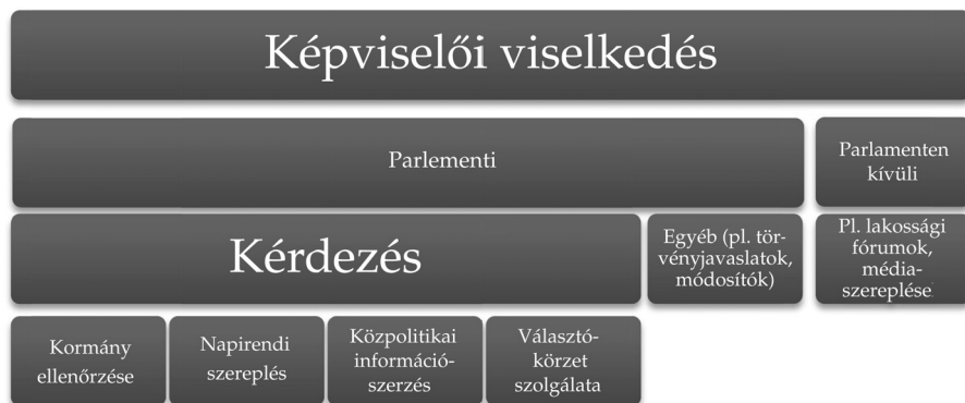
1. ábra. A képviselői viselkedéstől a kérdésre vonatkozó hipotéziszekig 4

A parlamenti beszédekkel kapcsolatos kutatások rendszerint külön vizsgálják a törvényjavaslatokhoz kapcsolódó vitákat és a különböző parlamenti kérdések műfajait (Martin–Vanberg, 2014: 328.). Utóbbiak kapcsán különösen fontos, hogy mennyire képes önálló politikai viselkedésre a frakcióhoz tartozó képviselő a frakció „akaratához” képest (előbbi esetben az európai kontextusban a pártközpontú kutatás a domináns, könnyen belátható okokból).