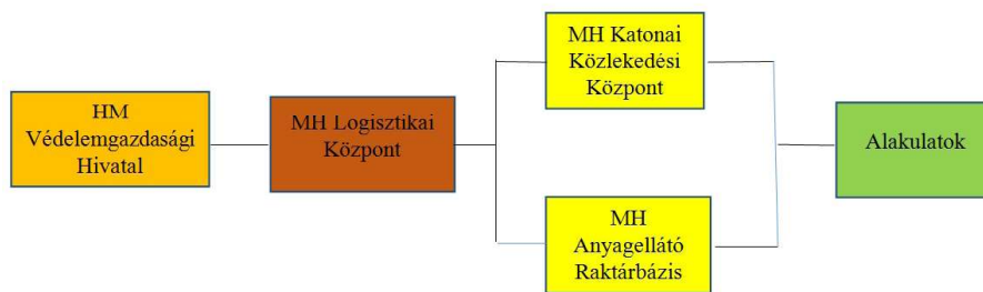
1. ábra. A Magyar Honvédség (MH) központi beszerzésű anyagainak ellátási rendje