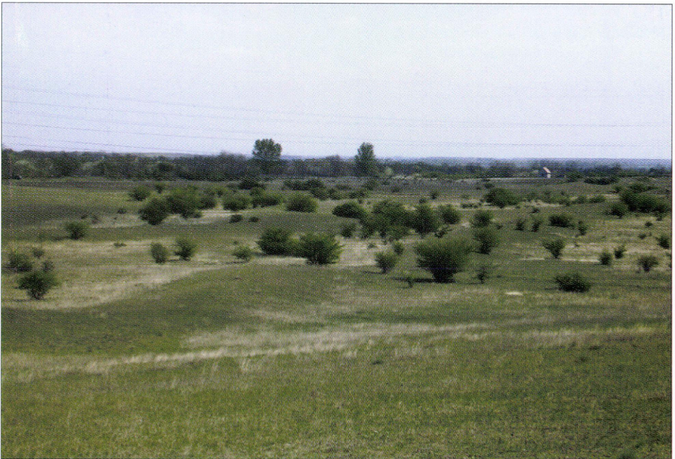
4. ábra: Az ürge emző látképe