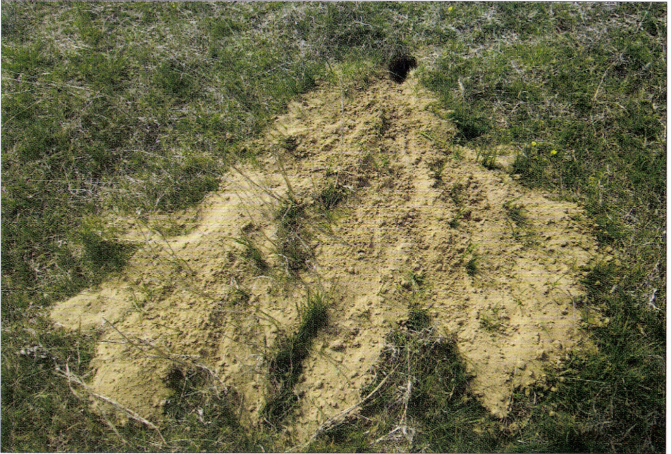
3. ábra: Jellegzetes ürgelyuk