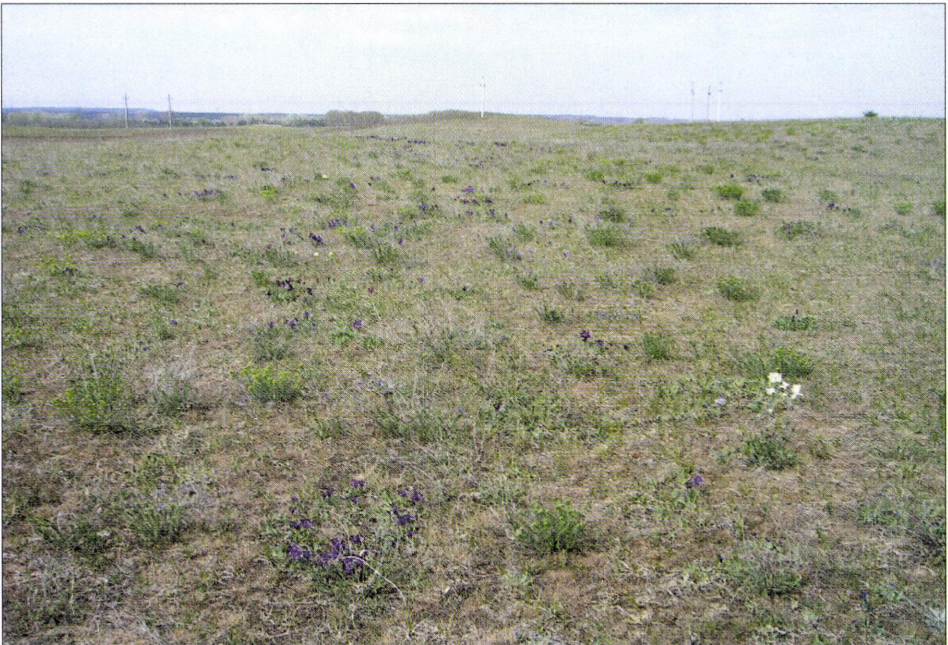
2. ábra: Élőhely. Apró nőszirm virágzás az Ürge-mezőn