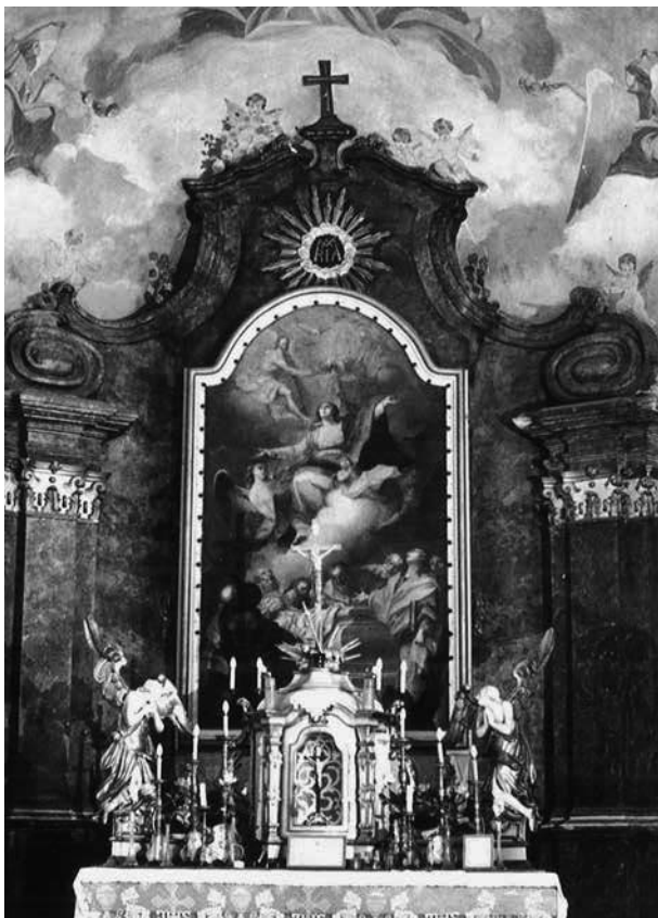
27. Johann Lucas Kracker követője: Mária mennybevétele, 1775–1790 között. Olaszliszka, a Nagyboldogasszony-plébániatemplom főoltárképe

de kissé leegyszerűsített: Evangélista Szent János alakját a festő a jobb oldalra helyezte, eggyel kevesebb az angyal, Mária arca a szintén Kracker-eredetű, egyenes orrú, ovális típus, a Szentháromság távolba vesző együttesét viszont, jól megértve a rajzot, visszafogottabb színekkel festette meg. A rajz hátoldalán halvány töredékek láthatók: egy térdelő fiatal király liliommal és egy koronás női fej grafittal felvázolva. Ezek az olaszliszkai temp-