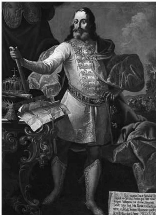
4. Johann Lucas Kracker: IV. Béla király, 1758 körül. Budapest, Fáy Baráti Társaság

új meghatározás lényege az a feltételezés, hogy az 1757-ben villámcsapás következtében leégett, majd 1761-ben újra felépített barokk templom szentélye mégsem szenvedett akkora kárt, hogy egy előző mennyezeti kifestés ne élte volna túl – az épület műemléki kutatása során találtak is az előzményből megmaradt szerkezeti részeket. Ám azt, hogy a gerasi premontreiek a saját ebédlőjük és lépcsőházuk mellett Trogerrel a japóni templomot is kifestették volna 1737–1738-ban, csupán a Troger-tanítvány, Johann Jakob Zeiller 1738-ból szignált, datált mellékoltárkép-párja bizonyítja, továbbá a ma látható, többszörösen restaurált mennyezeti freskó stíluskritikája. A már említett bécsi, Landstraße-i Szent Miklós-temetőkápolna hajdani kifestéséhez (1740) kapcsolt magántulajdonú vázlat – Szent püspök megdicsőülése – és Kracker sasvári Remete Szent Pál-oltárképének színpompás bozzettója (1757), ugyanőtöle a prágai Erzsébet-apácák kórháztemploma Szent Tekla-kápolnájának szintén apoteózist ábrázoló freskója (1761), valamint Troger heiligenkreuz-gutenbrunni Mária mennybevétel-freskójának (1737) részlete képezik az analógiáknak azt a sorát, amelyek összehasonító elemzése alapján a szerző Krackertől elvitatja, és a példakép-mesternek tulajdonítja a japóni freskó-együttes e leginkább sematikus darabját. Már láttuk, hogy a St. Niklas-templom freskói, akárcsak