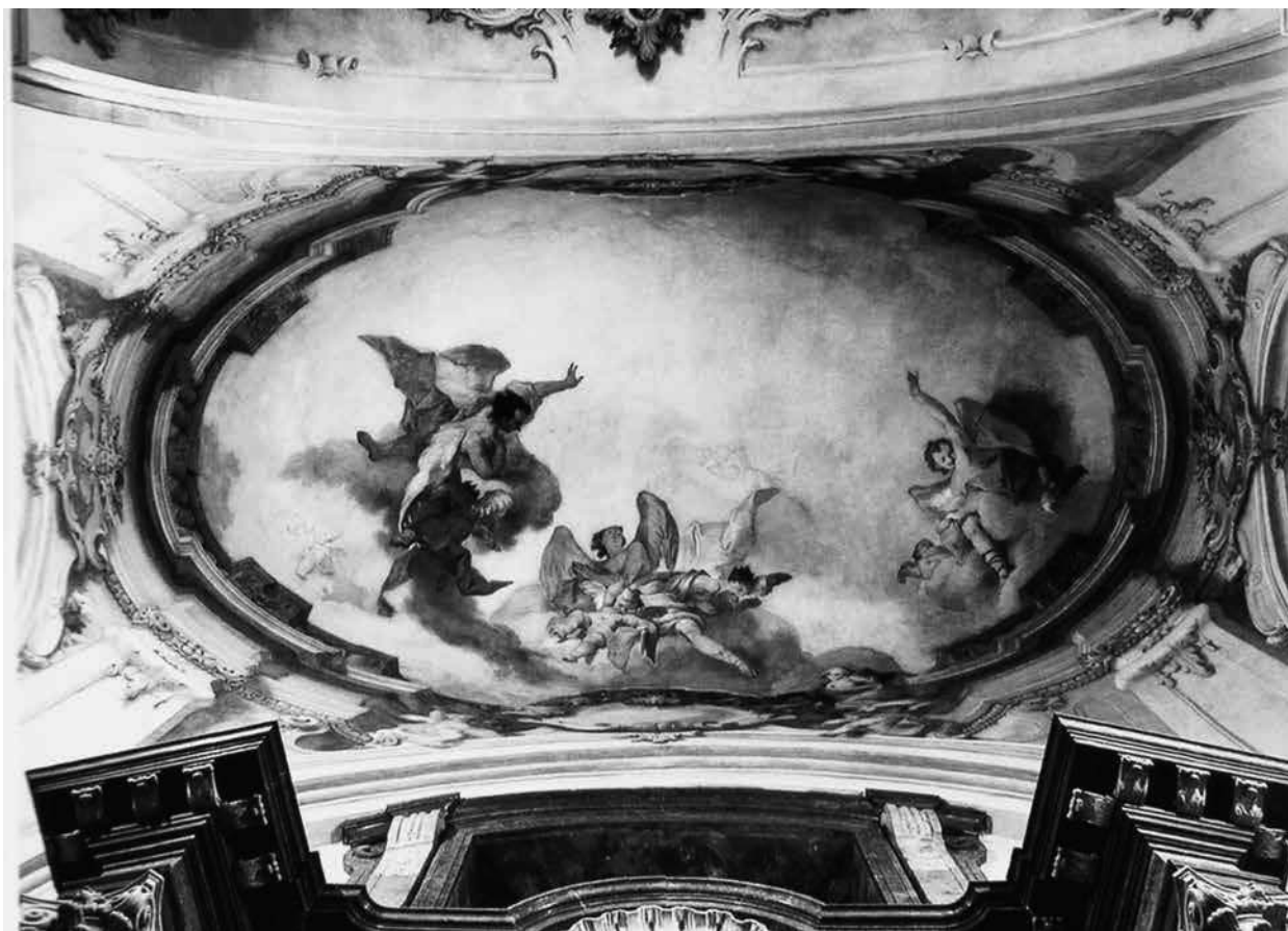
2. Johann Lucas Kracker: Lebegő angyalok , 1757. Šaštín, a Fájdalmas Mária zarándoktemplom Szent Anna-kápolnájának mennyezetképe