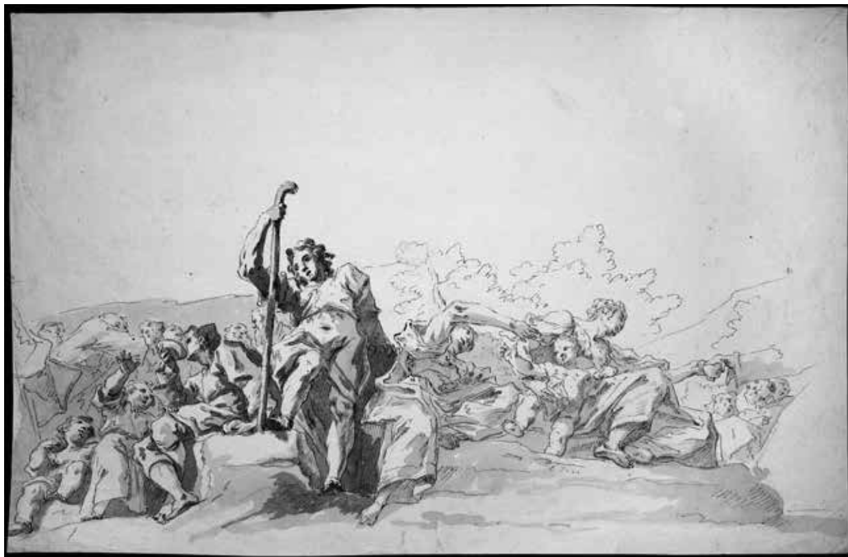
19. Johann Lucas Kracker: Pásztorfiú bottal, nők és kisgyermek tájban, 1767. Paul Troger gerasi freskójának részlete. Debrecen, Déri Múzeum