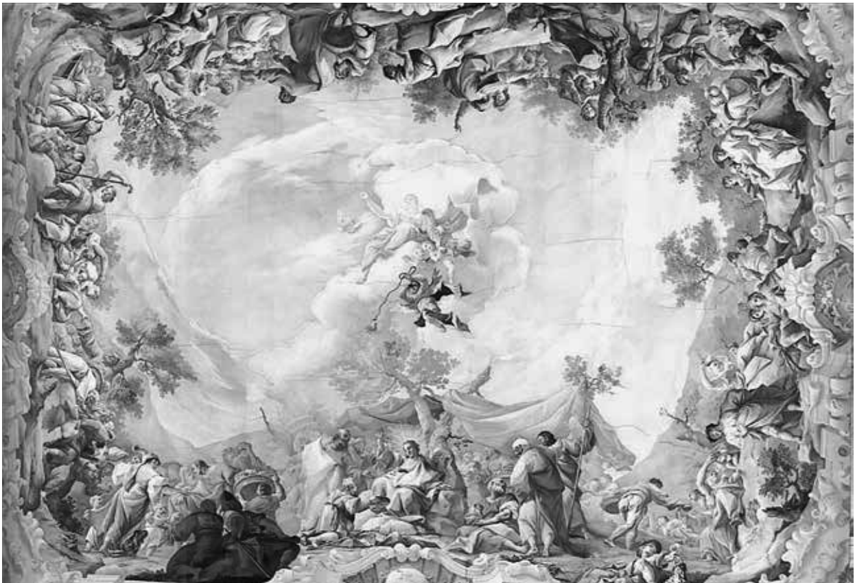
16. Paul Troger: Az isteni gondviselés a csodálatos kenyérszaporítás példáján, 1738. A gerasi premontrei apátság nyári ebédlőjének („Marmorsaal”) mennyezetfreskója

A debreceni rajzok egy következő csoportja – négy lap, kettőnek a hátoldala is – a gerasi premontrei apátság nyári ebédlőjének („Marmorsaal”) mennyezetfreskójáról készült: Paul Troger 1738-ban festett, a csodálatos kenyérszaporítást ábrázoló művének 87 (16. kép) részleteit ábrázolja. A másoláshoz Kracker az előbbieken részletezett, 1767-es gerasi tartózkodása adott alkalmat. 88 Troger is, Kracker is