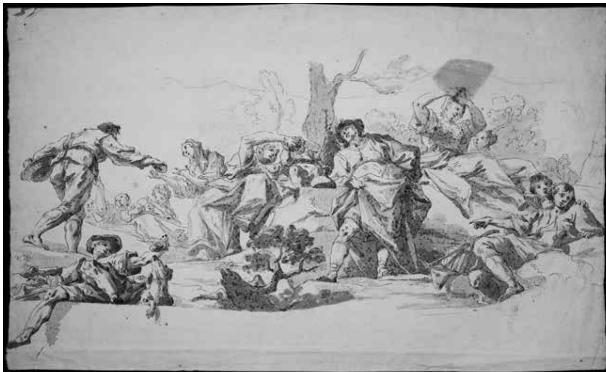
17. Johann Lucas Kracker: Fiú kutyával, kenyeret osztó apostol és további alakok tájban, 1767. Paul Troger gerasi freskójának részlete. Debrecen, Déri Múzeum

A rajzsorozatból éppen a freskó bejárati ajtó fölötti főnézete hiányzik az ülő Krisztus alakjával, amelyhez Troger saját vázlatrajzát is ismerjük 92 – ez lehet véletlen, még ha ez a részlet követi is leghívebben a hradischi megvalósítást –, majd tőle jobbra haladnak a jelenetek. A sarkokat kiterítve ábrázolja Kracker, tehát egy nézetben látjuk az apostolt, aki egy asszonnak ad kenyeret, az előtérben ülő, lábát a festett fópárkányról lefogató, kutyát etető kisfiút – a terem és a freskó emblemikus figuráját – és a csonka fa alatti/körötti csoportokat: a gyermekét itató anyát, az elől magasodó díszes öltözékű férfit, a sziklán elheverő pásztorokat és hátul/fent a haját fésülő asszonyt társnőivel (17. kép). A keleti, ablakos rövid fal, illetve sarok feletti freskórészlet