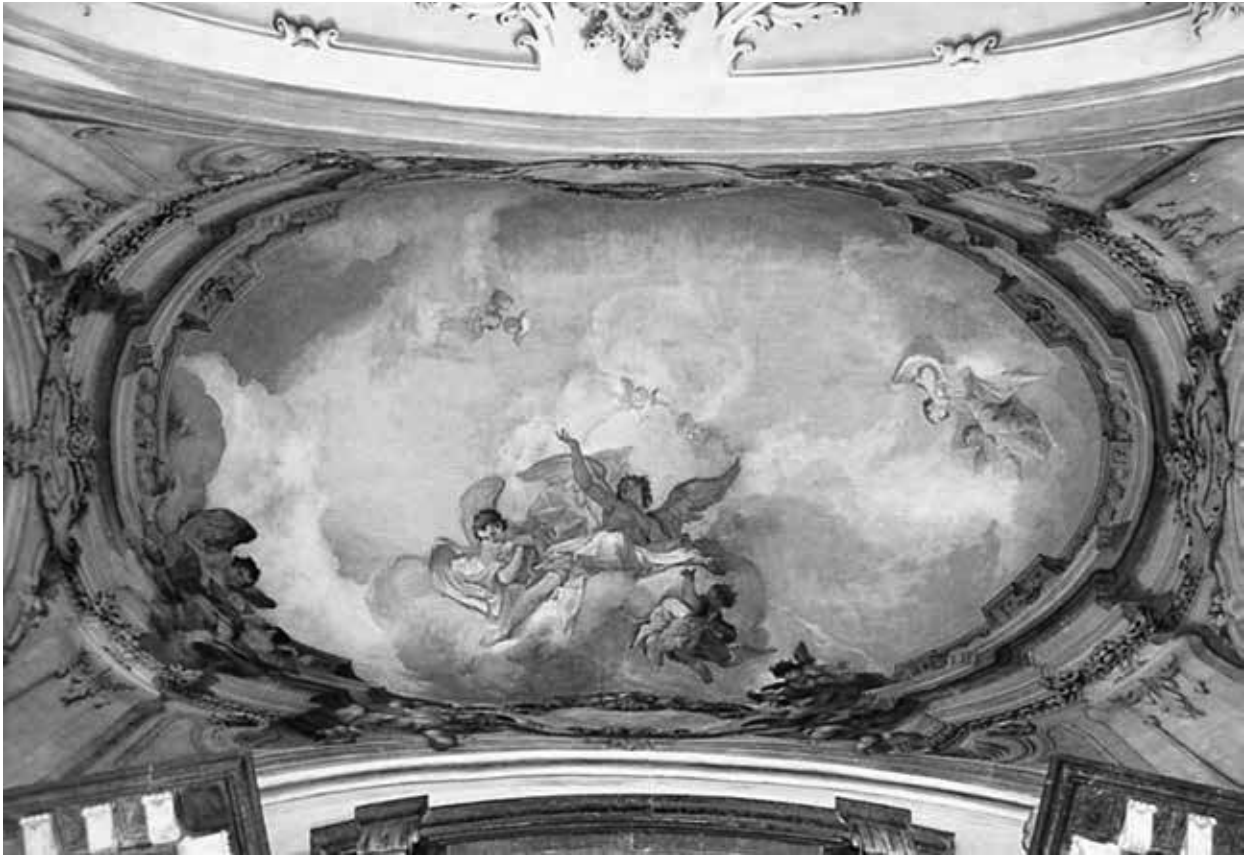
3. Johann Lucas Kracker: Lebegő angyalok , 1757. Šaštín, a Fájdalmas Mária zarándoktemplom Szent József-kápolnájának mennyezetképe

ber 24-re végzett. A feltámadt Krisztust ábrázoló mennyezetképről egy bizonyos Franz Hauptmann, egri polgárrá lett festő akvarell-másolatot készített 1816-ban; Szmezsányi Miklós még ennek alapján írta le a freskót. 50 Ám ez a képi forrás is elveszett, legalábbis a műemléki topográfiai és a Kracker-monográfia számára, míg Urbán Márta és Köves-Kárai Petra meg nem találta újból a levéltárban, és bemutatta 2017-ben a festő jubileumi kiállításán. 51 A lap egynézetű mennyezetképet örökít meg (6. kép), a teknőboltozat ívét, az esetleges térillúziót nem érzékelteti. Kétoldalt magasba nyúló sziklák, természeti részletek határolják a jelenetet, míg a szentély fölötti égboltot angyalok népesítik be. A feltámadt Krisztus alakja nem független Paul Troger azonos témájú freskójától St. Andreä an der Traisen Ágoston-rendi templomában (1730/31 körül), míg a balra fent füstölőt lóbáló nagy angyal és társa, de főként a lenti legyőzött csoport és az alvó katona az 1784-ben lebontott bécsi St. Niklas temetőkápolna „auf der Landstraße” hajójának csak vázlatról ismert mennyezetfreskójáról származhat (1740). 52 Kracker az onnan sokat másolt, sírjára fellépő, kitárt karú Győzelmes Krisztus alakját a znaimi kapucinus főoltár Keresztelő Szent Jánosához használta fel