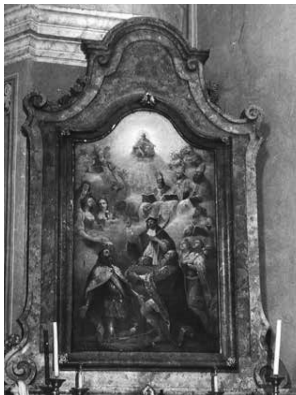
29. Egri festő, 1775–1790 körül: Mindenszentek, középpontban a magyar szentekkel. Olaszliszka, a Nagyboldogasszony-plébániatemplom mellékoltárképe

lom egyik mellékoltárképének figuráit idézik, és összefüggésbe hozhatók a szegedi könyvtár Szent Imrét hat változatban ábrázoló, már említett tollrajzával (28. kép). 105 A festményen, amely szintén nem Kracker műve, a hátoldali halvány alak tükörképe látható liliommal mint Szent Imre, mögötte a koronás királylány Magyarországi Szent Erzsébet lehet. Mindenszentek-oltár ez, a magyar szentek, elsősorban István és László, a korona és a kard kiemelésével, de közöttük magasodik a Habsburg-birodalomszerte tisztelt Nepomuki Szent János is; bal oldalon Szent Katalin és Borbála mögött bizonyára Árpád-házi Szent Margit a felbukkanó apácászent (29. kép). A szegedi lapon látható adoráló fiatal királyszent (egyik) beállítását végül ennek az oltárképnek a Szent László-alakja örökölte; a rajz további „Szent Imre-variációi”, akárcsak az olaszliszkai Szent István Kracker kései, apci oltárképével mutatnak rokonságot. 106 A merev beállítás, a tömörszerű volumenek, a mozdulatlan ruhák és a zömmel egyforma félprofilból ábrázolt arcok műhelymunkára, talán szintén Zirkler – netán Falkoner? – kezére vallanak. A Zemplén megyei Olaszliszka bár a 18. században az egri egyházmegyéhez tartozott, kegyurai a középkor óta a szepesi káptalan és a szepesi prépostság voltak. Gótikus templomát Eszter-