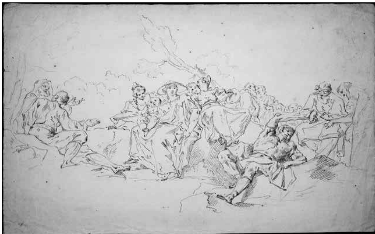
18. Johann Lucas Kracker: Fiatal anya szalmakalapban és további alakok tájban , 1767. Paul Troger gerasi freskójának részlete. Debrecen, Déri Múzeum

A tanulmányi célú Troger-másolatoknak ez a pontosan meghatározható sorozata felveti a kérdést, hogy segítségükkel nem lehetne-e jobban megközeleíteni az anonim Troger-követő vázlatokat, azok két,