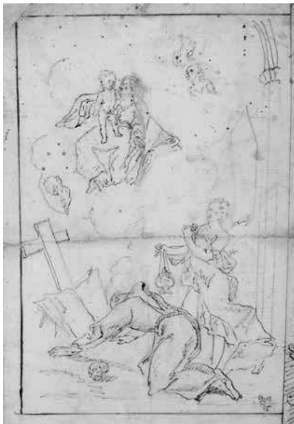
30. Johann Lucas Kracker műhelye: A Madonna előtt imádkozó Assisi Szent Ferenc, 1770–1780 között. Szeged, Móra Ferenc Múzeum

Műhelyéhez köthető, de nem feltétlenül Kracker műve a Zsótér-gyűjteményből a szegedi múzeumba jutott kétoldalas barokk rajz, 108 előoldalán egy kereszt és könyv előtt mélyen leboruló, csuhás szerzetessel – minden bizonnyal Assisi Szent Ferenc (30. kép). Fölötte felhőn megjelenik a Madonna az ölében álló gyermekkel, jobbra mögötte pedig egy nagy angyal áll füstölővel. Az előtérben koponya, a jobb felső sarok gótikus építészeti helyszínt jelez. Apró angyalfejek tarkítják a leget. A hátoldal az angyali üdvözlés elnagyolt vázlatával, lámpával, függönnyel, néhány bútorttal jelzett belső térben (31. kép). Balról érkezik az angyal, legfölül a Szentlélek galambja repül be. Elöl teljes profilból ábrázolt a térdelő Mária, alakját dús drapéria fogja körül, előtte kosár, mögötte karosszék. A kompozíció – há-