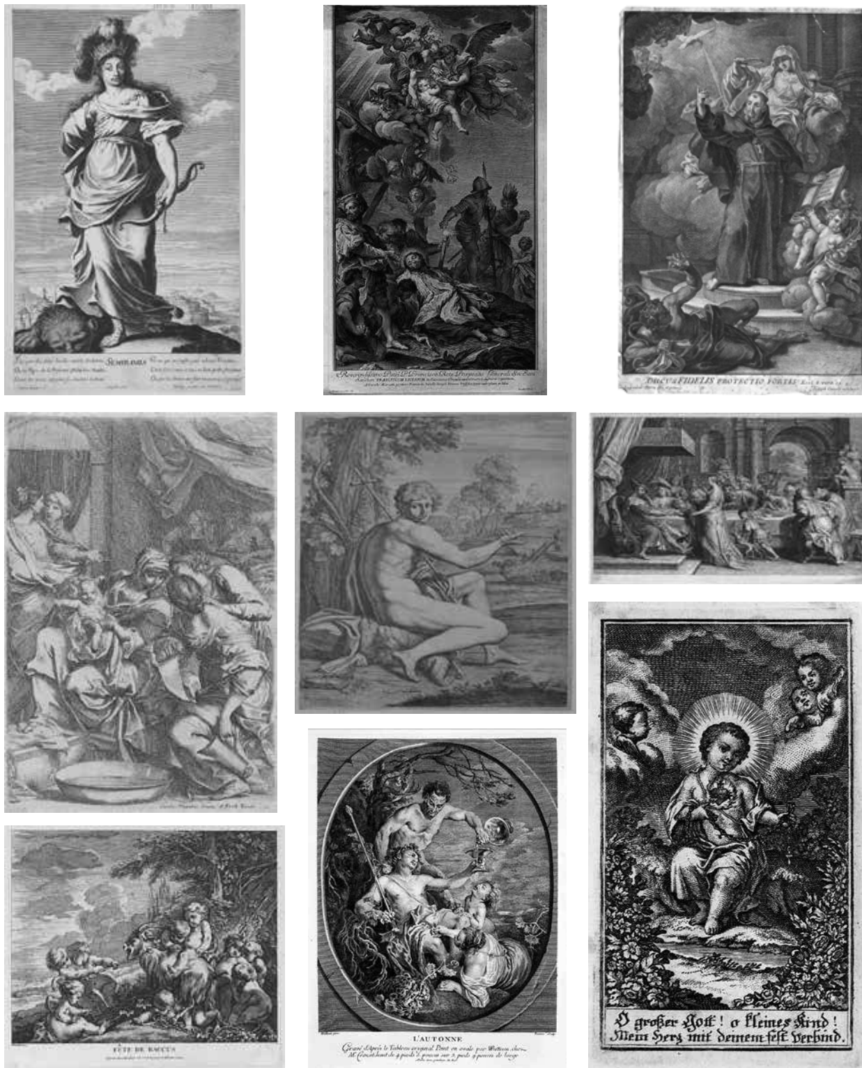
32. Grafikai művek Johann Lucas Kracker előképekészletéből: (1) Gilles Rousset és Abraham Bosse rézmetszete Claude Vignon rajza után: Semiramis, 1639–40 körül; (2) Jacobus Frey rézmetszete Carlo Maratta után: Xaveri Szent Ferenc halála, 1733; (3) Joseph Canale rézmetszete Ludovico Stern után: Sigmaringeni Szent Fidél, 1760 körül; (4) Carlo Maratta: Mária születése, rézkarc 1685 körül; (5) Pietro del Po Annibale Carracci után: Keresztelő Szent János, rézmetszet és rézkarc, 17. század második fele; (6) Schelte Bolswert rézkarca Peter Paul Rubens után: Herodes lakomája, 1640 körül; (7) Pierre Alexandre Avelin François Boucher után: „Fête de Bacchus”, rézmetszet és rézkarc 1738 körül; (8) Étienne Fessard rézmetszete Antoine Watteau után: „L’Autonne”, 1740 körül; (9) Délnémet grafikus, 1740/1760 körül: A szívére mutató kis Jézus a szeretet láncával. A müncheni „Seminarkindl” rézmetszetű képe