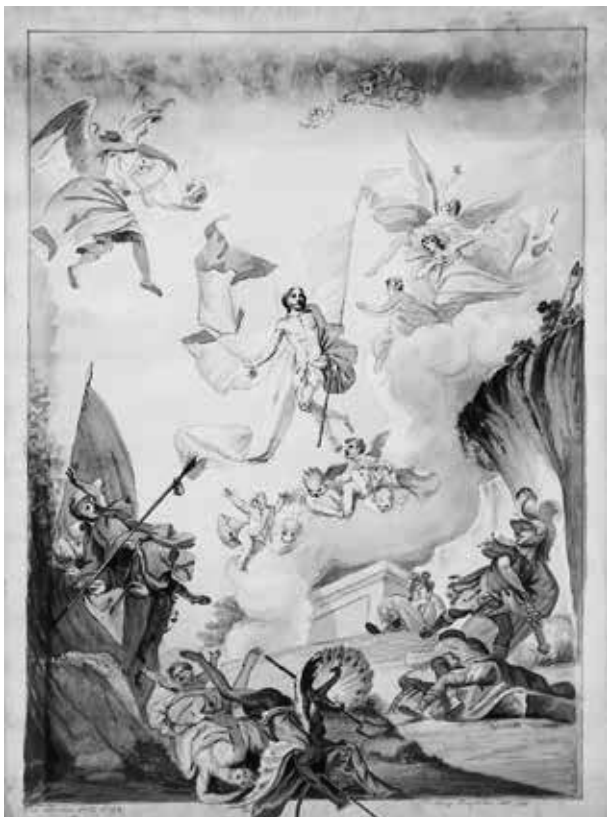
6. Franz Hauptmann: A feltámadt Krisztus, 1816. Másolat az egri püspöki palota kápolnájának elpusztult mennyezetképéről (Johann Lucas Kracker, 1764). Eger, Főegyházmegeyi Levéltár

oltárképei mekkora hatást gyakoroltak Kracker forrással igazolt egyéb műveire – olyannyira, hogy Rizzi feltételezi a festő közreműködését is e bécsi munkánál –; ugyanezek a szimptómák szerintem a japonsi szentélyfreskó esetében a tanítvány szerzőségét bizonyítják (7. kép). 57