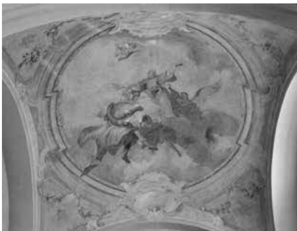
7. Johann Lucas Kracker: Szent Lőrinc megdicsőülése, 1767. Japons, a Szent Lőrinc-plébániatemplom szentélyének mennyezetképe

oltárképei mekkora hatást gyakoroltak Kracker forrással igazolt egyéb műveire – olyannyira, hogy Rizzi feltételezi a festő közreműködését is e bécsi munkánál –; ugyanezek a szimptómák szerintem a japonsi szentélyfreskó esetében a tanítvány szerzőségét bizonyítják (7. kép). 57