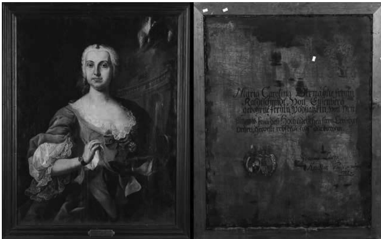
5. Johann Lucas Kracker: Karolina Kaltschmied von Eisenberg, született Podstatsky von Prusinowitz képmása, 1751. Műkereskedelemben (Róma, Cambi Casa d'Aste).

új meghatározás lényege az a feltételezés, hogy az 1757-ben villámcsapás következtében leégett, majd 1761-ben újra felépített barokk templom szentélye mégsem szenvedett akkora kárt, hogy egy előző mennyezeti kifestés ne élte volna túl – az épület műemléki kutatása során találtak is az előzményből megmaradt szerkezeti részeket. Ám azt, hogy a gerasi premontreiek a saját ebédlőjük és lépcsőházuk mellett Trogerrel a japóni templomot is kifestették volna 1737–1738-ban, csupán a Troger-tanítvány, Johann Jakob Zeiller 1738-ból szignált, datált mellékoltárkép-párja bizonyítja, továbbá a ma látható, többszörösen restaurált mennyezeti freskó stíluskritikája. A már említett bécsi, Landstraße-i Szent Miklós-temetőkápolna hajdani kifestéséhez (1740) kapcsolt magántulajdonú vázlat – Szent püspök megdicsőülése – és Kracker sasvári Remete Szent Pál-oltárképének színpompás bozzettója (1757), ugyanőtöle a prágai Erzsébet-apácák kórháztemploma Szent Tekla-kápolnájának szintén apoteózist ábrázoló freskója (1761), valamint Troger heiligenkreuz-gutenbrunni Mária mennybevétel-freskójának (1737) részlete képezik az analógiáknak azt a sorát, amelyek összehasonító elemzése alapján a szerző Krackertől elvitatja, és a példakép-mesternek tulajdonítja a japóni freskó-együttes e leginkább sematikus darabját. Már láttuk, hogy a St. Niklas-templom freskói, akárcsak