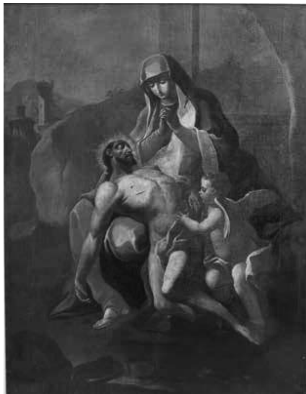
10. Johann Lucas Kracker: Pietà, 1779. A bükkzsérci plébániatemplom egykori oltárképe. Eger, Egri Érseki Palota