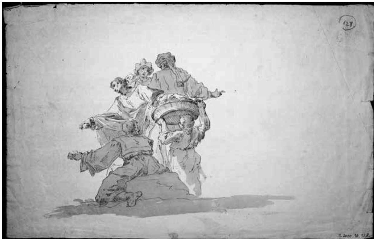
21. Johann Lucas Kracker: Kenyeres kosarat tartó fiú, egy apostol és három férfi csoportja, 1767. Paul Troger gerasi freskójának részlete. Debrecen, Déri Múzeum