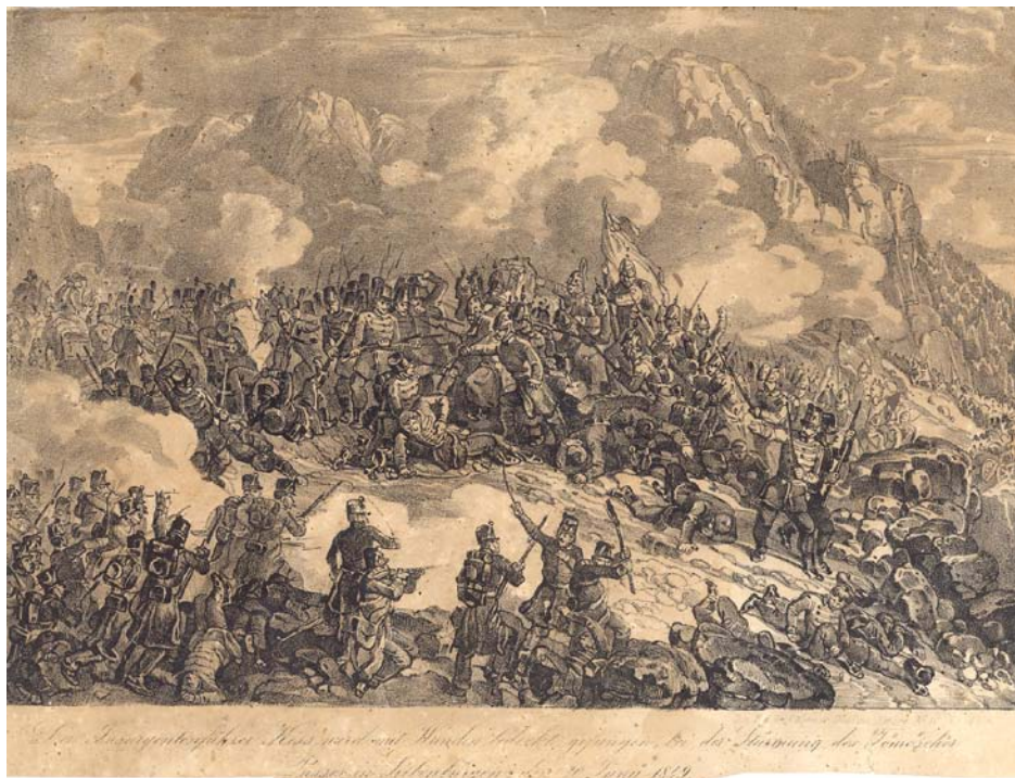
Tömösi ütközet (1849. június 19–20.)

ten nyert gyönyörű nemzeti zászló kitűzése”, a zászlóanya özvegy Czetz Jánosné, Czetz János tábornok édesanyja volt. Az ünnepség végén Tuzson János százados, zászlóaljparancsnok megvendégelte a tisztikart, a katonaságot és a résztvevőket. Az ország függetlenségének kimondását május 17-én a város piacterén katonai parádé mellett és ezt követően istentiszteleten ünnepelték meg. Május 22-én pedig a város összes templomában ünnepelték a trónfosztás kimondását, az eseményen a város szenátusa mellett a tisztikar is részt vett. A várost az eseményre való tekintettel kivilágították.