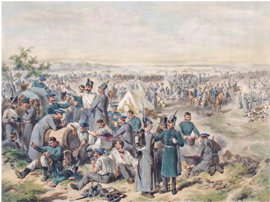
Orosz katonai tábor