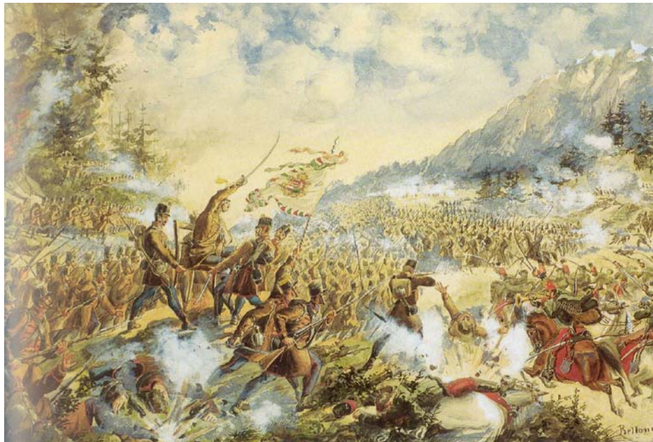
Tömösi ütközet (1849. június 19–20.)