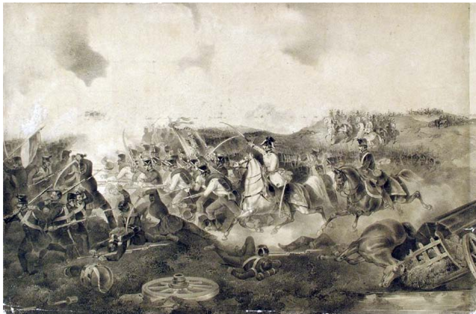
A szemerjai ütközet (1849. július 23.)