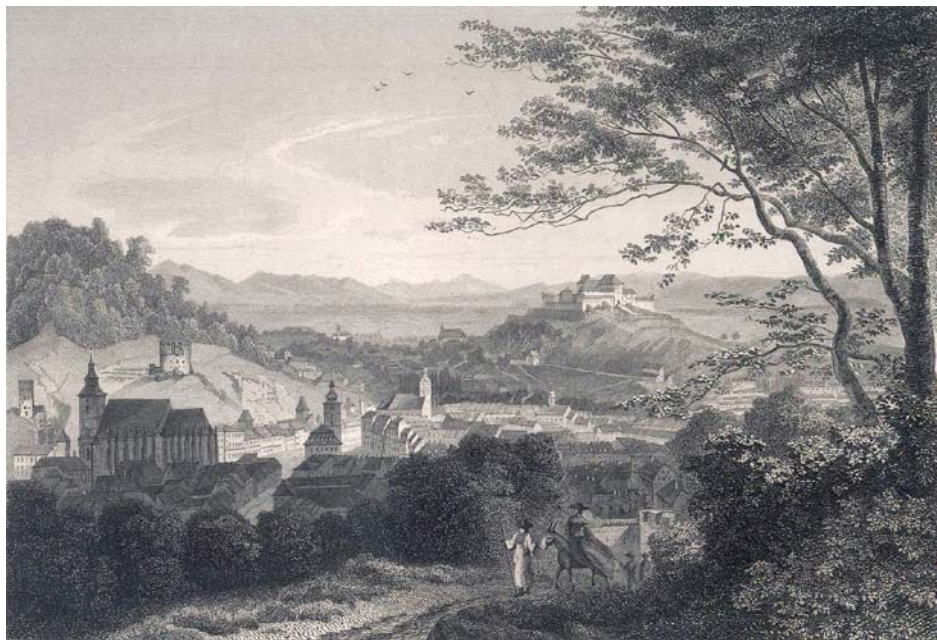
Brassó a 19. század közepén

vel a székely határőrök is honvédekké alakultak, gazdasági szempontból véve is, hogy több-több külön testületek ne létezzenek, célszerűnek látom azon csapatnak a székely huszárok közé beosztását.”