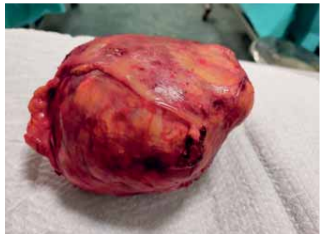
4. ÁBRA: SZINTÉN AZ ELTÁVOLÍTOTT MELLÉKVESE LÁTHATÓ. A KÖZELI FELVÉTELEN JÓL KIVEHETŐ A KEVÉS MEGMARADT MELLÉKVESE-ÁLLOMÁNY OKKERSÁRGA SZÍNE

se-biopszia), a megfelelő képalkotó vizsgálat időben való alkalmazása (kontrasztanyag CT-vizsgálat), végül a megfelelő góctalanítás (mellékvese-elváltozás időben való drenálása, ennek sikertelensége esetén sebészi feltárás). Ezek mellett fontos a szükségtelen vizsgálatok, beavatkozások mellőzése. Amennyiben a biopszia nem okozott volna szepszist, abban az esetben is szükséges lett volna a mellékvese eltávolítása nyílt sebészi feltárás során. Végül fontos kiemelni, hogy a mellékvese elváltozásainak nem belgyógyászati jellegű kivizsgálása, és – amennyiben szükséges – biopszia elvégzése, illetve operálása olyan osztályokon történjen, ahol jelentős tapasztalatot halmoztak fel a trans-, illetve retroperitonealis térben végzett műtétek, diagnosztikus eljárások, mintavételek során.