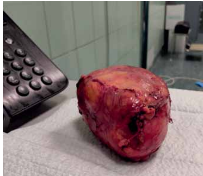
3. ÁBRA: NYÍLT BEAVATKOZÁST KÖVETŐEN AZ EGY DARAB- BAN ELTÁVOLÍTOTT ELVÁLTOZÁS

A fent részletezett szövödmények elkerülése érdekében fontos a lázas állapot kiváltó okának tisztázása (mellékve-