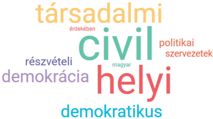
1. ábra. Kódolt szöveg leggyakrabban használt szavai

A leggyakrabban kódolt szó a „civil”, amely valószínűleg azért végzett első helyen, mert nem csak a tanácskozás-, a részvétel-kódnak is szerves részét képezi a pártok civilekkel való kapcsolata, nekik tett ígéreteik. A „civil” szót előfordulásának legnagyobb részében a „szervezetek”, „szféra”, „világ” szavak követik, emellett jellemző még a „kezdeményezés”, amely arra utal, hogyan segítené a civil kezdeményezések felkarolását az adott párt. Ennek lehetséges oka, hogy a tanácskozásra vonatkozó ígéretnek nagy része a civil szervezetekkel, társadalommal való egyeztetéseket jelenti, ezzel az eredmények értékelésénél részletesebben is foglalkozunk.