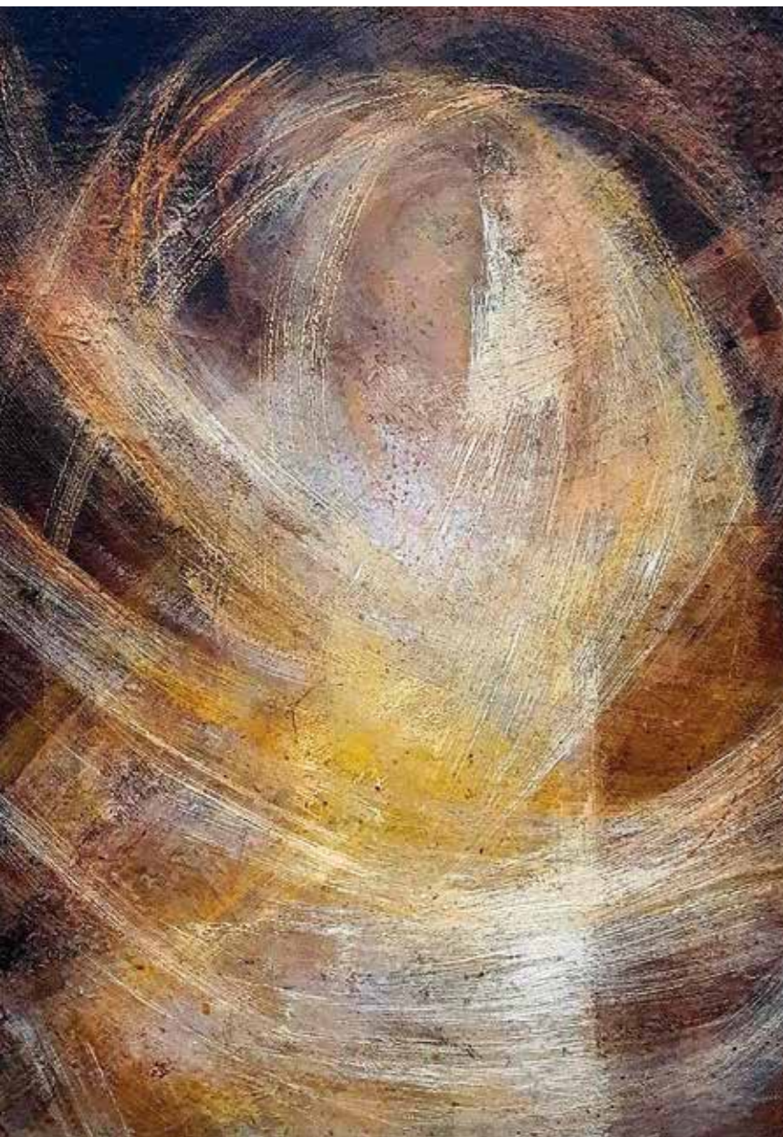
▲ Kucsera András: Üzenet , olaj, akril, 50x70 cm (a szerző engedélyével)

természetesen a filológiát művelő számos tudós is érzékelte, ám sokak folytatták tovább hangyaszigalommal a munkát, s raktak össze ma is használható szövegkiadásokat, bibliográfiákat, adattárakat. Én úgy gondolom, hogy ez a vita egyszerre volt