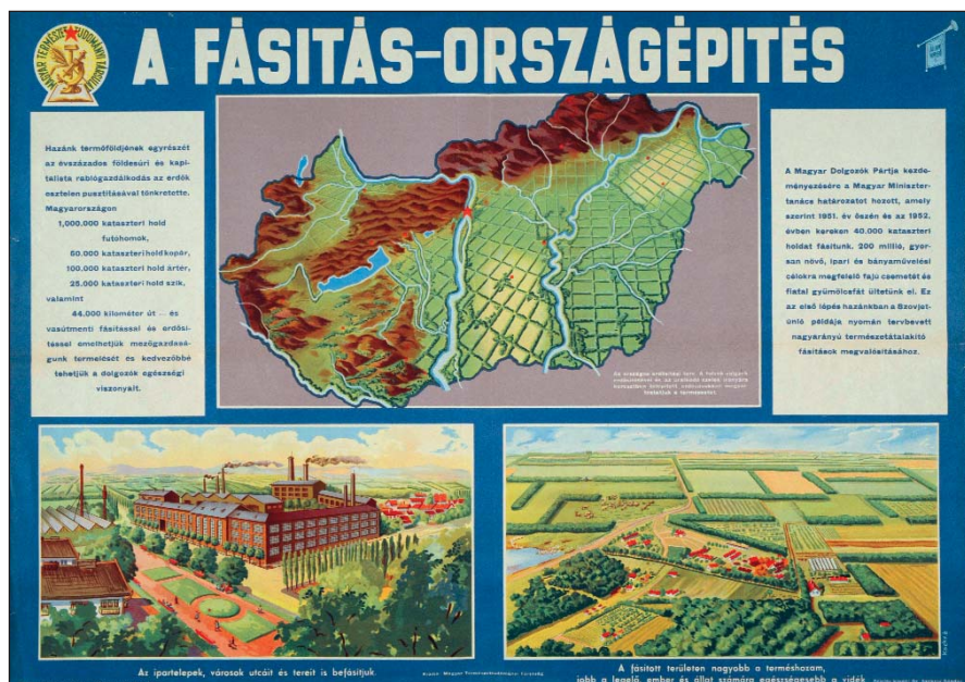
A fásítás – országépítés. Koch Ernőné plakátja 1952-ből.

Antal E. 1997: A Tisza szabályozásának éghajlatmódosító szerepe. Vízügyi Közlemények 79. 1. pp. 26–45.