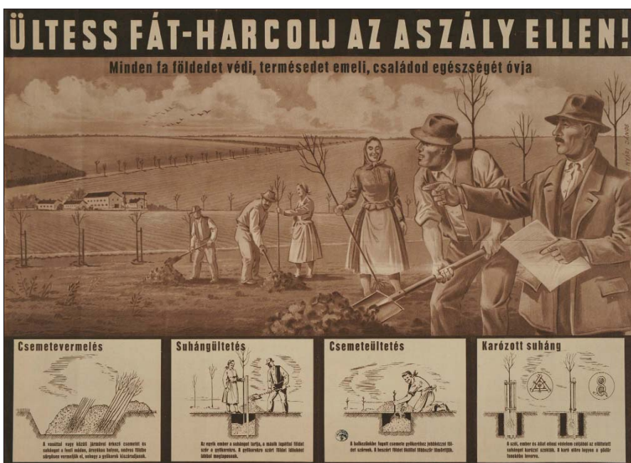
Ültess fát – barcolj az aszály ellen! Nyári János plakátja 1951-ből. Országos Széchenyi Könyvtár