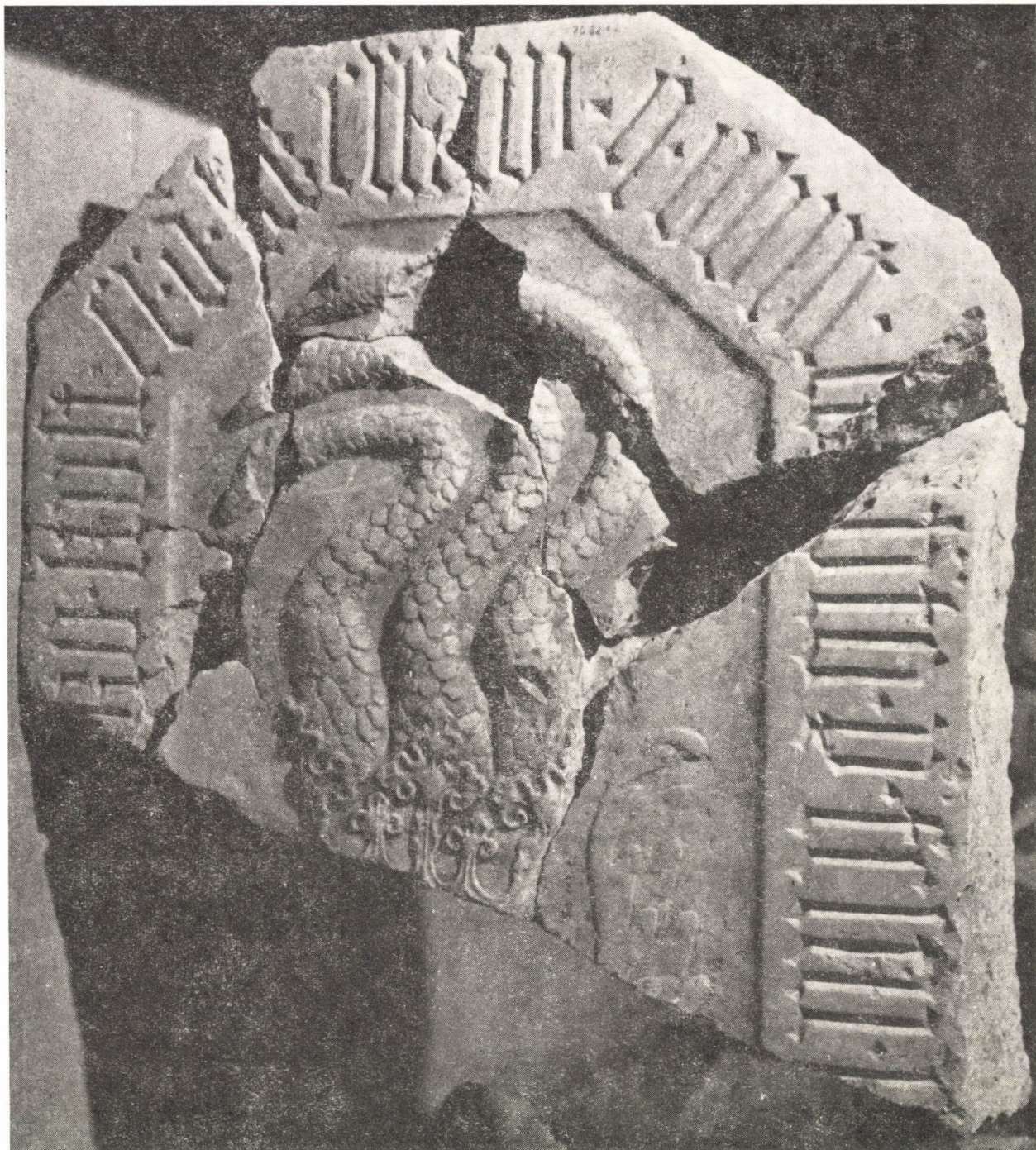
2. Ismeretlen sírkövének töredéke, 14. szd. vége—15. szd. eleje, Magyar Nemzeti Múzeum