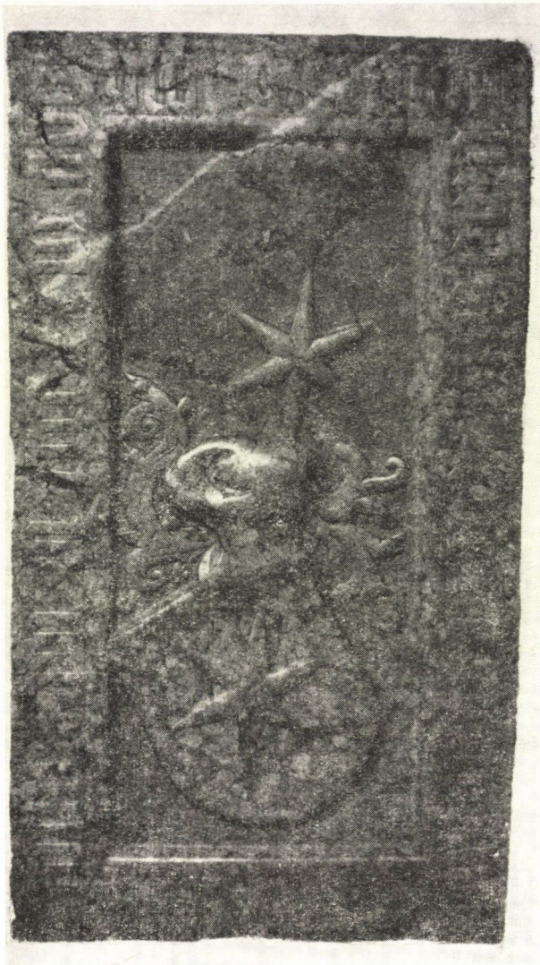
3. Bazini (I.) György sírköve, 1426 körül, Bazin

hossza: 186 cm szélessége: 103,5 cm felirattípus: minuscula