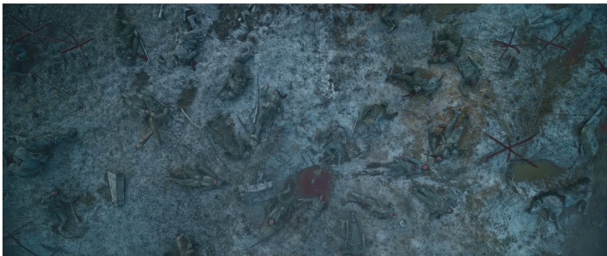
Nyugaton a helyzet változatlan (Im Westen nichts Neues. Edward Berger, 2022)

amikor megpróbálta megmutatni a háború valódi borzalmait, átlépte a képi reprezentáció írott és íratlan szabályait: halott brit katonákat mutatott meg olyan módokon, ami lehetetlenné tette a korábbi, a hivatalos háborús propaganda által kötelezően előírt reprezentációs módokat. A kép kiállításának háború alatti betiltása jól mutatja ennek a fajta ábrázolási hagyománynak az ellenkulturális státuszát, amely szisztematikusan törekszik a mítosz mögötti materiális valóság, a pátosz mögötti nyomorúság és az idealizáló elbeszélések mögötti sérülékeny, szenvedő emberi test megmutatására.