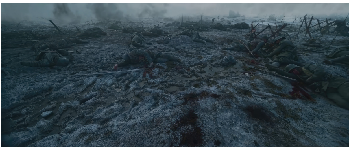
Nyugaton a helyzet változatlan (Im Westen nichts Neues. Edward Berger, 2022)

A Nyugaton a helyzet változatlan elején feltűnő harctér egyértelműen ehhez a deidealizáló hagyományhoz csatlakozik, amiben az emberi testet nem nemesíti meg, nem emeli fel, nem teszi halhatatlanná vagy a fájdalommal szemben ellenállóvá semmilyen hősiesség narratíva. A 21. században – részben a Nevinsonhoz hasonló művészeknek köszönhetően – úgy tűnik, hogy morálisan vált megkérdőjelezhetővé a háborút a dicsőséges hősiesség mítoszai szerint ábrázoló