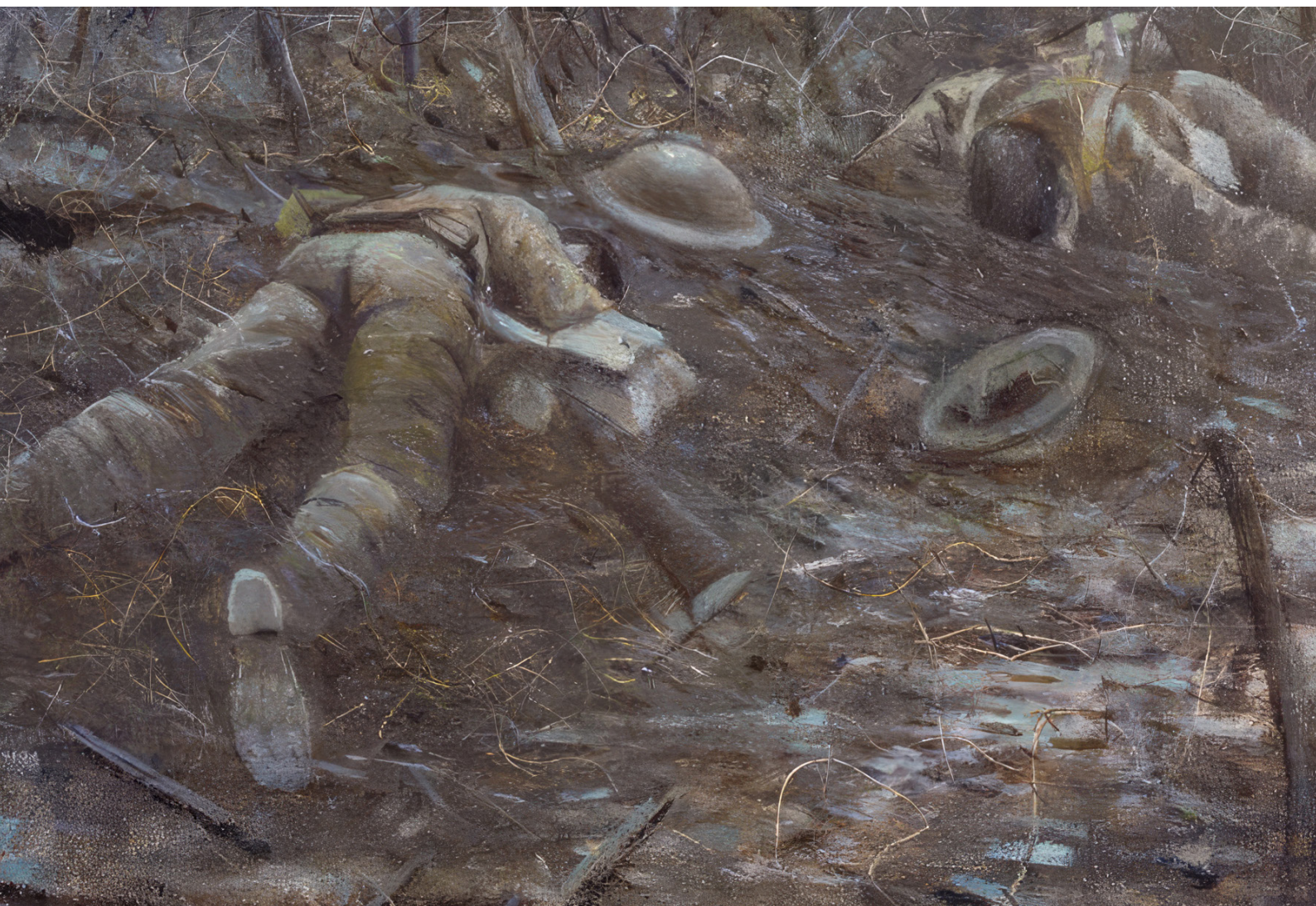
Christopher Nevinson: A dicsőség útjai (1918)

korábbi ábrázolásmód. Ezeken a filmekben a testi sérülések bemutatása gyakran naturalisztikus, a harctéren lévő katonák néha bevizelnek a félelemtől, a halál bemutatásából pedig hiányzik minden pátosz. A szenvedés és halál ábrázolásában megjelenik a történelmi trauma bemutatásának egyik legerőteljesebb trópusa, amit Walter Benjamin a német szomorújátról szóló könyvében megváltás (vagy kegyelem) nélküli halálnak nevez (Benjamin 1980: 367), amit a 21. századi film kontextusában nevezhetünk értelmetlen halálnak, azaz a testen túlmutató (szimbolikus, ideális) jelentés nélküli halálnak is. Ez a szemlélet Benjamin szerint is (ahogy Kaja Silverman szerint is) „csak a világ hanyatlásának állomásain” válik jelentékennyé (Benjamin 1980: 367), a traumatikus tapasztalatok ideálokot összetörő hatására, akkor, amikor a történelem álszent elbeszélései mögött láthatóvá válik „mindaz, ami kezdettől fogva alkalmatlan, szenvedésteli, elhibázott a történelemben” (Benjamin 1980: 366).