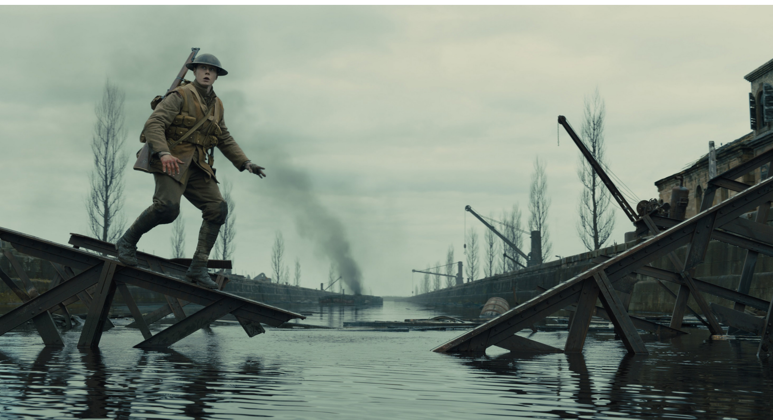
1917 (Sam Mendez, 2019)

a Minden idők legelképezhetőbb sörfuvarja pedig a Vietnamban harcoló barátok felé tett baráti gesztusról, hazai sörrrel való megítatásukról. Ez az ideológiai áthelyeződés azonban nem merül ki az erőszak kritikájában és a küldetés céljának demilitarizálásában. A 21. század pacifista háborús filmjei szakítanak a hagyományos elbeszélésekre jellemző fekete-fehér morális kódolással is, aminek része volt az ellenség démonizálása és a saját hősök idealizálása. Ezek a filmek előszeretettel leplezik le a propagandisztikus, ideologikus, militáns trópusokat és elbeszéléseket, illetve mutatják meg a hősiességek alszent, hazug voltát és a mögöttük lévő kegyetlen valóságot. A cél itt már sohasem szentesíti automatikusan az eszközt, a filmeknek pedig jellemzően része a számvetés, a küldetés céljának összevetése a közben megjelenő „járulékos” veszteségekkel.