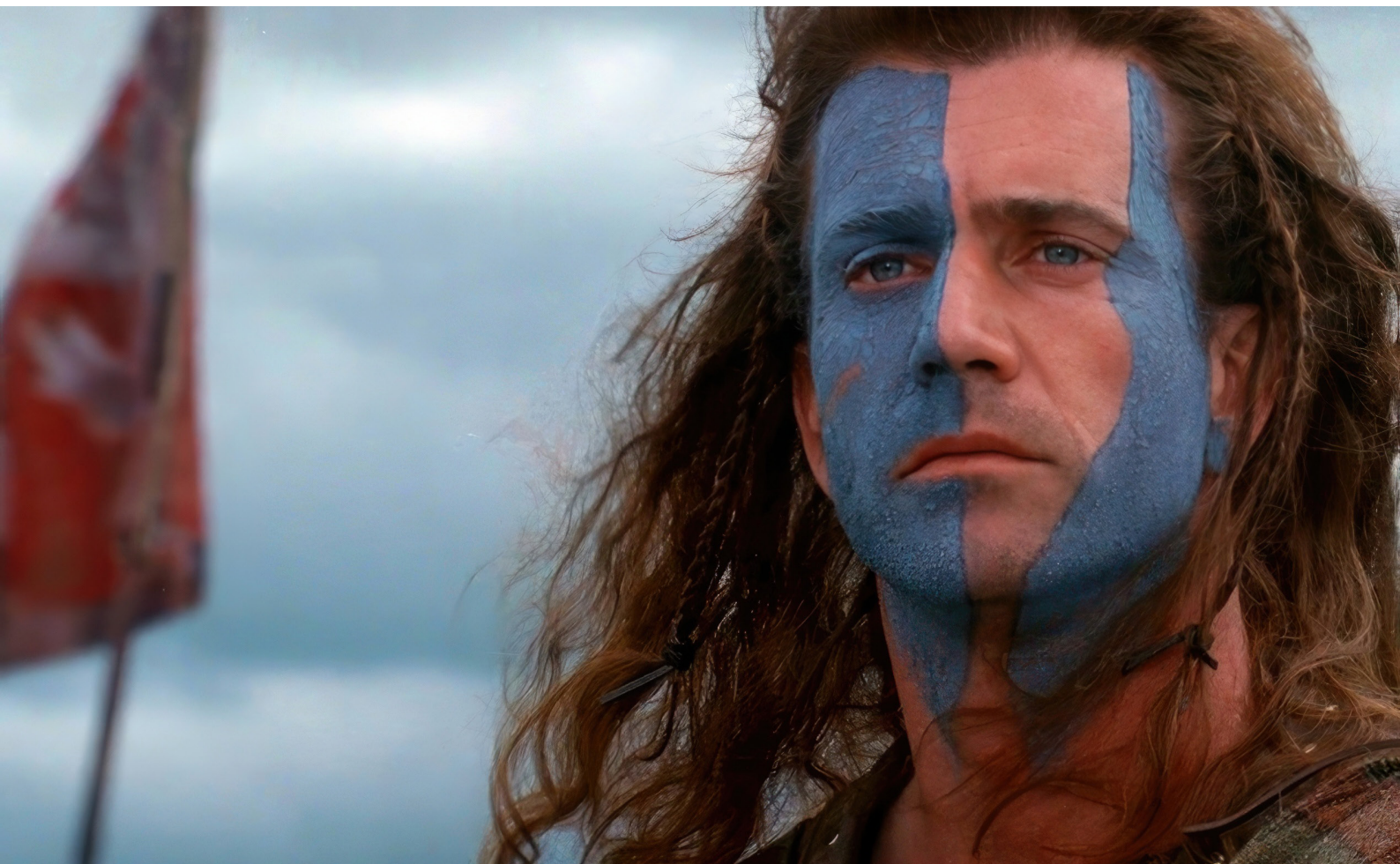
A rettenthetetlen (Braveheart. Mel Gibson, 1995)

épp ezen önfeláldozás folytán válnak örökkévalóvá. Amikor Wallace a kínpadon – már összetört, megcsönkített, kibelezett testtel – még utolsó leheletével is azt kiáltja, hogy „szabadság”, akkor ezzel az ideák primátusát demonstrálja a test fölött, és egy olyan hősiességek mítoszát affirmálja, aki képes kiemelkedni a történelem minden elsodró folyamából, és irányt adni annak.