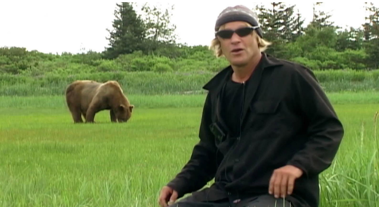
Timothy Treadwell A grizzlyemberben .

Nietzschét követve úgy gondolhatunk Treadwell kísérletére, mint egy sikeres tragikus előadásra: mint az emberek és a medvék világa közötti ellentmondások és feszültségek megélésére tett kísérletre, egy hibrid tér, egyfajta „természetes színház” létrehozására. 13 Még az a szörnyű ár, amelyet tizenhárom nyár után egy ismeretlen medve fogai és karmai között fizetett meg, sem bizonyíték arra, hogy a természet és a kultúra nem tud együttlétezni, vagy épp ellenkezőleg, harmonikusabb vagy mélyebb egyesítésükre kéne törekednünk. Az emberi és nem emberi élet közötti dinamikus határvonal nem simítja el a különbségeket, viszont a szóban forgó különbözőképpen megélt világok sokkal konkrétabbak és komplexebbek, mint ahogy az identitáselvű szeparáció vagy a nem identitáselvű „valamivé válások” sugallják.