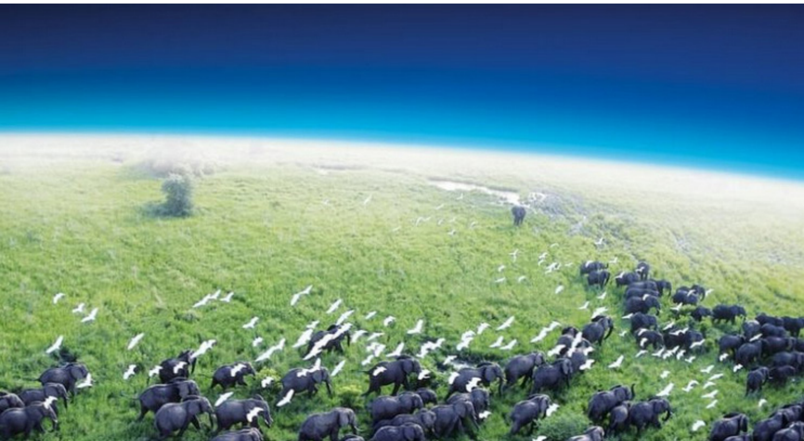
Bolygónk, a Föld – az űrből nézett Föld képe.

17). A fokozott optika a reprezentáció végének hírnöke; ikonikus reprezentáció nélkül és képek nélkül, melyek a láthatatlanra mutatnak, a látható világegyetem eltűnik. Az optikai túlexponálás viszonyai között, amit Virilio a „reprezentáció nullfokának” nevez, maga a világ tűnik el.