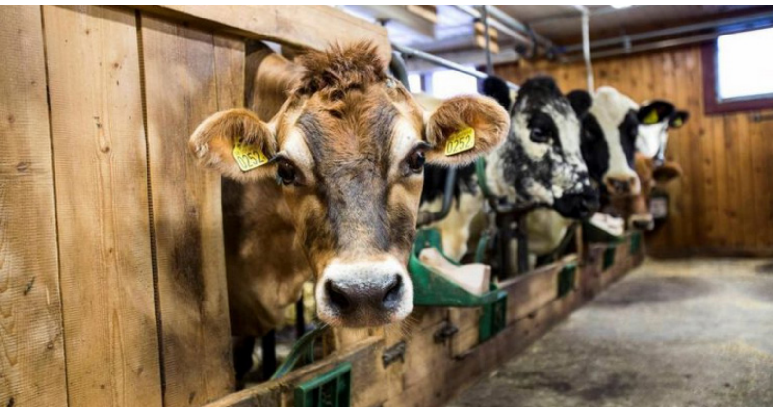
Istállóban várakozó tehenek a Földlakók ban.

A Földlakók állatbántalmazásról készült leginkább aggasztó felvételei komplex képet nyújtanak a hatalom működéséről. Azt a képzetet, hogy az állatok pusztán tárgyak, gyakran használják arra, hogy a többi állat feletti emberi dominanciát magyarázzák, ám annak ellenére, hogy a Földlakók ezt megismétli, a felvételek másról árulkodnak: a sertéseknek és az elefántoknak szóló káromkodásoknak, amelyek a vágóhídi munkások és cirkuszi idomárok által elkövetett fizikai bántalmazáshoz társulnak, kevés értelmük lenne, ha az elkövetők azt hinnék, hogy az állatok tárgyak. Bár az intézmények a nem emberi állatok „tárgyszerű” státuszától függnek, a bántalmazók valójában nem nem-érező „másokként”, hanem sebezhető személyként kezelik az állatokat. A rokonság és a másság tehát dinamikus, állandóan változó konstrukciók abban, amit Colin Dayan (2011) „a személy létrehozása és megszüntetése” folyamatos árapályának nevez.