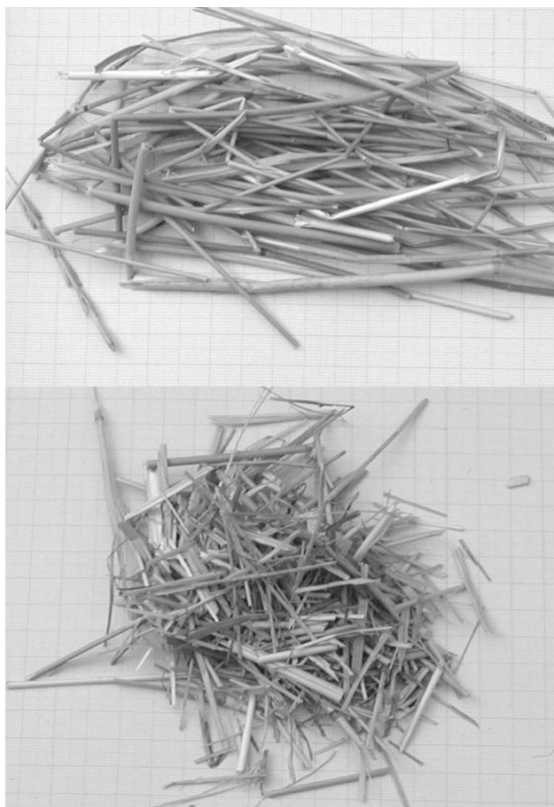
1. ábra – Az óriásfű

4.táblázat – Az üzemi kísérlethez felhasznált fa – és fás anyagok aránya, 15,77 m 3 kész farostlemezre vetítve.