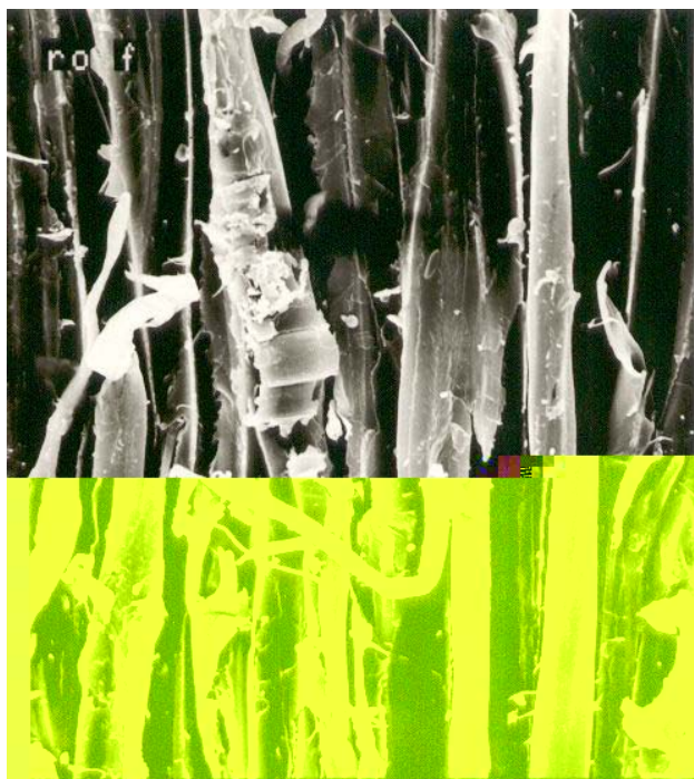
1. ábra – Akácfából laboratóriumi defibrátorban feltárt rosthalmaz raszter elektrton mikroszkóppal felvett képe, 500x-os nagyításban