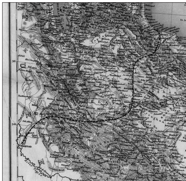
1. ábra. A kaukázusi kiképzőmisszió hozzávetőleges útvonala Enzelibe, 1918. január–február

Zavarosak voltak a hírek Kúcsek kán britekhez való viszonyáról. Az egyik brit ügynök garanciát kapott tőle, hogy átengedi a gépkocsioszlopot, 51 más beszámolók szerint Kúcsek kán harcosai támadni kívántak, ám nem kaptak garanciát Enzeliből, a visszavonuló orosz csapatok legközelebbi központjából arra, hogy az orosz csapatok nem fognak beavatkozni, ha a menetoszlopaik között manőverező angol gépkocsioszlopot támadás éri. 52 Ebben az esetben Dunsterville-nak egyszerűen az általános káosz játszott a kezére, hogy elérje Enzelit, mivel az oroszok valószínűleg nem a britek iránti jó szándékból nem adtak garanciát, hanem csak egyszerűen képtelenek voltak kontrollálni a visszaözlőket, és éppen ezért felelősséget sem tudtak vállalni a reakcióikért. Ezzel együtt elképzelhető, hogy Goldsmith valóban kapott szóbeli ígéretet a kántól, csakhogy ezt a megegyezést a dzsangalík az alakulat törbecsalására próbálták felhasználni.