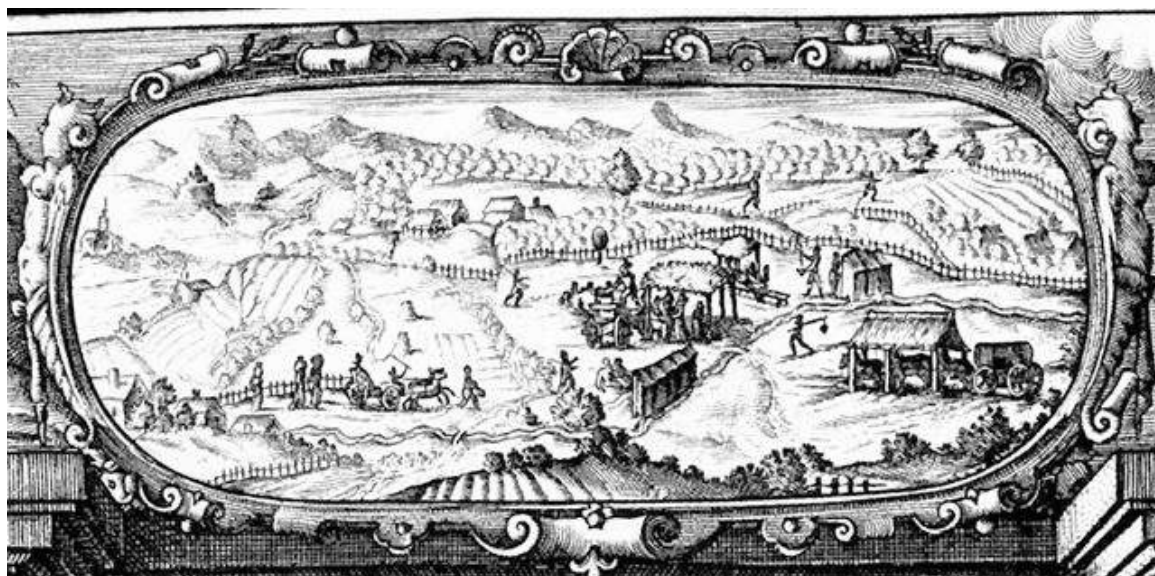
A tarcsai savanyúvíz-forrás ábrázolása. Regensburg, 1621. (Részlet a Scaturigo salutis címlapmetszetéről)