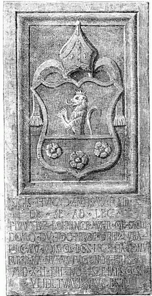
Angerianus epigrammája. 1512. (Poetae tres elegantissimi. Paris, 1582.)