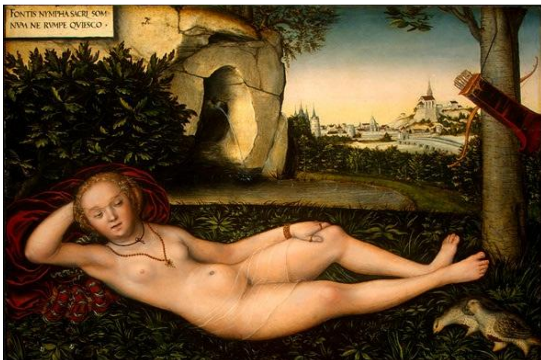
Id. Lucas Cranach (1472-1553): A forrás nimfája 1540. (Táblakép. Washington, National Gallery of Art)