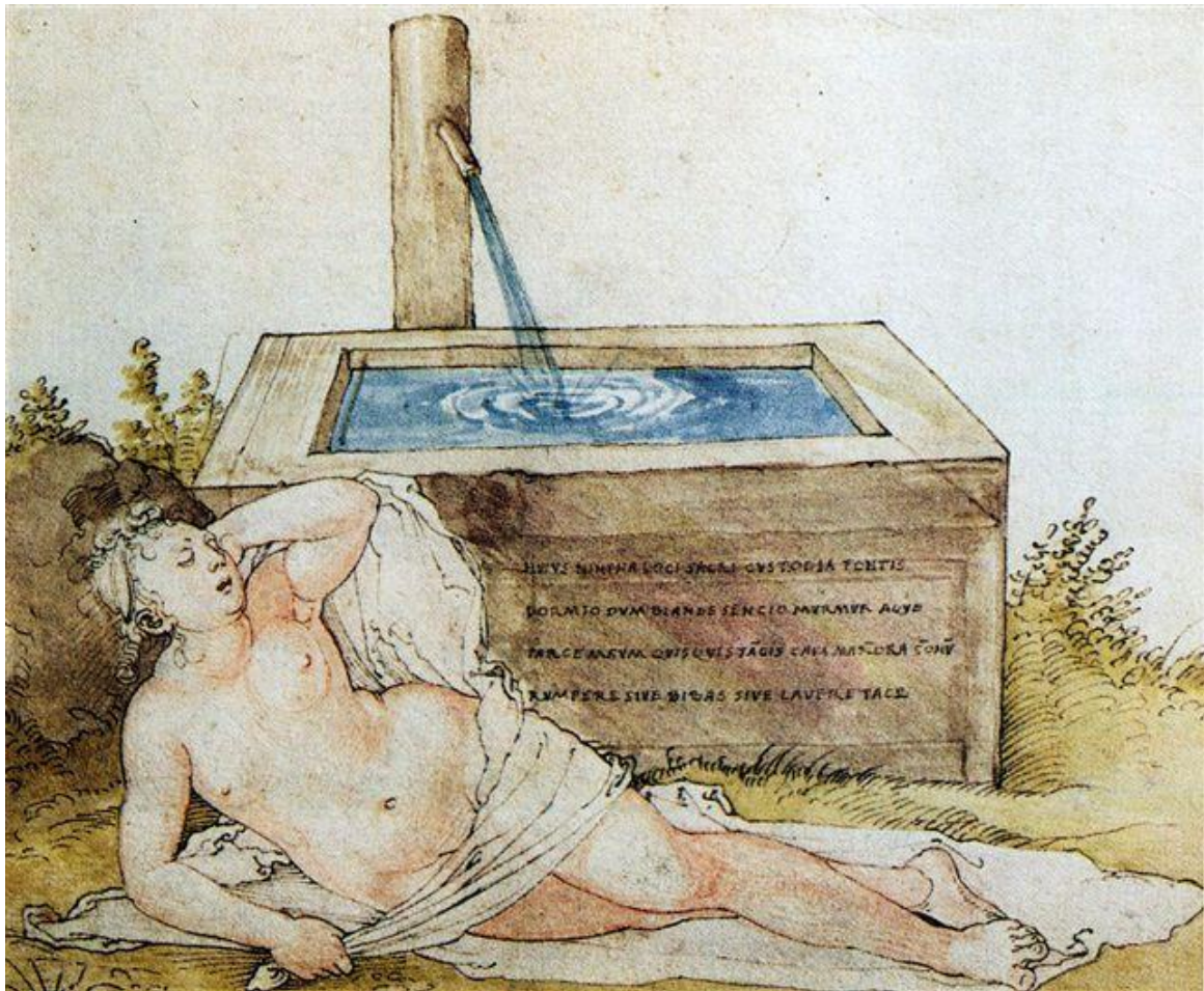
Albrecht Dürer (1471-1528): A forrás nimfája 1525. (Színezett tollrajz. Bécs, Kunsthistorisches Museum)