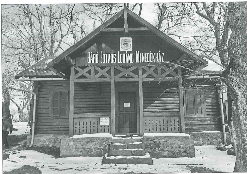
A Báró Eötvös Loránd Menedékház 2019-ben

Eötvös Loránd emlékét hirdető BEAC-Maxi-nak, 12 mely az utóbbi években már Turista Kékszalag 110 kilométeres teljesítménytúra néven szerepel.