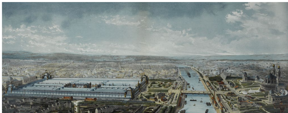
1. illusztráció: A kiállítási csarnok és a Trocadero palota Párizsban az 1878-as világkiállítás idején