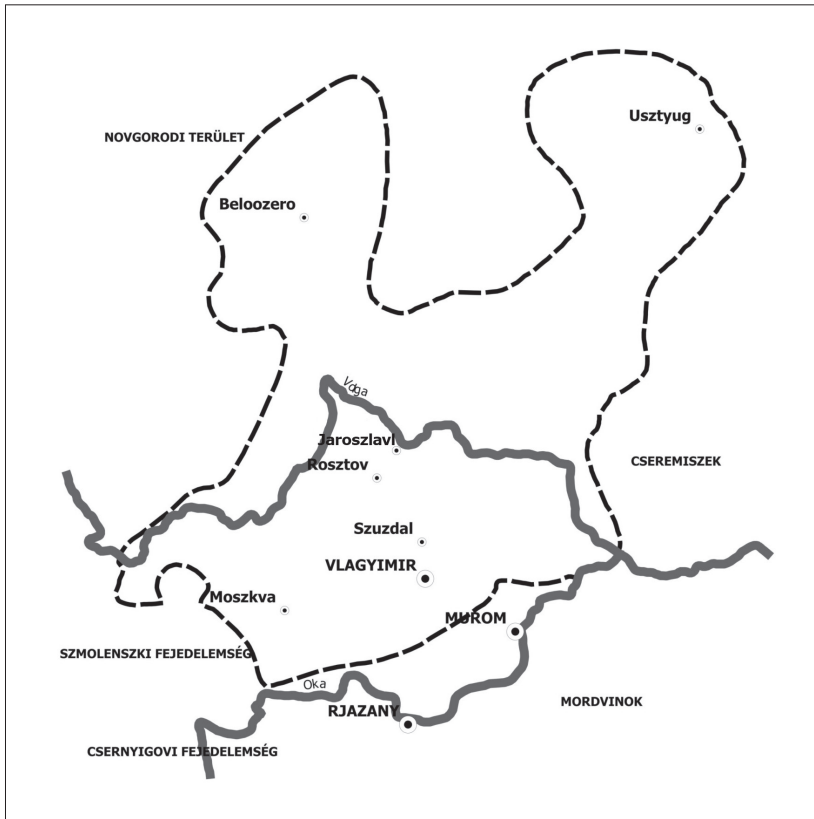
A Vlagyimír-szuzdali Fejedelemség a 13. század elején