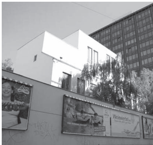
A Wittgenstein tervezte ház látképe ma

lehetett az önálló osztrák filozófia kialakulására is. A tankönyvek a Monarchiában használatos más nyelveken is megjelentek: lengyelül, olaszul és magyarul. Az utóbbi Riedl Szende germanistának – Riedl Frigyes irodalomtörténész apjának – köszönhető. Ezekből a könyvekből tanulhatott Alexander Bernát is, akit a gimnáziumban maga Riedl Szende tanított filozófiára. Tanára tanácsára Alexander a Bécsi Egyetemen hallgatta is Zimmermann-t – mint ahogyan hozzá hasonlóan más magyar diákok is. 171 A legfrissebb levéltári kutatások alapján Husserl sem csak Brentanótól, hanem Zimmermann-tól is bőségesen vett fel órákat a Bécsi Egyetemen, emellett Zimmermann logikáját is tanulmányozta – s egyiket sem tette haszontalannul. 172 Emellett vannak, akik Zimmermannra mint a Bécsi Kör előfutárára tekintenek. 173 Neurath a már említett, a Bécsi Kör keletkezéséről írott munkájában az osztrák antikantiánus, empirista-logicista hagyomány XIX. századi képviselőjeként emelte ki. 174