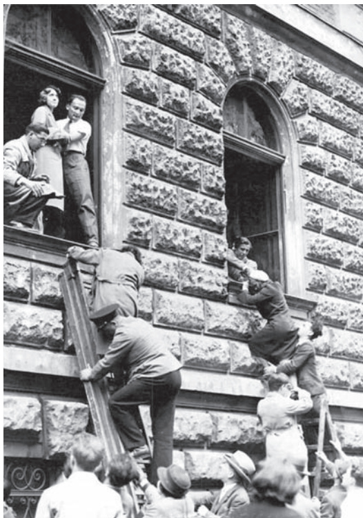
Zsidó diákok kimenekítése az Anatómiai Intézetből diáktársaik támadása előtt Bécs, 1933

nek, kényszerű emigrációjának és hatástörténetének vizsgálatakor – nyilvánvalóan alapvető jelentőségű. Emellett a Haller-féle történetmondás a szűken (= a második Osztrák Köztársaság területére) értelmezett osztrák filozófia helyett tágabb kontextusra irányul, abban az értelemben, hogy elvileg a régi Monarchia egész területét (= a ma lengyel, cseh, szlovák, szlovén, ukrán, olasz, magyar országhatárok közé eső területeket) is bevonja a tárgyalásba. A gyakorlatban a nyelvi korlátok persze – főként eleinte – többnyire leszűkítették a vizsgált szövegtörzset. Ennélfogva a kutatások erősen német nyelv centrikusak maradtak – abban az értelemben is, hogy a német nyelvű centrumoknak a Monarchia távoli sarkaiba való kisugárzását tematizálták. E korlátok mellett is azonban azzal, hogy a koncepció a mai status quo szerint egy közép-európai kontextust jelölt ki, előre vetítette az azóta az egyéb bölcsészeti- és társadalomtudományokban is virágzásnak indult Közép-Európa-kutatásokat.