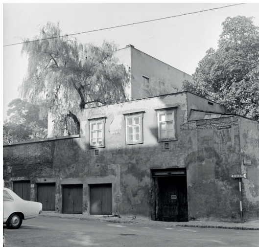
A Wittgenstein tervezte ház (Bécs, Kundmann-gasse 17.) látképe 1971-ben

a fő célpontja. Ez az esetleges külső körülmény következménnyel járt a háború utáni tudomány alakulására; mint ahogyan az is, hogy a háború után ugyanez az angolszász világ volt abban a helyzetben, hogy a lerombolt, zilált, deprimált és demoralizált Ausztria anyagi és szellemi újjáépítésében segítsen, és hogy tanulmányutak megfelelő helye lehessen. 168 Azoknak a fiatal filozófusoknak, akik az emigrált tudósokkal folytatott eszmecseréken és angliai–amerikai utakon nevelődtek ki, minden tapasztalatuk arról szólt, hogy a filozófia centrumai Angliában és Amerikában vannak. Amikor a francia szálát kiejtették a hagyományok