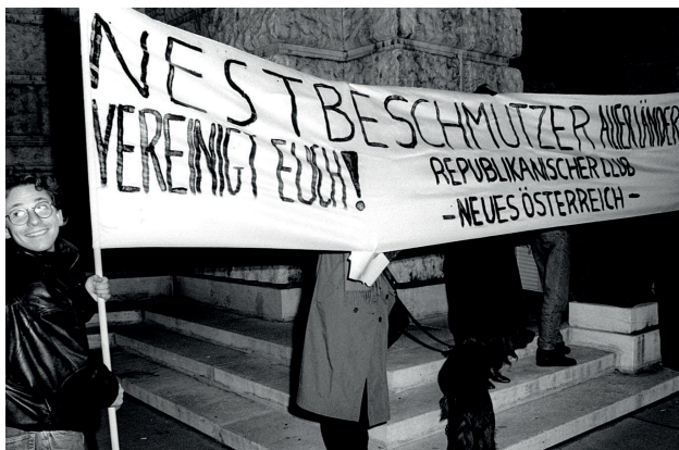
Tiltakozás Thomas Bernhard Heldenplatz című darabja ellen, 1988

Abba a nemzeti énképbe, amelyet az „első áldozat” mítosz definiált, nem illett bele a Bécsi Kör felől megfogalmazott önálló osztrák filozófia koncepciója. A kör tagjai többségükben áldozatok voltak: olyanok, akik kényszerűségről emigráltak. Akik miatt emigráltak, azok viszont nem lehetnek a németek, hiszen még az előtt elhagyták Ausztriát, hogy a németek bevonultak volna. Csak osztrákok lehetnek a tettesek. Emellett az emigránsokkal szemben eufemisztikusan szólva meglehetősen ambivalens volt a viszony az 1945 utáni Ausztriában: nemcsak az egyetemen gyorsan be/visszarendekezett professzorok nem akartak (a maguk szempontjából érthetően) konkurrensüket, hanem a politikai szereplők