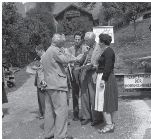
Kerényi Károly (jobbról a második) Alpbachban, 1955-ben