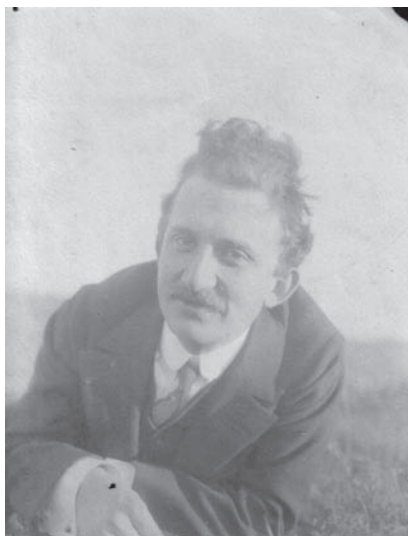
Lukács György (1910 körül)

Ugyanebben az évben jelent meg Babits Bergsonról szóló terjedelmes írása is – „Bergson alapfogalmainak precíz, hű és értő összefoglalása”. 37 Babits lelkesen üdvözlö, hogy a francia filzófus „visszaadta nekünk a metafizikát”. 38 Fejtegetéseit ekképp zárja: „Nem a metafizika ellenkezik a józan ember ösztönével [...], hanem a mechanisztikus felfogás erőltetése az életjelenségekre: ez az, ami józan embernek nevetséges vagy abszurdum szokott lenni a filozófiában.” 39 A józanságot tehát Babits nem állítja szembe, hanem nagyon is összeegyeztethetőnek tartja a metafizikával. Nyilván ezzel is magyarázható, hogy a Lukáccsal folytatott polémiában sem játssza ki az ismert „magyar kártyát”: nem mondja, hogy maga a metafizika volna idegen a gyakorlatias, józan magyar szellemtől és kultúrától. Percz László éles szemmel veszi észre, hogy a magyar kultúra filozófiátlanságának szempontját