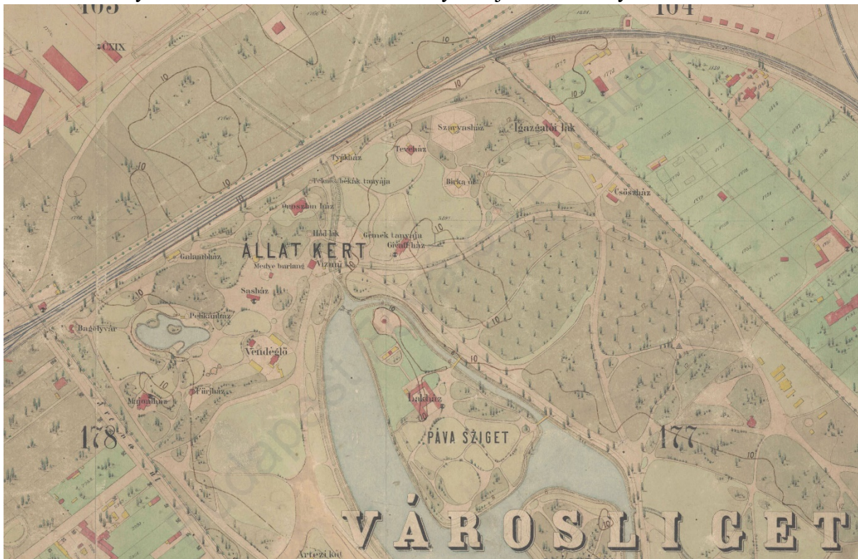
4. kép. Az állatkert térképe 1878-ból. (BFL XV.16.e.251.023 0018. szelvény)

akinek a neve az utóbbi években országosan ismertté vált. Ez annak köszönhető, hogy a 2020-ban világméretű járványt okozó koronavírus elleni küzdelemben kulcsszerepet játszó mRNS alapú oltás sikeres fejlesztésében részt vevő, munkásságáért orvosi Nobel-díjat kapott Karikó Katalin a Jermyről elnevezett természettudományos díjat elsőként nyerte el 1973-ban. 38