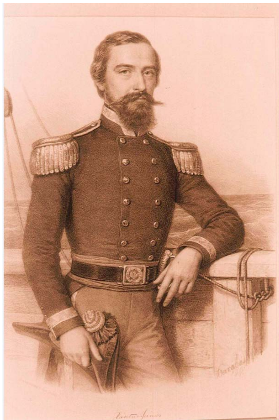
2. kép. Xantus János. Fáradhatatlanul dolgozott, hogy Magyarországnak állandó állatkertje legyen. Igazgató volt 1866 és 1868 között.

szeretné, ha azt gondolnák, hogy a pozíció miatt dolgozott ennyit az intézmény létrehozásáért. 2 A háttérben azonban az húzódnak meg, hogy az 1848–49-es szabadságharcban vállalt szerepe miatt az udvari körök nem nézték volna jó szemmel kinevezését. 3