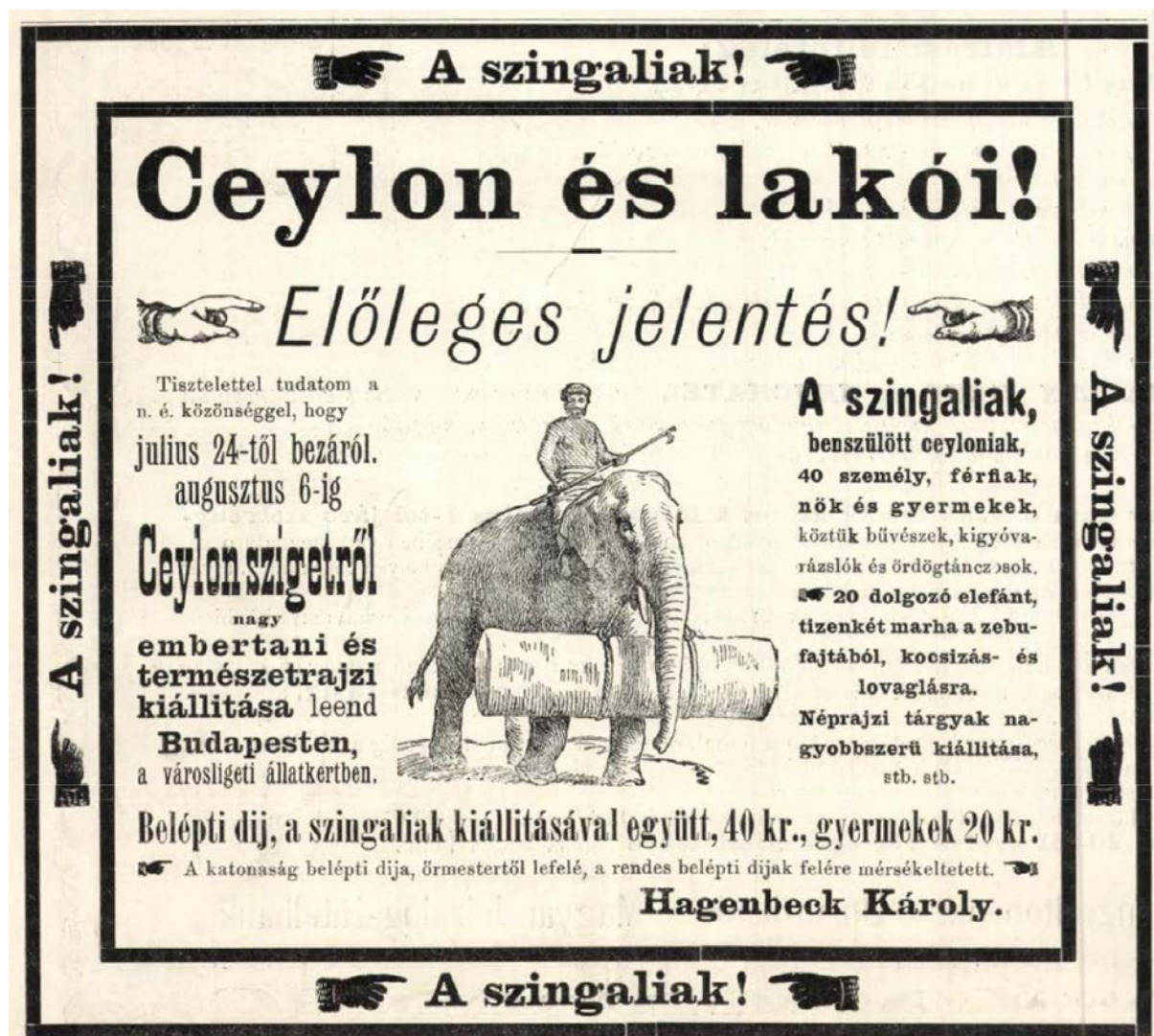
3. kép. Állatkerti etnográfiai műsor hirdetése 1884-ből. (Bolond Istók, 1884. július 20. 12. p.)