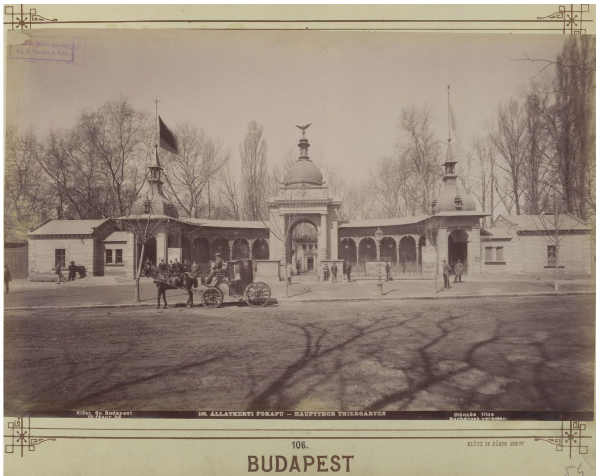
4. kép. Az állatkert régi főbejárata, amelyet 1885-ben a mutatványos fellépésekből származó bevételből építettek fel. ( BFL XV.19.d.1.07.107 )

növekedéséhez vezetett. 1875-re a sokáig eredménytelenül kért fővárosi támogatást is több évre megkapta az intézmény. 23