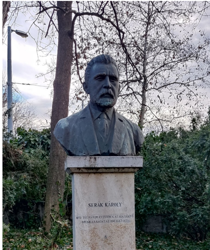
5. kép. Serák Károly mellszobra a Fővárosi Állat- és Növénykertben. Felirat: 1873-tól három évtizeden át igazgató. Munkásságát az idő igazolta.

körülményekhez és lehetőségekhez, valamint az európai állatkertvezetési trendekhez jól alkalmazkodó üzletemberként mutatják be. 26 Mindenesetre az biztos, hogy Serák Károly vezette leghosszabb ideig a városligeti intézményt az állatkert közel 160 éves története során. 1873-as kinevezésével sikerült három évtizedre biztosítani a városligeti kert igazgatói székét, ami minden bizonnyal egy stabil társulat képét mutatta a külvilág és a főváros felé. Nem véletlen, hogy mellszobra megtalálható a Fővárosi Állat- és Növénykert főbejáratától jobbra induló emléksétányon, ahol a budapesti állatkert legnagyobb vezetőinek állítottak emléket.