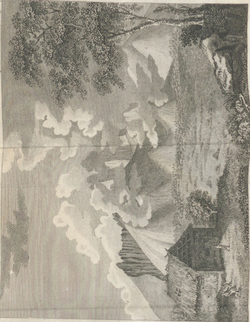
Vue des Alpes Carpathiennes, près de Resmark.