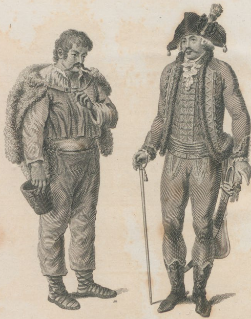
A Hungarian Nobleman & Peasant in their national Dress.

London, Published by G. G. & J. Robinson, Pall-mall Row, July 1 st 1796.