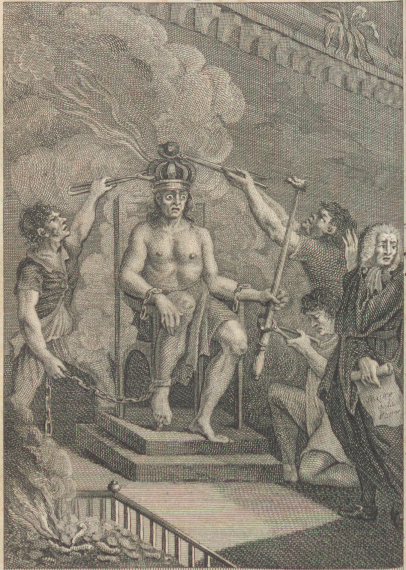
Effroyable chatiment infligé à un chef de rebelles, dans le XVI eme Siecle.