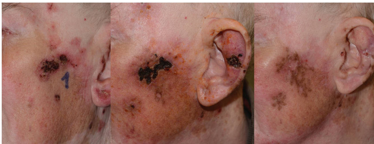
1. ábra | Elektrokemoterápiás kezelés előtti és utáni állapot (1 és 3 hónap múlva). A kezelést követően gyakran alakul ki fekélyesedés, pörkképződés, postinflammatoricus hiperpigmentáció a tüelektródák behatolása mentén. A beteg fülkagylóján lévő bőrdaganat kezelésekor kihasználtuk az elektrokemoterápia szövettímelő tulajdonságát, így nem volt szükség csonkoló műtét elvégzésére

Bőrünk nem csupán fizikai barrierként funkcionál, hanem önálló immunológiai szervként is felfogható [4], melynek megfelelő működéséhez hozzájárulnak a dermisben elhelyezkedő dendritikus sejtek, illetve az epidermisben megtalálható Langerhans-sejtek, melyek a T-sejt-aktiváción keresztül a primer immunválasz létrejöttéhez, az immuntolerancia kialakításához is hozzájárulnak. A krónikus immunuszuppresszív gyógyszeres kezelés és/vagy a krónikus napfény-expozíció a bőr saját immunrendszerének károsodását okozza, melyben nagy szerepe van a dendritikus sejtek funkciókárosodásának. Szervátültetett betegekben in vivo kísérletek segítségével kimutatták, hogy nemcsak a dendritikus sejtek károsodnak, de