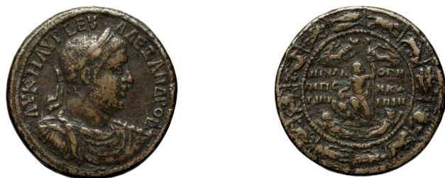
Fig. 1. A brigetióiival megegyező típusú darab a párizsi Cabinet des médailles-ből ( https://gallica.bnf.fr/edit/conditions-dutilisation-des-contenus-de-gallica )

A nemzetközi árverési adatbázisokban jelenleg, 2021 májusában négy eredeti darab található a historikus tételek között. Ezekből kettőt 2011 előtt árvereztek, tehát biztosan nem lehetnek azonosak az általunk tárgyalt darabokkal, míg a másik kettő a sérüléseik és a proveniencia illetve a patina színe 6 miatt nem jönnek számításba.