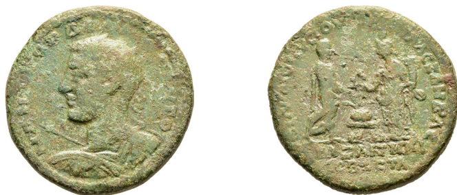
Fig. 4. A brigetio legiotáborában talált medalion

A medalion meglehetősen ritka, 2019-ben egy aukción kelt el egy nagyon hasonló darab, ám eltérő előlapi körirattal. 8 Előlapi egyezést viszont egy másik Párizsban őrzött darabbal mutat. 9