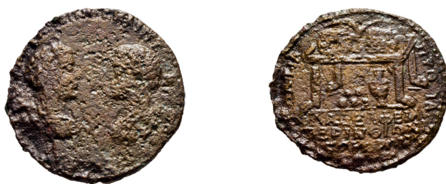
Fig. 2. A Brigetio polgárvárosában talált medalion

A medalion 2012-ben a polgárvárosból került elő, szerencsére ásatási körülmények között. A Vásártér keleti feléből előkerült darab Perinthusban készült. A medalion a felső humuszrétegből került elő a VI. ház északkeleti részén (Fig. 3), így stratigráfiai következtetések levonására nem alkalmas. Brigetio polgárvárosát viszont tudjuk, hogy 252 körül hagyták fel, így csak pár évtizeden belül jutott el a Dunára, és került a föld alá. Fontos azonban megjegyezni, hogy az alapvetően katonai kontextusból ismert keleti medalionokkal szemben, ez a darab egyértelműen polgári környezetből került elő.