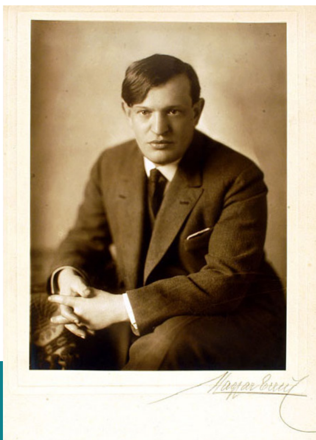
Karinthy Frigyes, 1925 körül. nemzetikonyvtar.blog.hu