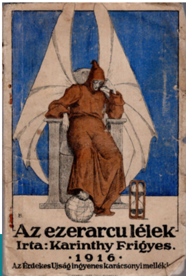
Karinyth Frigyes: Az ezerarcu lélek, 1916.

kidolgozni a kiáltvány szövegét, hiszen pontjait itt még nem ismerjük, csak egy rövid hivatkozás erejéig tudjuk meg, hogy a „szabadnak született ember jogairól szól”. 43