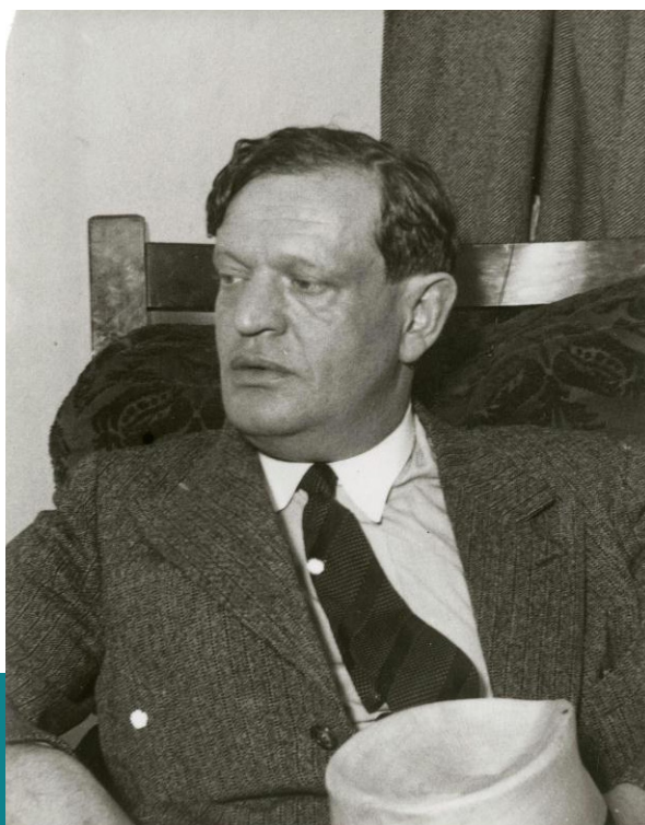
Karinyth Frigyes, 1930 körül.

Karinthy elképzelése szerint ebből az „áloméletből”, csak az álom-logikájával ellentétes lelki mozdulattal, például egy artikulátlan kiáltással, vagy nevetéssel lehet felébredni, az igazi valóságra , vagyis egyfajta halál utáni ébredésre gondol, mely sem nem az általunk ismert élet, sem a halál, hanem valami azon túli „harmadik állapot”, egy individuális túlvilág, ami mindig az álomélettel párhuzamosan létező valóság.