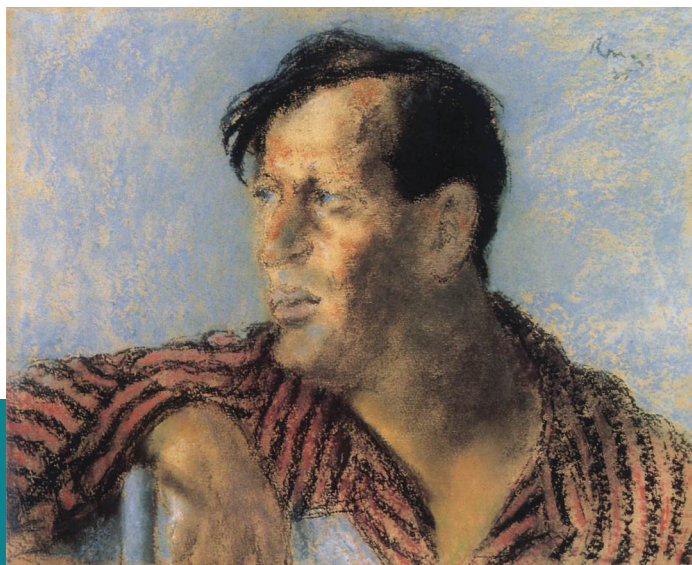
Rippl-Rónai József (1861–1927): Kariny Frigyes, 1925. Pasztell. PIM

analízis nagyon posztmodern természetű tartalma, hogy az (elfedő) retorizálást kiváltó vágyat megragadja, mivel annak megragadása lényege szerint nem lehetséges, hiszen a jelöltről mindig kiderül, hogy valójában jelölő, és újabb megértésre szorul. Így a személyiség feloldódik, szétszóródik, léte temporalizálódik. 21