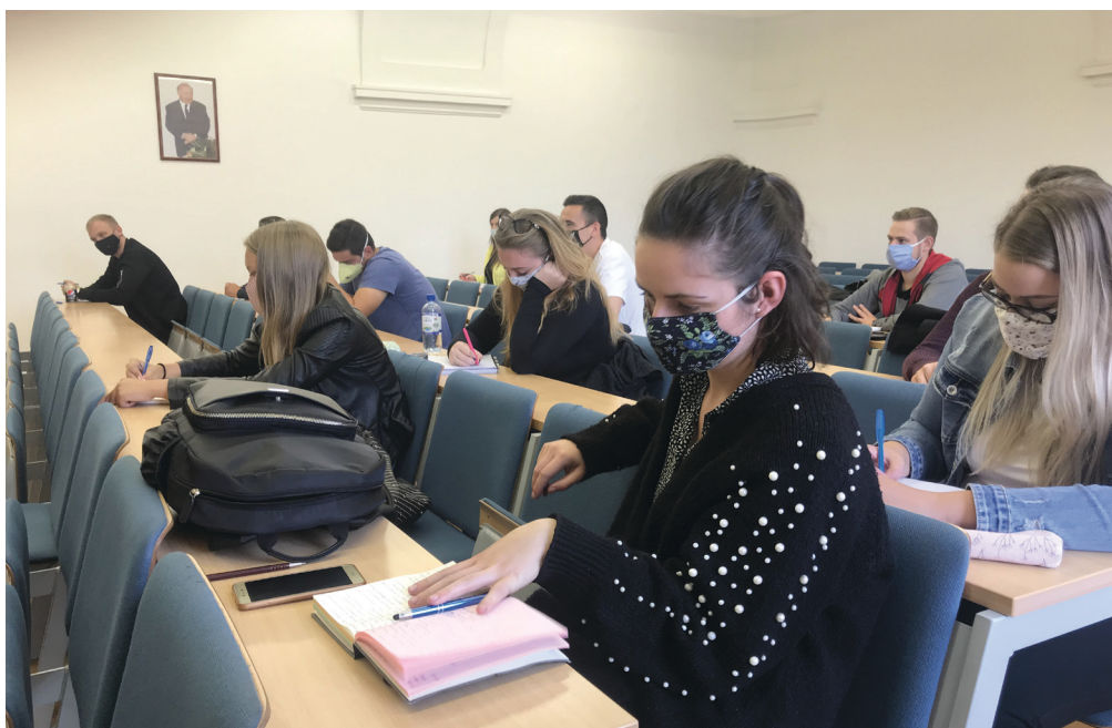
6. kép: Egyetemes történelmi szeminárium a Nagy József Teremben 2021. szeptember 28-án, a Covid-járvány alatt. A falon halványan az egykori tanszékvezető portréja látható.