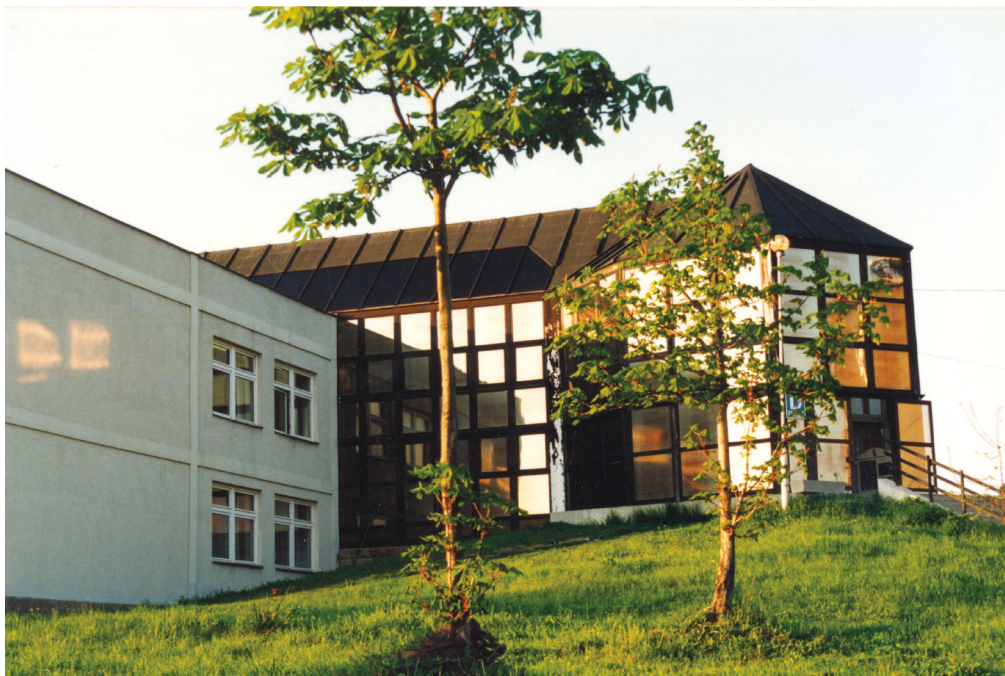
2. kép: Az Eszterházy Károly Főiskola D épülete az 1990-es években.

Az 1970-es években a terem a 11-es (XI-es) sorszámot viselte. 5 1991-ben a tanszék a Líceum tornyából az Almagyar-dombra, a főiskola Leányka úti, újonnan épült, D jelű épületébe költözött. A régi hely a fejlesztésnek, laborkiépítésnek, az új oktatók elhelyezésének igényeit már nem tudta kielégíteni. A D épületben az oktatók megnyugtatóbb körülmények közé kerültek, 2-3 fő kapott egy-egy tanári szobát. A laborok kialakítását viszont csak kisebb átalakításokkal sikerült megvalósítani, mivel az oktatási egység rendelkezésére átadott helyiségeket eredetileg a nyelvi képzés céljaira tervezték. 6