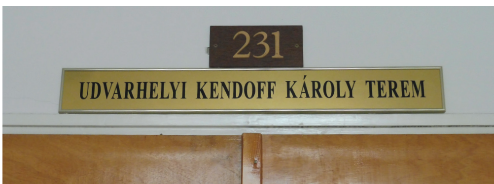
3. kép: Az Udvarhelyi Kendoff Károly Terem felirata a D épületben 2021-ben.