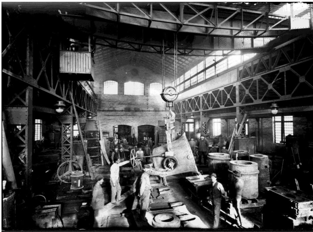
4. sz. kép

harmadrészt pedig a telepi lakosság személyes élményeihez fűződően nyertek elnevezést (Amerika, Gyármögött, Fasor, Paplakás, Kis-hegy, Mészárszék-sor, Kemence-sor, Rampa, Kaszinó-sor, Dühöngő).