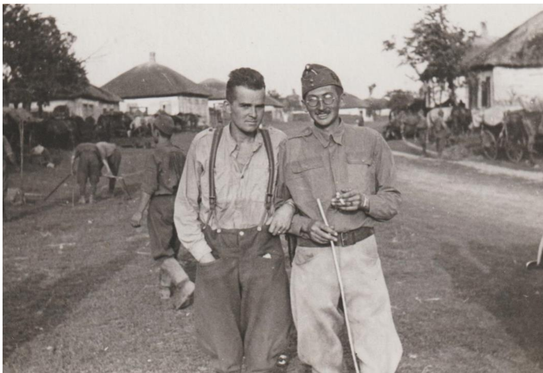
7. sz. kép