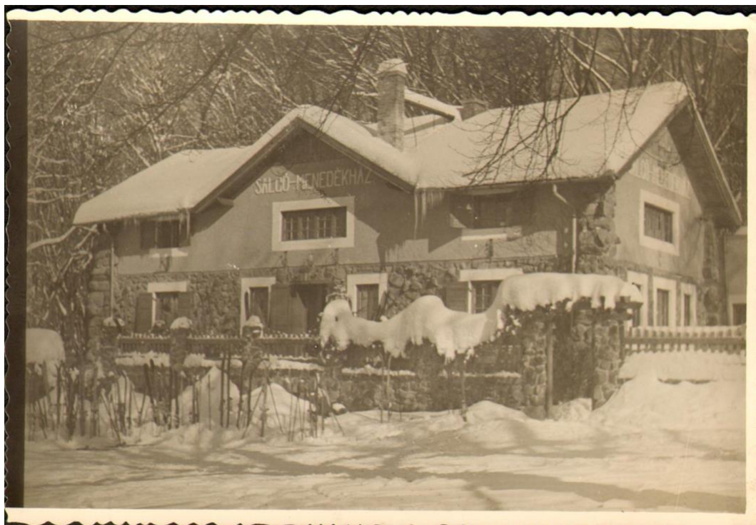
9. sz. kép

A menedékház korabeli fotón. (Dornyay Béla Múzeum Fotótára ltsz. 4855.)