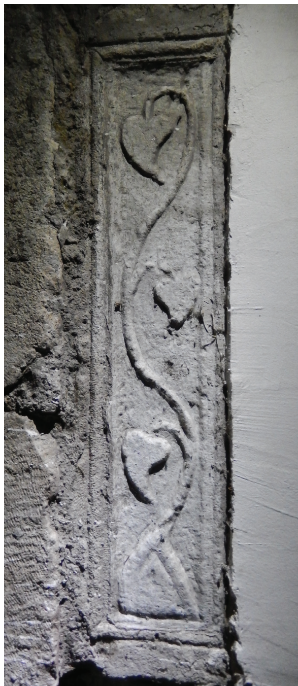
13. kép – A Nr. 14 kőemlék a református templom falában, 2020. június