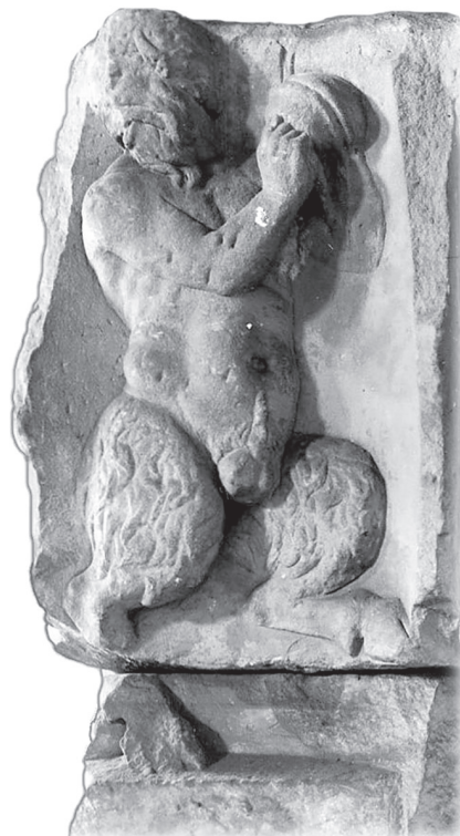
11. kép – Cymbalán játszó Pán egy neumageni sírépítményen (Michel Reddé felvétele alapján, Lupa 32611)

cymbalumon játszanak. 107 Egy thiasos t ábrázoló dunaszekcsői votív reliefen két kentaur kezében figyelhető meg cymbala . 108 A thiasos megszokott résztvevői közül olykor egy-egy mezítelen felsőtestű, szakállas satyros , 109 avagy Pán is cymbalán játszik. 110 Utóbbiak nyomán a dunavecsei szakállas férfit is cymbalán játszó satyros ként, esetleg Pánként azonosíthatjuk (10–11. kép).