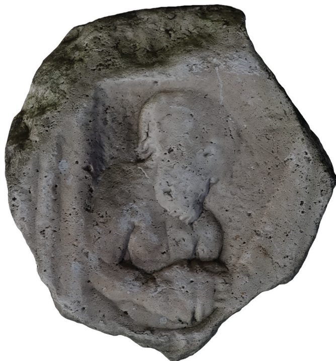
10. kép – A Nr. 12 kőemlék a Petőfi-emplékház udvarán, 2020. június