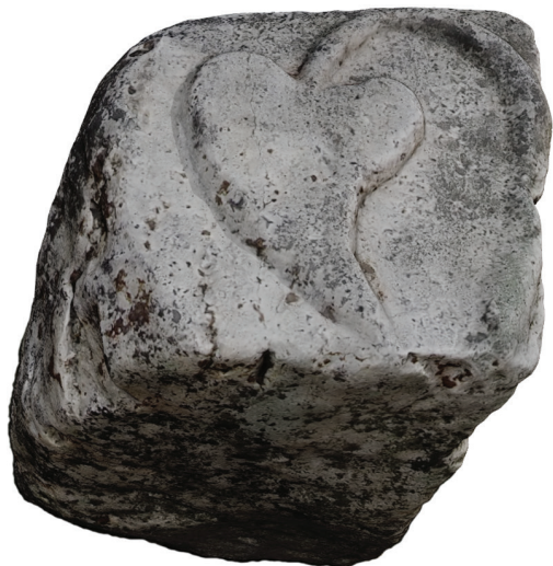
17. kép – A Nr. 20 kőemlék a Petőfi-emlékház udvarán, 2020. június