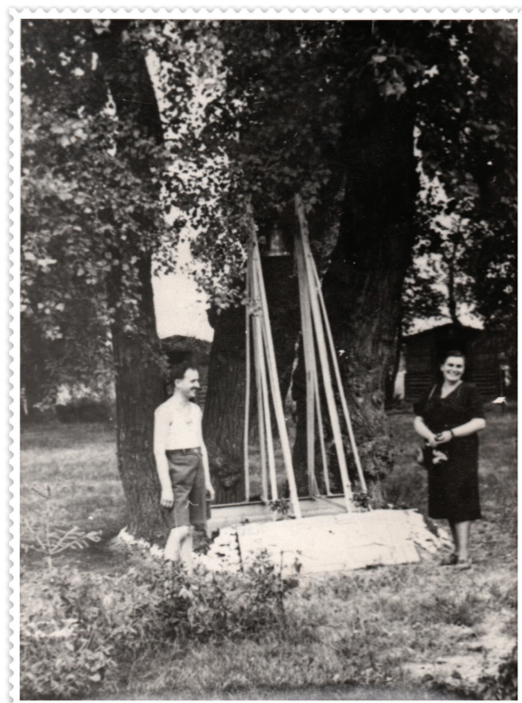
7. kép – A kőemlékkel megtámasztott harangláb a dunavecsei szigeten, 1938 augusztus (Sebők Lajos cserkészvezető felvétele, a fotót közli: SÁNDORNÉ ABLONCZY Zsuzsanna 2018 246)