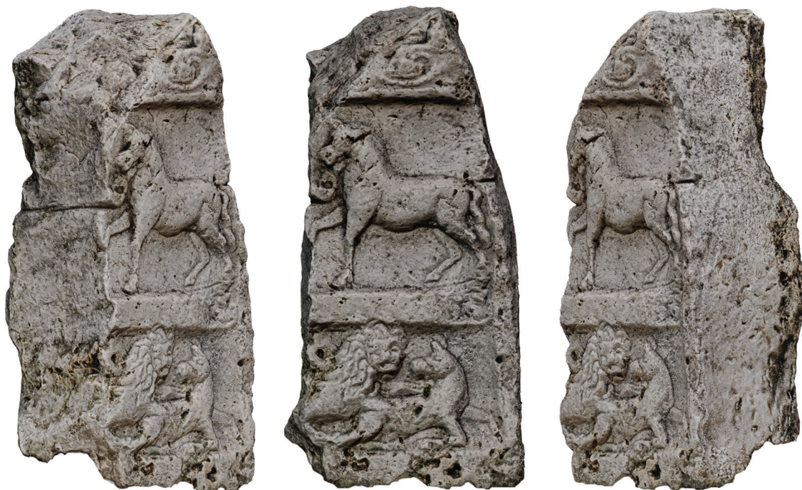
12. kép – A Nr. 13 sztélé-töredék balról, szemből és jobbról, 2020. június

értékelése során az említett levelezéshez mellékelt évszázados fényképet használta. Megállapításai az autopszia alapján kiegészíthetők a következő adatokkal: A darab fentről, letről és balról töredékes. A jobb oldalon az alsó harmadig megmaradt a sztélé eredeti oldalsíkja. A csonka darab mindkét oldalán befűrészelések figyelhetők meg. A sztélé hátoldala durván lenagyolt. Az alsó képmező magassága 24 cm, az efelett kialakított képmezőé 36 cm. A két képmezőt díszítetlen perem választja el egymástól, ugyancsak díszítetlen volt a képmezőket oldalról határoló perem. A kötődék felső részén a frízben borostyáninda fut. A fríz felett valószínűleg nem a feliratos mező, hanem egy újabb képmező lehetett, talán portréábrázolásokkal. A feliratos mező inkább a három képmező alatt kaphatott helyet – erre a megoldásra több példát is ismerünk Pannoniából. 116 A letört felső mező profilkeretének oldalrészéből nem őrződött meg semmi, a maradványnak vélt részlet inkább a mező figurális faragványához tartozhatott. Így a kötődék nem a sztélé alsó felének, hanem felső felének jobb oldali darabja lehet. A fő motívumnak vélt 'lovat vezető calo'-ábrázolás inkább a fő képmező alatti egyik mellékmotívumként értelmezhető és elképzelhető akár egy kocsijelenet részletként is, 117 vagy tripus -jelenettel kombinálva 118 (12. kép).