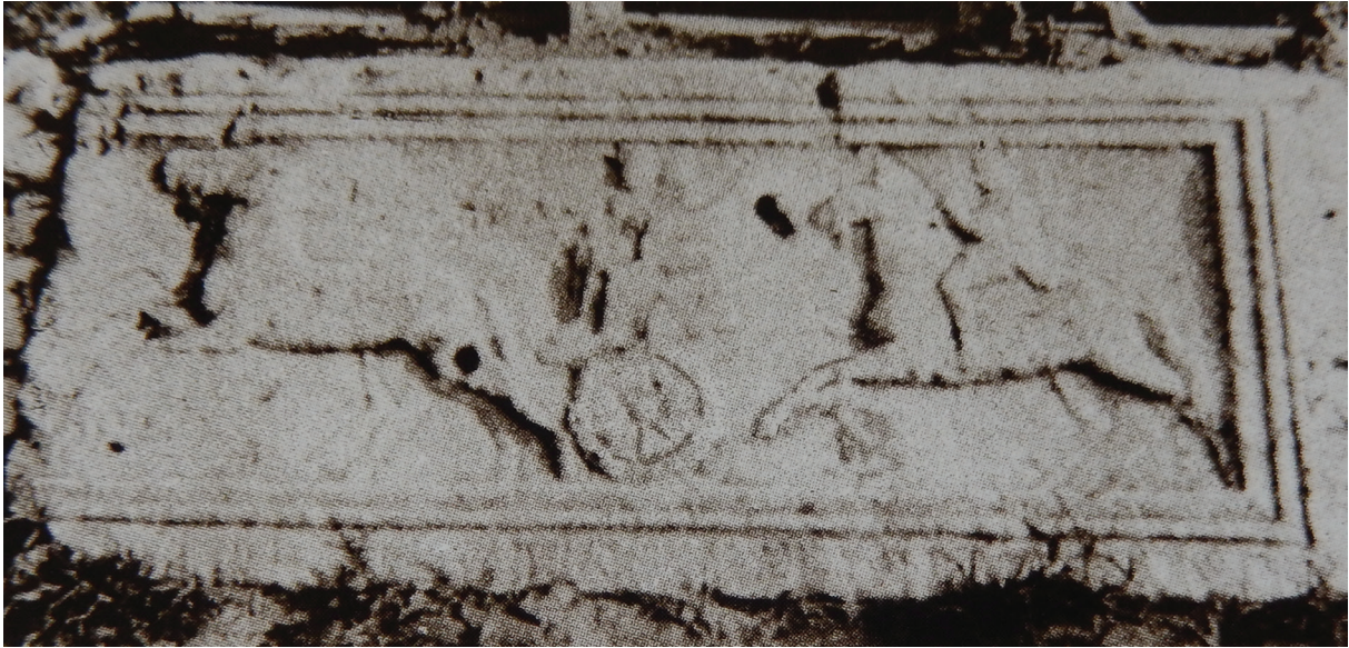
8. kép – A kőemlék a harangláb alatt a dunavecsei szigeten, 1938 augusztus (Sebők Lajos cserkészvezető felvétele, a fotót közli: MOLNÁR Miklós 2001 23; SÁNDORNÉ ABLONCZY Zsuzsanna 2018 246)