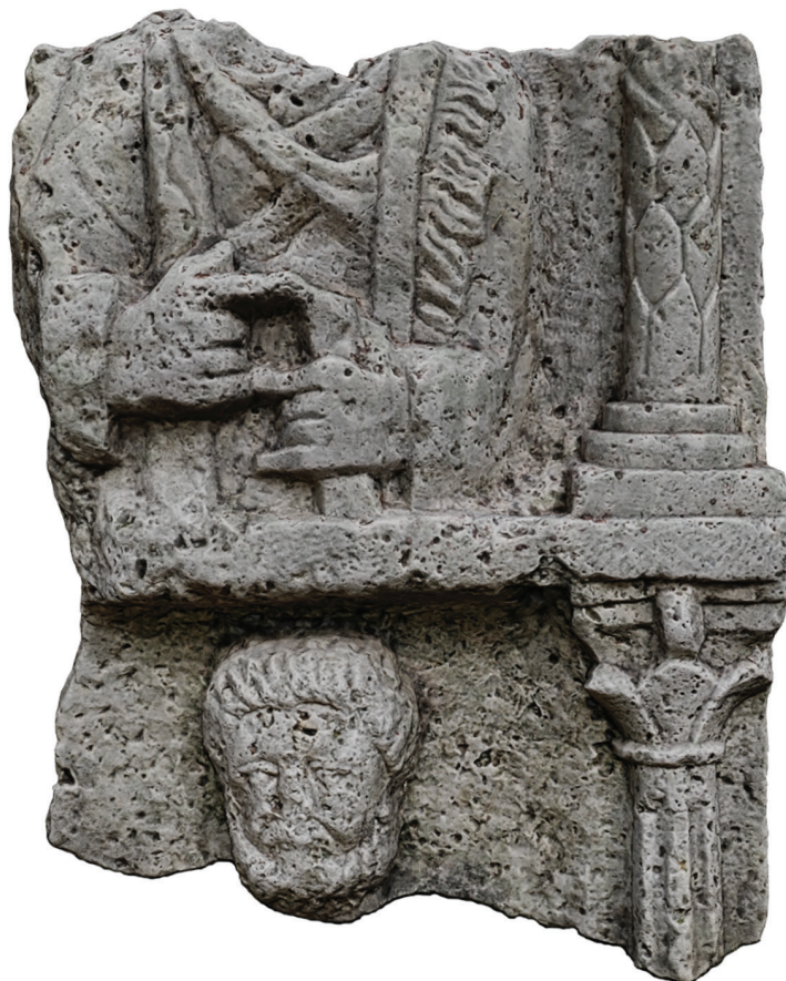
4. kép – A Nr. 4 sírsztélé a Petőfi-emplékház udvarán, 2020. május