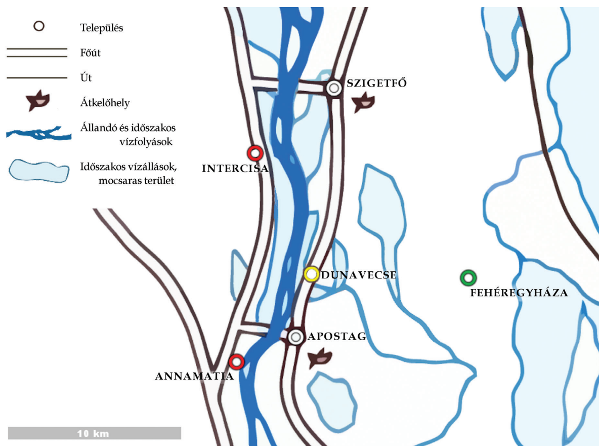
1. kép – Az érintett helyszínek és a dunai átkelőhelyek viszonya a középkorban (a szerző grafikája BLAZOVICH László 2002 térképmell. alapján)

régészeti adatunk, a rózsadombi római „vár” hagyománya megcsontosodott a helytörténeti irodalomban. 14 Naszály Sándor pedagógus, iskolaigazgató monográfiájában a török 1639-ben már nem a középkori templomot, hanem a rózsadombi római „várat” bontja el. A szerző szerint a „vár” a római kövek forrása. 15 Naszály adatát a későbbi helytörténetírás úgy „korrigálta”, hogy az 1639-es török kőszállítás kiterjesztette mind a római „vár”, mind a középkori templom kőanyagára – beleértve a római faragott köveket is. 16 Összefoglalva: semmilyen bizonyítékunk nincs arra, hogy a település középkori templomából, avagy a Rózsadombról római kőanyag került volna elő. A római kövekkel kapcsolatos adatokat a település lakóitól személyesen összegyűjtő Rómer Flóris (1874) és Gerecze Péter (1909) sem tett említést e két helyszínről.