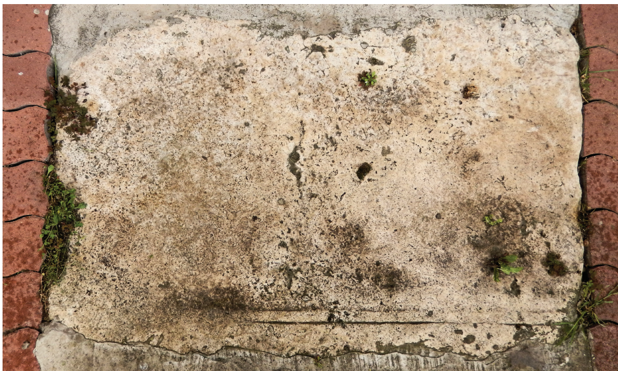
14. kép – A Nr. 15 kőemlék a református templom papi bejárója előtt, 2020. június

GERECZE Péter 1910 102. Nr. 6; SÁGI Károly 1945 229, 247. Nr. 6/a; NASZÁLY Sándor 1983 27. ad 1/4. 127