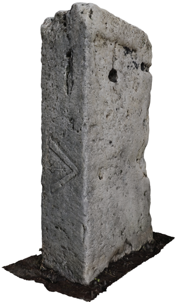
16. kép – A Nr. 19 sír építmény elem a Petőfi-emlékház udvarán, 2020. június

öltözött nők ékszerviselése visszafogottabb – leg- alábbis az aquincumi sírkövek viszonylatában. 135 Az ékszerek hiánya és a frizura alapján római ruházatot, tehát tunicát és pallát feltételezhetünk. A férfi haja göndör és rövid, de a fület eltakarja. Szakálla rendezett, percízen vágott szakállvonallal. A szakáll és a haj összeér. Szemei nyitottak, a szemhéjak látszanak, de a pupilla és az írisz nincs kidolgozva, ezek talán festve lehetek. Orra leверve. Tunica manicatát , felette pedig vastagabb köpenyt 136 ( sagum ) visel, amely jobb vállán korongfibulával van összefogva. Innen mélyre hajló redők futnak a mellkason át a bal vállhoz, valamint mindkét vállról függőleges irányban is redők omla- nak lefelé. A kitört részen bizonyosan szerepelt még két személy, ez a szám tovább nőhet, amennyiben a felnőtt személyek előtt gyermek(ek)et is ábrázoltak. A sírkő tetején, középen egy négyszögű csaplyuk van, ami arra enged következtetni, hogy rátett díszítményt hordozott (15. kép).