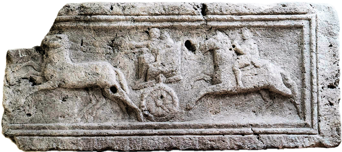
9. kép – A kőemlék az Intercisa Múzeumban, 2016 szeptember (Ortolf Harl felvétele alapján, Lupa 4009)