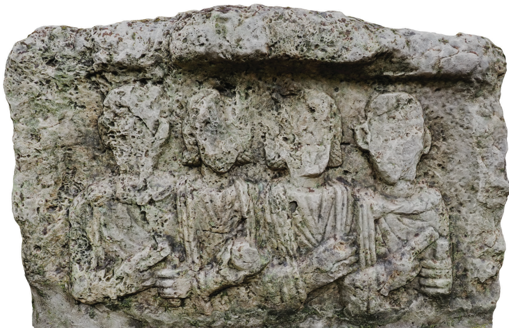
19. kép – Az A3 sírsztélé a Petőfi-emlékház udvarán, 2020. június

el a Dunavecse és Csabony közötti határvonal jelölésre a Duna-partra. 143 Rómer Flóris 1874. április 23-án ugyanitt találta a köemléket, immár a Dunába dőlve, ekkor csak a méreteit skiccelte fel jegyzetfüzetébe, a feliratából csupán néhány betűt látott. 144 Még ugyanebben az évben „a Nemzeti Múzeumba szállítottatott a derék község által” 145 „hazafias ajándékként” 146 . A mérföldmutató – két ellenkező oldali – feliratának olvasására már itt került sor. 147 Noha az újabb szakirodalomban Dunavecse és Csabony határa szerepel lelőhelyként, 148 ez minimum a harmadlagos lelőhely. Az EDH és EDCS adatbázisok Dunapentele lelőhelyadata téves.