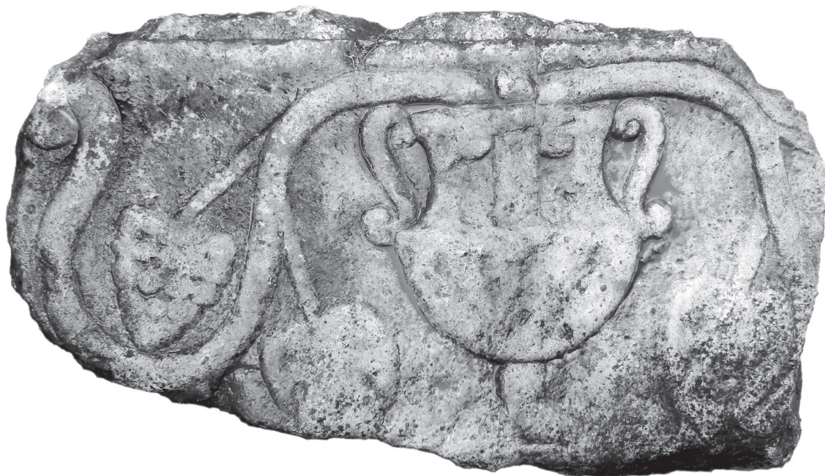
3. kép – A Nr. 2 kőemlék a Vécsey-kastély udvarán, 2020. június

Imp(eratori) Caes(ari) M(arco) Iul(io) Philippo | P(io) F(elici) Invicto Aug(usto) pon|tifici maximo trib(uniciae) potes[tatis] co(n)s(uli) patri | patri[ae pro]co(n)s(uli) et | M(arco) Iul(io) Phi[lip]po nobi[lissimo] Caes(ari) n(ostro) filio | Aug(usti) n(ostr) et Marciae | Otacili[ae] Severae | sanctissimae Aug(usti) n(ostr) | coniugi Aug(usti) n(ostr) matri | castrorum exercitus | ab Aq(uinco) | m(ilia) p(assuum) LV. [Kovács Péter olvasata]