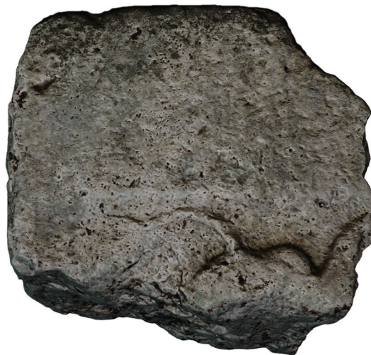
18. kép – A Nr. 21 kőemlék a Petőfi-emlékház udvarán, 2020. június (a szerző felvétele)