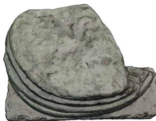
6. kép – A Nr. 6 oszlopláb szemből és felülről, 2020. május