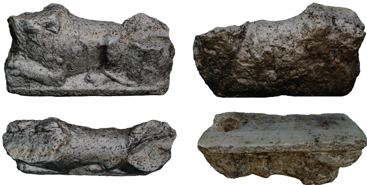
5. kép – A Nr. 5 kőemlék szemből, felülről, hátulról és alulról, 2020. május