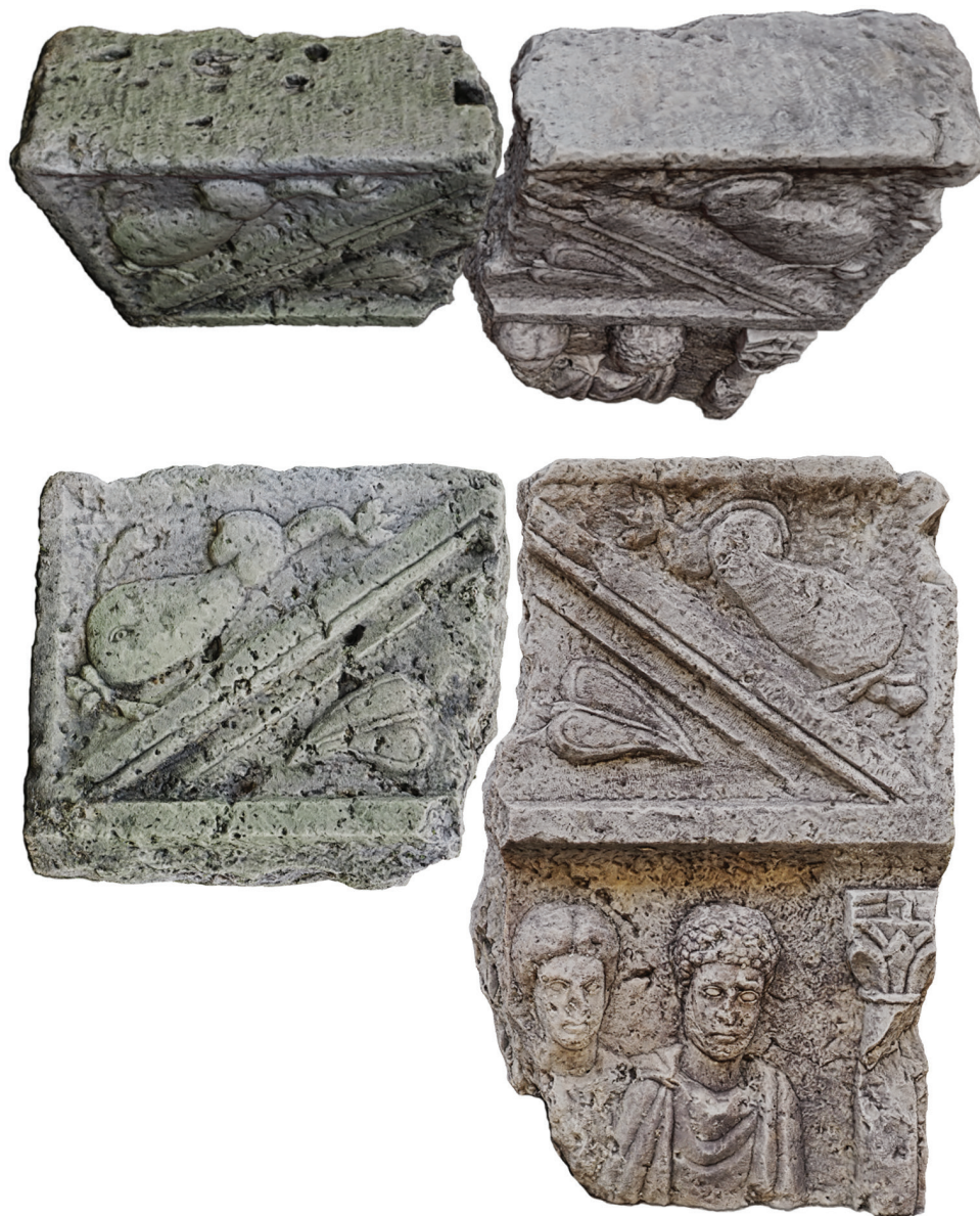
15. kép – A Nr. 18 sztélé két darabja összeillesztve, fentről és szemből, 2020. június

tompaszögű tympanon egyenlő szárú háromszoros tagoltak. A homlokzatot a középrészről egyszerű, díszítetlen architráv ( epistylon ) választja el, amelyet a középrész két szélén korinthoszi jellegű oszlopok támasztottak alá. Az oszlopokból csak a jobb oldali maradt meg, lábát talán a betonagy rejti. Az oszloptörzs sima, díszítetlen. Az oszlopfejezet 133 egyszerű nyakgyűrűje felett levélgallér, ez adja az átmenetet a félhengeres oszloptörzs és a négyszögalaprajzú abacus között alátámasztva annak sarkait. Az akantuszlevelek erősen geometrizáltak, az első levélsor közeiből egy második levélsor vázára emlékeztető tagozat nő ki. Az oszlopfő abacus -át stilizált, dugószerű abacus -virág díszíti. A kőfaragó ( quadratarius ) hibájáról árulkodik, hogy az oszlopfejezet és az architráv nem érintkezik egymással. 134