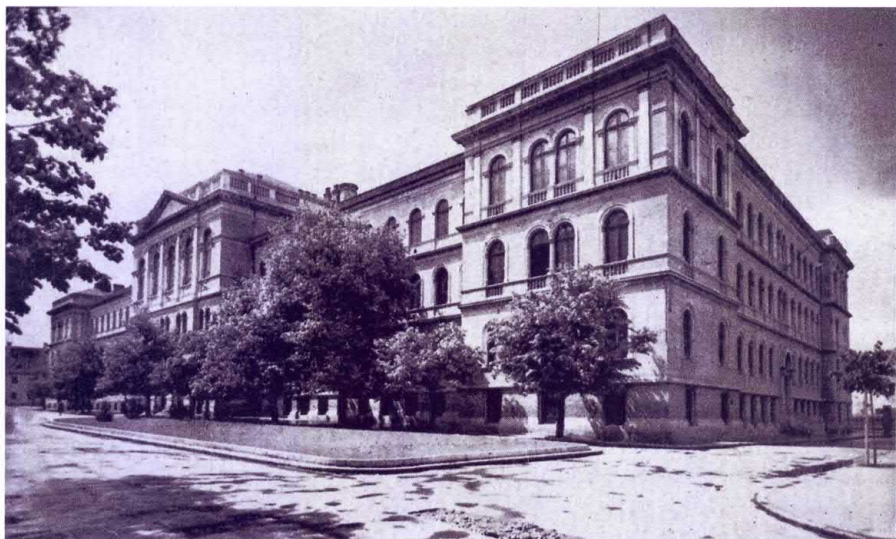
A kolozsvári Ferenc József Tudományegyetem, 1940

Az irat szerint az egyetemen még 1942-ben is „aggasztóan” gyenge volt