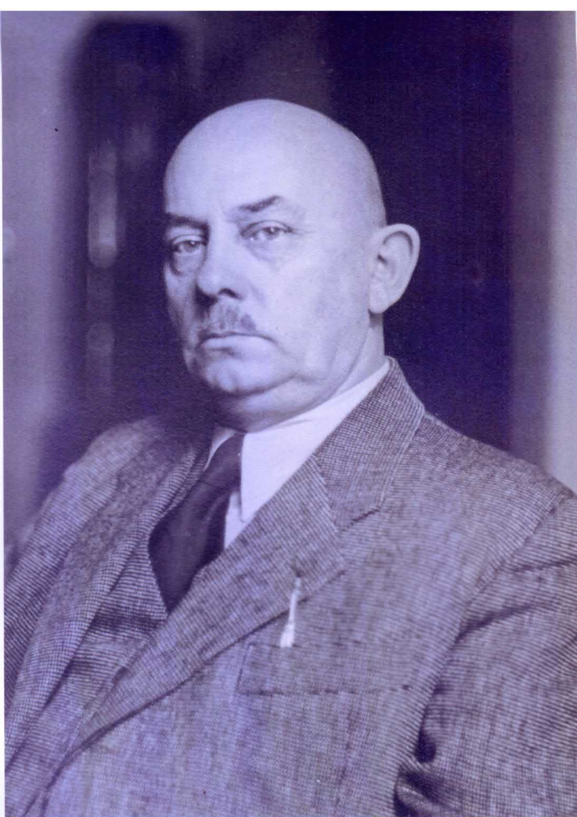
Roska Márton (1880–1961), a kolozsvári tudományegyetem ősrégészeti tanszékének vezetője (1940–1945)

amelyben többnyire minden későbbi nézetének a csírája megtalálható, és bár pályája során finomított rajtuk, élete végéig kitartott mellettük. A kiadványban „egy régész fogalmazza könyvvé ásatási tapasztalatait, egybevetve azokat az írott forrásokra hivatkozó történettudomány érveivel” .