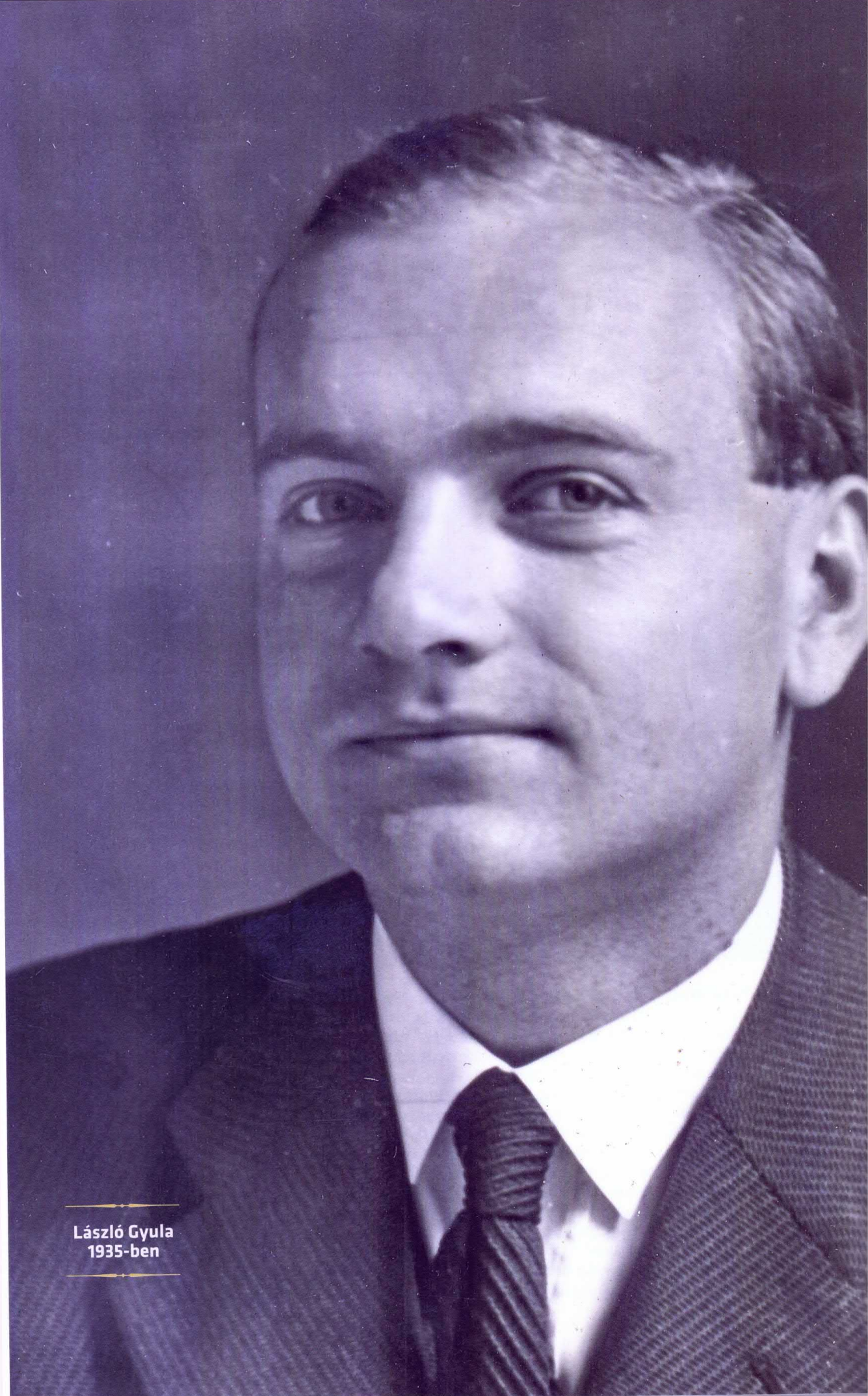
László Gyula 1935-ben