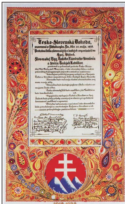
A pittsburgi nyilatkozat (1918) díszkiadása az 1938-as évfordulóra

Külön kérdés, hogy volt-e bármilyen alternatívája a történelmi magyar állam felbomlásának és Trianonnak. Ismerjük Jásziék, Apponyiék 1918., illetve 1920. évi népszavazás-kezdeményezéseit, az 1919. és 1920. évi szlovák autonómiáról elfogadott magyar törvényeket, ismerjük Jászinak a kantontervét. Ma már tisztán látjuk, hogy mindezek a kölcsönös belső megállapodást célzó elképzelések egytől egyig a történelem fő sodorvonalán kívül történtek, s mint ilyenek, nem befolyásolhatták érdemben a helyzet alakulását. Mint ahogy az 1919–1920. évi, megkésve megvalósult katonai akciók sem voltak, nem is lehettek volna képesek megváltoztatni a nagyhatalmi döntések irányát. Legfeljebb egy-két határszakaszon magyar szempontból méltányosabb területi megoldások alakulhattak volna ki.