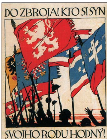
Amerikában élő szlovákok által tervezett plakát cseh, szlovák, morva és sziléziai történelmi szimbólumok felhasználásával, 1918

A Szlovák Nemzeti Tanács a Csehszlovákia 1918. október 28-i prágai kiáltása után két nappal született állásfoglalásával deklarálta „a Magyarország határain belül élő cseh–szlovák nemzet” önrendelkezési jogát. Kijelentették, hogy „Szlovákiában a szlovák nemzet nevében beszélni egyedül a Szlovák Nemzeti Tanács jogosult”. Ugyanakkor a cseh–szlovák államhoz való csatlakozás szándékát hangsúlyozva azt is deklarálták, hogy a „szlovák nemzet a nyelvileg és kulturális-történeti értelemben egységes cseh–szlovák