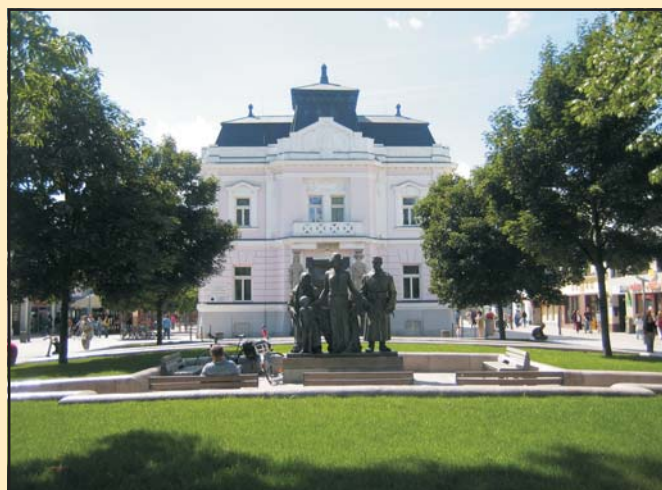
A Tatra Bank, a Szlovák Nemzeti Tanács deklarációjának színhelye

Forrás: Dokumenty slovenskej národnej identity a štátnosti I. Bratislava, 1998. 513–514.