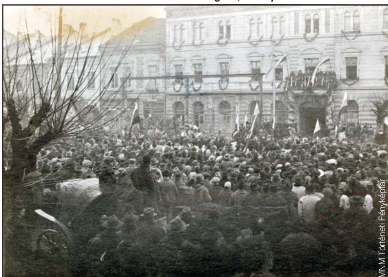
Šrobár, az új kormány teljhatalmú szlovák minisztere az eperjesi Fekete Sas erkélyéről kihirdeti a város csatlakozását a csehszlovák köztársasághoz, 1919. január