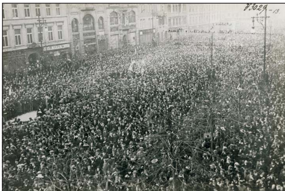
Csehszlovákia megalakulásának kihirdetését hallgató tömeg a prágai Vencel téren

A magyar és a szlovák történetírás tisztában van az államhatárookra vonatkozó tervekkel, demarkációs vonalakkal: az összes tervezet térképét publikálták már. A magyar nézőpontot az etnikai szemlélet jellemzi. Míg a korabeli valóság: a határok a világháború után egy összetett, államjogilag és nemzetközi jogilag vákuumhelyzetként is leírható szituációban, alapvetően katonai fogla-