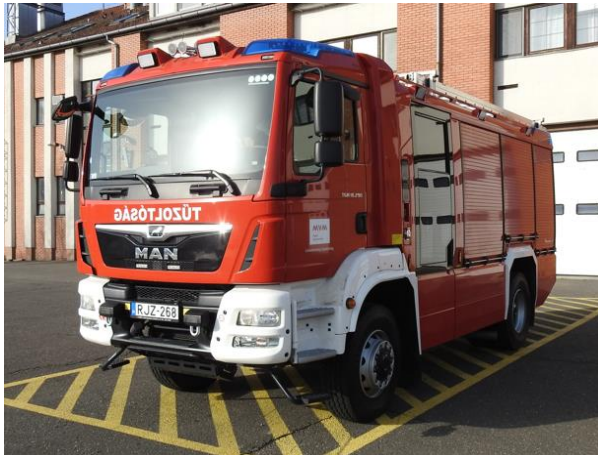
Erőmű/1 – MAN R-TLFA 2000 AT3