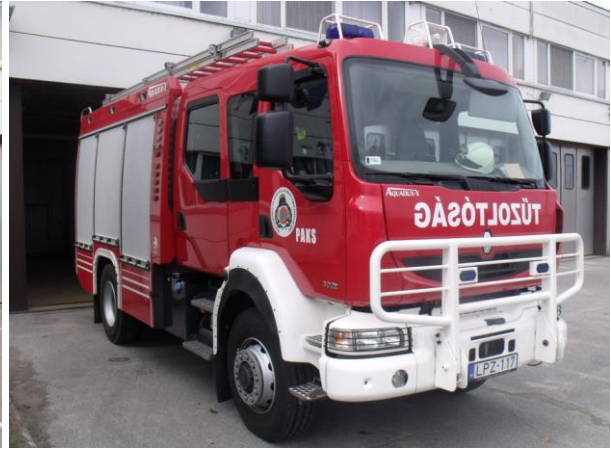
Paks/2 – Renault AQUADUX 4x4