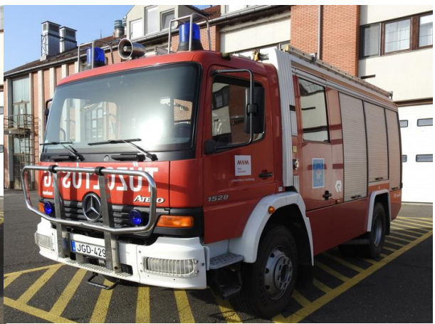
Erőmű/2 – MB-RB TLF-4000 ATEGO