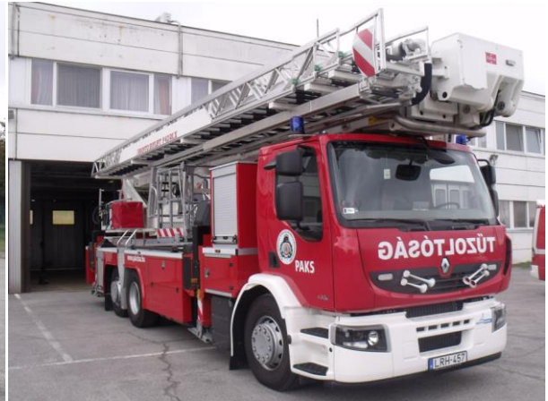
Paks/Emelő – Brontó Skylift RLX 42