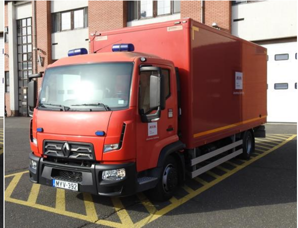
Erőmű/súlyos balesetkezelő – Renault Tornádó