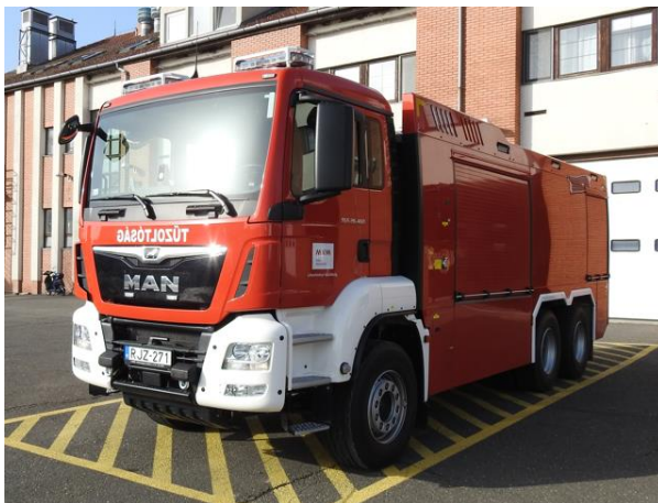
Erőmű/vegyes – MAN R-ULF 6000/1000