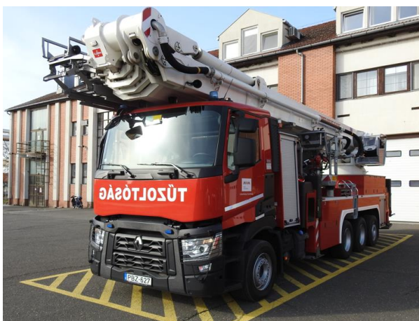
Erőmű/emelő – Bronto Skylift FL 60 XR