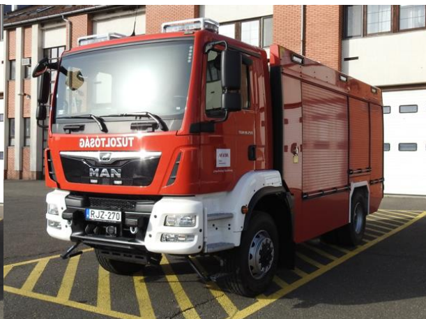
Erőmű/műszaki mentő – MAN TGM 18.250