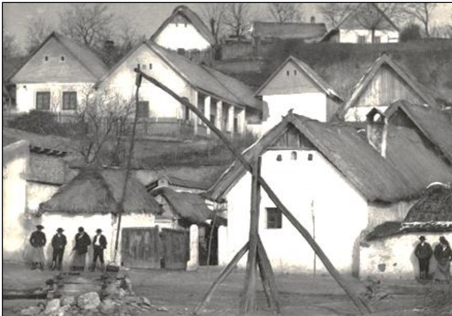
Magyar falu (Forrás: ld. [2])

A középkorban a tűzoltás a céhek feladata volt, ugyanis a céhek szervezett formában működtek, valamint ott állt rendelkezésre ember, állat és eszköz. Később a helyi iskolák tanulóit is bevonták a tűzoltásba, megalakultak a diáktűzoltóságok, de sajnos az iskolai szünetekben, főként a legveszélyesebb, nyári (aratási) időszakban nem voltak elérhetőek, továbbá szabályozás sem volt. Az építkezés alapvetően fából, vályogból történt, az elkészült épületek tetejét náddal, sással, szalmával fedték, és a házakat egymáshoz közel építették, ezért egy hirtelen kialakuló tűz és feltámadó szél hatására egész utcasorok égtek le.