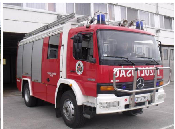
Paks/Tartalék – Mercedes Atego TLF4000