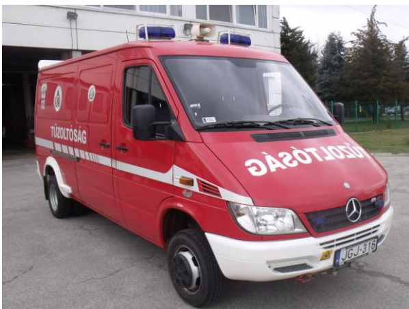
Paks/Pálya – Mercedes Sprinter