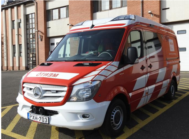
Erőmű/mentő – Mercedes Sprinter