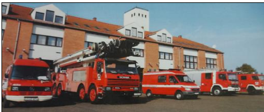
Atomerőmű Tűzoltóság laktanyaépülete 2010-ben (Forrás: ld. [4: p. 58.]

Komoly fejlődés vette kezdetét, hiszen az atomerőmű üzembe helyezésével megnövekedett biztonsági követelményekkel járó feladatokat megfelelő létszámú állománnyal és a kor követelményeinek megfelelő technikai eszközökkel lehetett ellátni. Figyelemre méltó követelményrendszert állítottak fel. Kialakították a továbbképzési rendszert, folyamatosan helyismereti foglalkozásokat és számos gyakorlatot tartottak. Megállapították, hogy mindezt csak úgy lehet teljesíteni, ha megfelelő fizikai és egészségügyi állapotban vannak a tűzoltók. Ezért egészségmegőrző programot indítottak, mely sportfoglalkozásokból, rendszeres orvosi ellenőrző vizsgálatokból és reggeli jogagyakorlatokból áll. Minden évben záróvizsga keretein belül kell a tűzoltóknak számot adni tudásukról. Mindezeknek gyorsan meg is lett az eredménye. Az országos és megyei szakmai- és sportversenyeken kimagasló eredményeket értek el, mely a kiváló felkészültséget és a teljesítőképeséget mutatja. Ma Magyarország egyik legkorszerűbben felszerelt és legfelkészültebb állományú tűzoltósága a Paksi Atomerőmű Létesítményi Tűzoltóparancsnoksága.