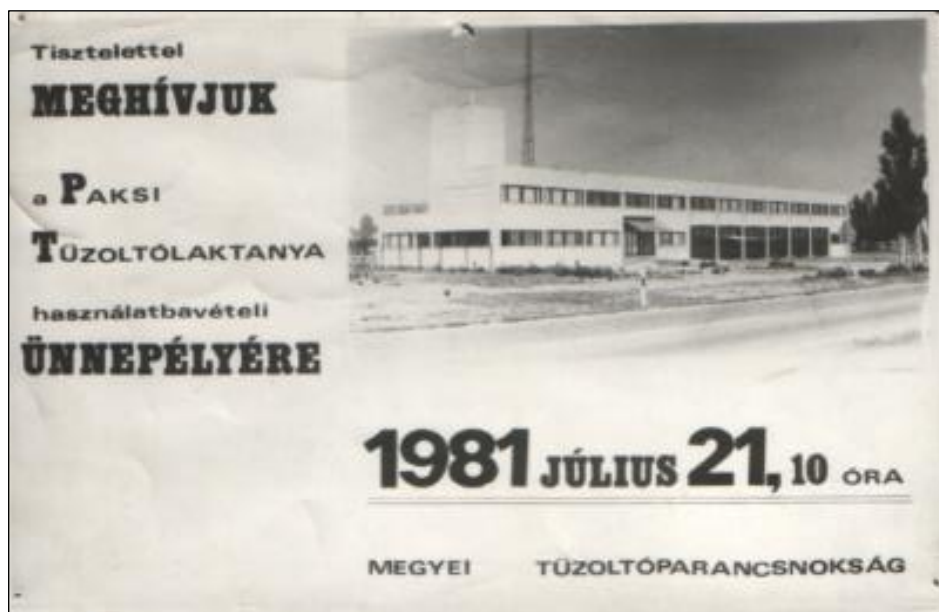
Meghívó a paksi laktanya átadására (Forrás: ld. [3: mellékletek 34.]