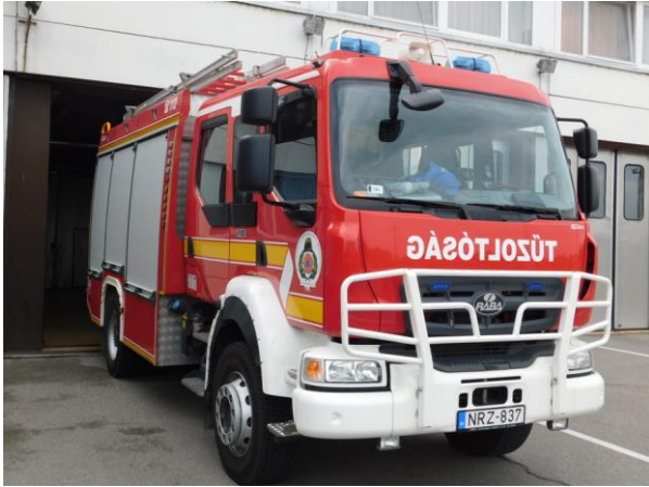
Paks/1 – Rába R16 AQUADUX-X 4000