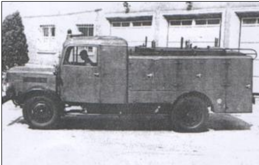
Csepel D350 gépjárműfecskenő (Forrás: ld. [3: mellékletek 26.]

Nem sikerült tisztázni, hogy a paksiak megkapták-e fent nevezett felszerelést, de az egyesület leltárában az alábbiak szerepeltek 1949-ben: „Egységes kocsifecskendő hat, mozdonyfecskendő kettő, vas lajt (500 literes) négy, fa lajt (400 literes) kettő, angol dugólétra tizenöt, gráci létra négy, továbbá kéziszerszámok és lámpák”. Az egyesület egységkönyvébe a következő bejegyzés szerepelt: „1952. március 8-12-én motoros fecskendő átvétele”. Két hónappal később „800-as benzín üzemű kismotorfecskenő átvétele”. „Június hónap 19-én targonca átadása.” Lehetséges, hogy csak ekkor kapták meg a motoros fecskendőket. A paksi képviselőtestület 1947. január 27-én határozatban fogadta el, hogy egy öntöző autót vásárolnak és a tűzoltók kezelésébe adják. Döntöttek arról is, hogy egy harmadik fizetett állást rendszeresítenek a gépkocsivezető részére.