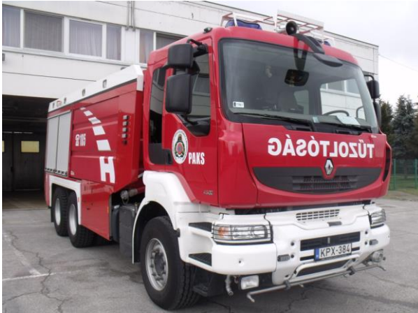
Paks/vízszállító – Renault Kerax 6x4