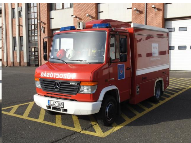
Erőmű/bázis – MB Vario 616 D (OMR)