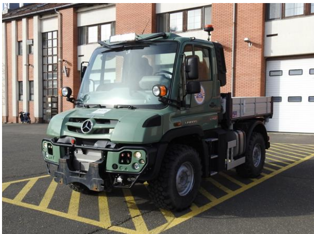
Erőmű/vontató – Mercedes Unimog