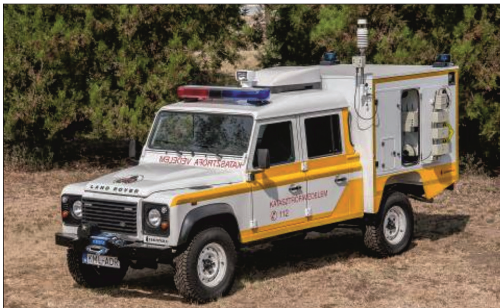
2. kép: KML-ADR-jármű

rozott körének kimutatására és dózisteljesítmény mérésére, a mért adatok továbbítására. A málháterben elhelyezett mentesítő anyagok és felszerelések használatával a KML el tudja végezni a szennyezett eszközök és személyek (beleértve a lakosság kisebb csoportját) részleges mentesítését. A biztonságos beavatkozás egyéb feltételeinek (például láthatóság, szakmai információkhoz való hozzáférés) megteremtését a gépjárműveken málházott kiegészítő tárgyak, infokommunikációs eszközök, szakkönyvek segítik. [5]