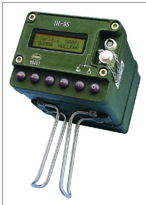
3. kép: IH-95 sugárszint- és sugárszennyezettség-mérő műszer

A műszer két különböző mérési funkciót valósít meg: hordtáskájában doziméterként, abból kivéve sugárszennyezettség-mérőként működik. A műszer hangjelzéssel figyelmeztet, ha a sugárzási szint átlépi a beállított riasztási szintek bármelyikét, emellett megjeleníti az aktuális mérési eredményeket a kijelzőjén. Rutinszerű környezetellenőrzésre és baleseti helyszín monitorozására egyaránt használható.