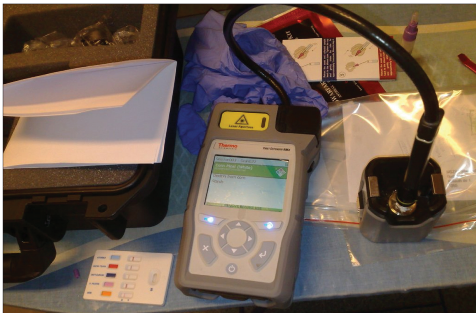
5. kép: FirstDefender eszköz helyszíni alkalmazása