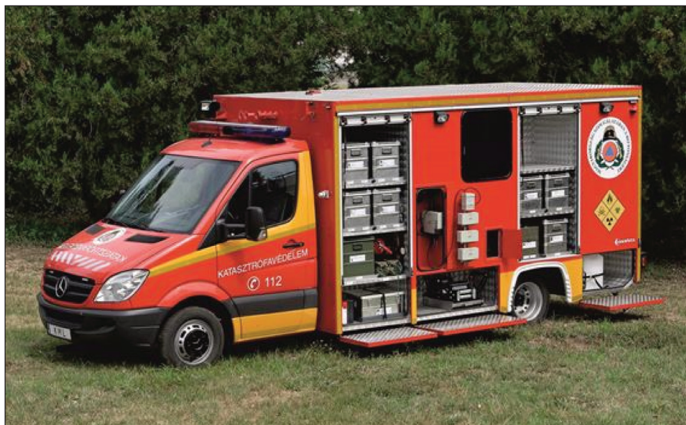
1. kép: Nagyfelépítményes KML-jármű

2012-ben megkezdődött a katasztrófavédelmi mobil laborok gépjármű- és eszközparkjának megújítása. A műszaki követelmények alapján kétféle: Mercedes Benz Vario típusú, valamint Land Rover Defender típusú beavatkozó és felderítő gépjármű állt rendszerbe.