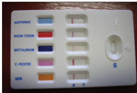
4. kép: ProStrips tesztsík eredménye [7]

Az ismeretlen anyagot tartalmazó küldemény esetében a biológiai veszély kizárása a KML által végzett felderítés második lépése. A KML állománya az Advnt Biotechnologies által kifejlesztett Pro Strips tesztsík segítségével, kis mennyiségű mintából egy időben öt biológiai ágens (anthrax, ricin toxin, botulinum toxin, Y. pestis, Staphylococcus enterotoxin B) kimutatására képes.