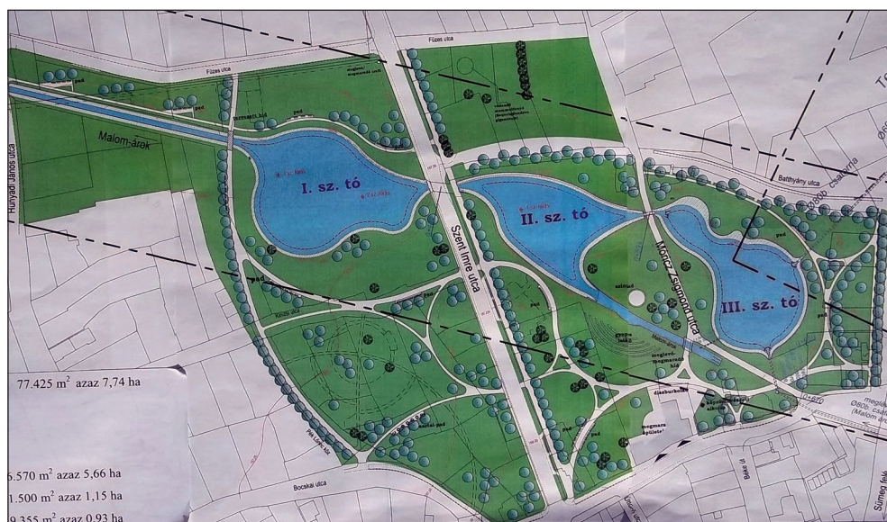
4. ábra: A devcséri emlékpark

Az iszapömlés egyéves évfordulóján, 2011. október 4-én avattak fel Devecserben a katasztrófasújtott lakóterület helyén egy 8 hektáros emlékparkot. A parkban három, egyenként félhektáros vízfelületű látványtavat alakítottak ki, amelyeket a Malom-árok forrásai és a Torna-patak táplálnak. Az emlékpark többi részét zöldterület fedi. A telekalakítási dokumentáció készítése, az ingatlan-nyilvántartási átvezetések és a hatósági engedélyezési eljárások időben lezárultak. Az emlékpark engedélyes terveinek készítése felajánlásból történt, valamint szintén felajánlásból az emlékpark területén egy játszótér kialakítására is lehetőség nyílt.