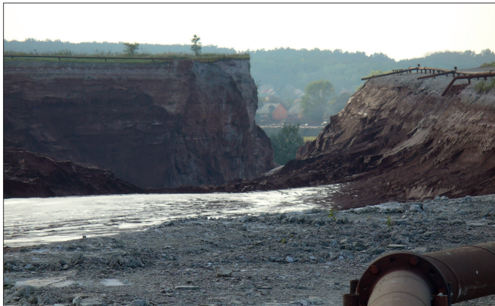
2. ábra: A X. számú kazetta kiszakadása

tok ellátásában 139 342 fő vett részt, és 54 243 munkagépet és különböző típusú gépjárművet vettek igénybe. Ez a helyszínrre vezényelt közreműködői személyi és technikai göngyöltött létszám 2011. december 31-ig elérte a 146 878 főt, és az 59 171 db technikai eszköz igénybevételét.