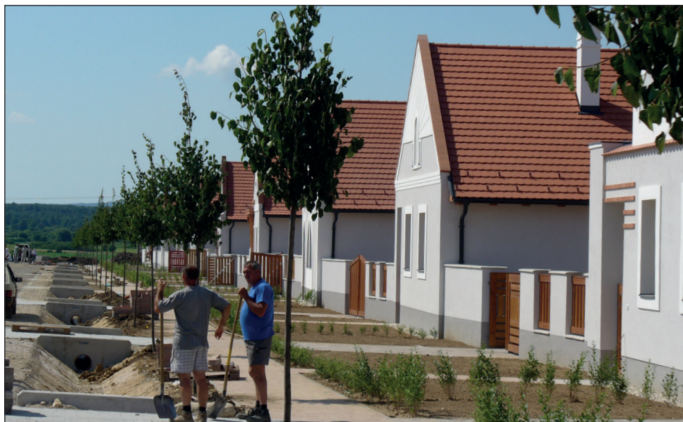
3. ábra: A kolontári lakópark építése

Devecser településen a megépült 89 lakóház műszaki átadása három ütemben történt: