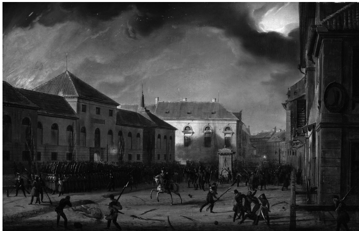
3. ábra. Marcin Zaleski, A varsói arzenál bevételé 48