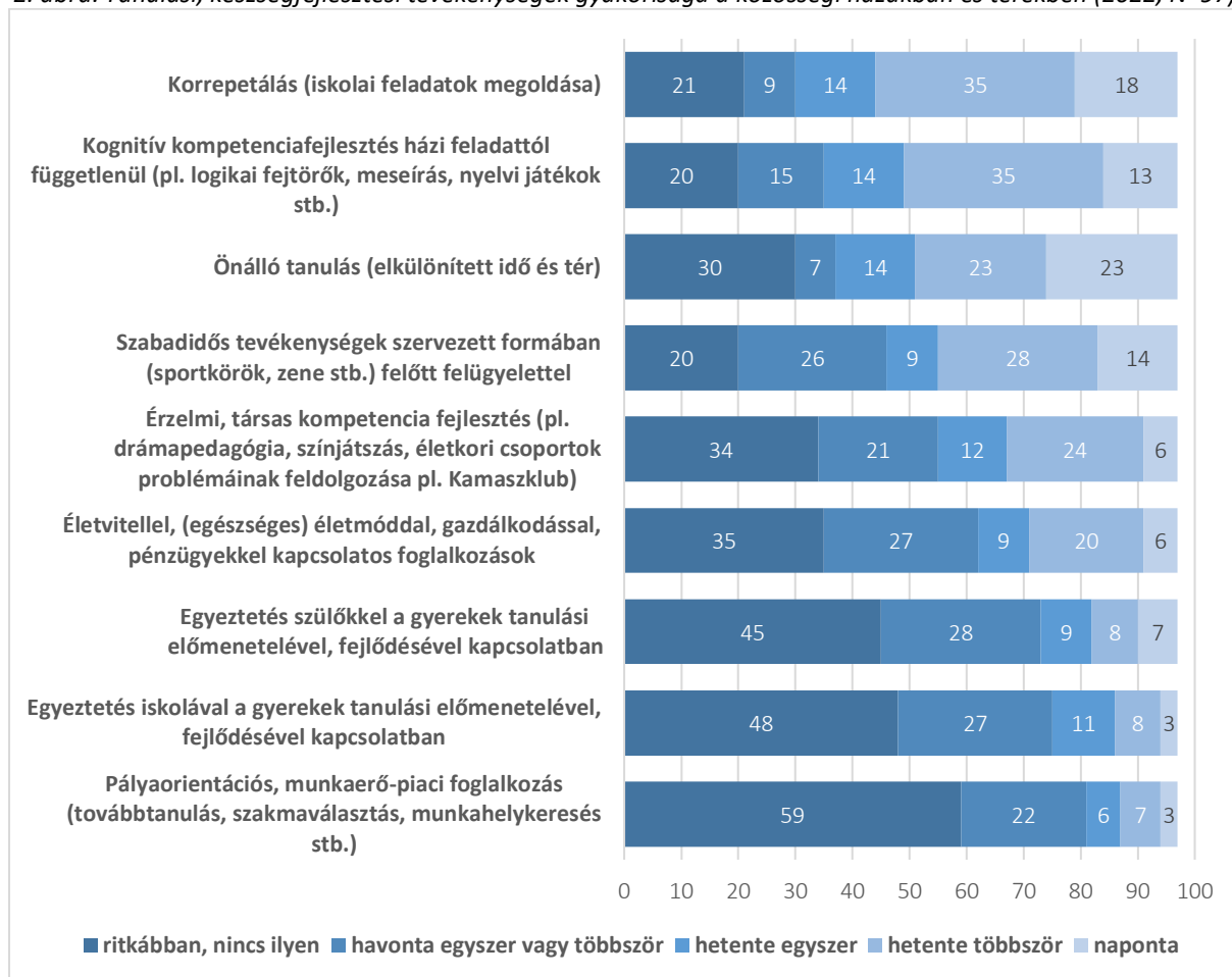
2. ábra. Tanulási, készségfejlesztési tevékenységek gyakorisága a közösségi házakban és terekben (2022, N=97)

Forrás: Gyerekesély program közösségi házakra, terekre irányuló kérdőíves felmérés adatai alapján saját szerkesztés.