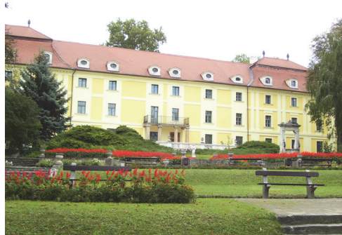
A Majláth-kastélyban működik a kórház

Törökbálinton élénk a kulturális élet, számos művészeti csoport tevékenykedik a városban. A Munkácsy Mihály Művelődési Ház kiállításokat, ének- és színjátzóprogramokat szervez, a Volf György könyvtár 30 ezer könyvtári egységgel, a falumúzeum gazdag helytörténeti gyűjteménnyel rendelkezik.