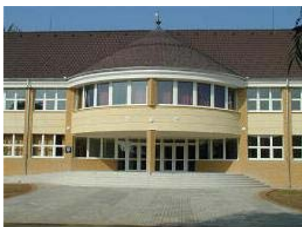
Az oktatási centrum új épülete

A település óvodája, amely 1975-ben épült, 2006-ban 175 férőhelyes volt, kihasználtsága pedig 111%-os. Általános iskolájába a környező Benk és Tiszamogyorós gyermekei is járnak, és az intézményben a 2006/2007-es tanévben 650 tanulót oktattak. A középiskolai nappali tagozatos oktatás Záhony várossá fejlesztésével összefüggésben Mándokon megszűnt, a legutóbbi tanévben viszont elkezdődött a felnőttoktatás egy szakközépiskolai feladatellátási helyen.