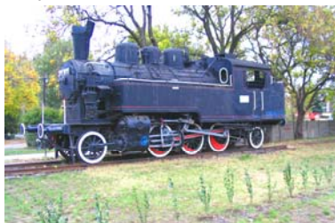
Helyi védelem alatt álló gőzmozdony

A 90-es években a vállalkozások szüntelen alakulása és megszűnése a munkaerőpiac átrendeződésével járt. A településről sok munkavállaló (a legutóbbi népszámlálás szerint a foglalkoztatottak 65%-a) ingázott a környező városokba (Székesfehérvárra, Százhalombattára, Dunaújvárosba, Budapestre). Az iparban dolgozni szándékozók egy része azonban el tudott helyezkedni a Pusztaszabolcsra letelepedett ipari üzemekben, amelyek közül a legjelentősebb a (Közép-Európában legnagyobb) német érdekeltségű Heitz Élfurnér Művek Gyártó és Kereskedelmi Kft. Üzeme, valamint a svájci tulajdonú Stadler Magyarország Vasúti Karbantartó Kft., amely az elővárosi vasúthálózat javítóbázisa.