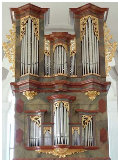
Katolikus templom az Óvárosban és Magyarország legrégebbi barokk orgonája a templomban

A város rövid távú tervei 2010-ig határozzák meg a fejlődés irányvonalát. Az élhető környezet, a kisvárosias jelleg megőrzése érdekében szellős elrendezésű lakóparkok létesítésével várják a betelepülni szándékozókat.