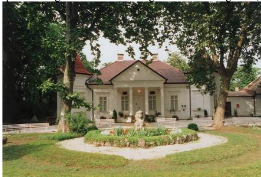
A Blaskovich Múzeum

fajtakísérletekkel és fajtafenntartással foglalkoztak. Napjainkban itt található hazánk egyetlen szántóföldi és kertészeti növényi génbankja. Vetőmagtermesztést és magtisztítást, illetve malomipari feldolgozást már a II. világháború előtt végeztek, és jelenleg is folytatnak a településen.