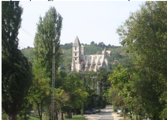
A Zsámbéki templom.

zete működött. Az 1950-es évektől mezőgazdasági szakembereket képeztek, majd 1977 és 2003 között – egy ideig a mezőgazdasági képzéssel párhuzamosan – ismét tanítóképző főiskolai oktatás folyt az épületegyüttesben. A felsőfokú képzés 2004-ben megszűnt a településen.