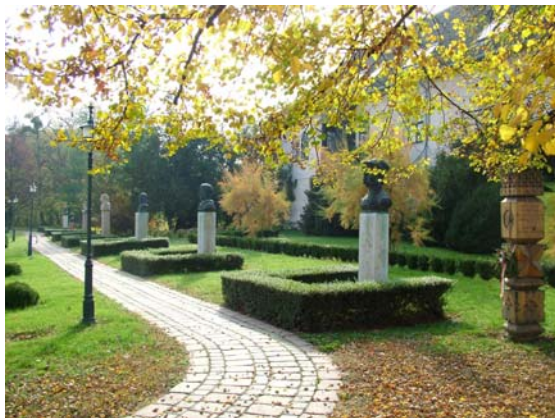
Vay Ádám Múzeum szoborparkja

A tervek szerint a Nyíregyháza és Vásárosnamény közötti szakaszon – Vajai csomóponttal – tovább épül az M3-as autópálya, amely a térség közlekedési viszonyait várhatóan kedvezően befolyásolja. A város vezetői a meglévő ipari terület bővítésével ipari park kialakítását tervezik, az autópálya megépítésétől – a város közlekedési csomóponti helyzetére alapozva – ukrán és román cégek letelepedését, s ezáltal új munkahelyek teremtését remélik.