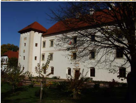
Vay Ádám Múzeum