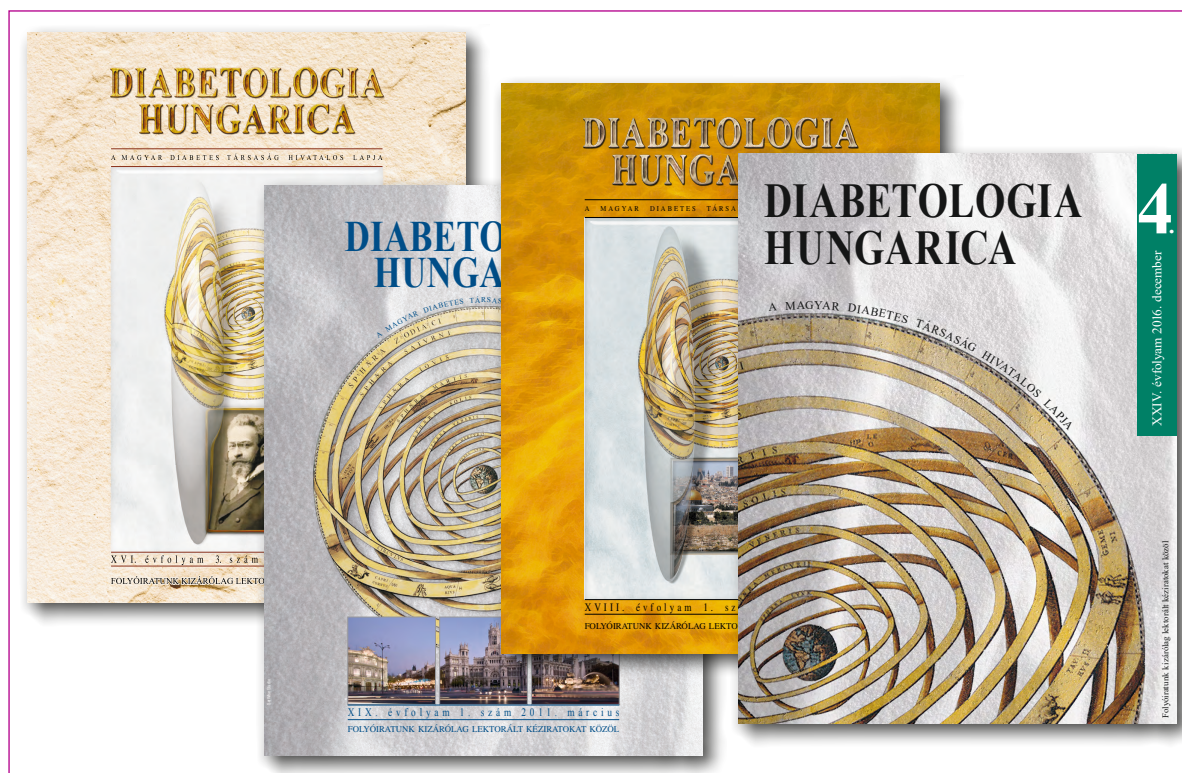
4. ábra. Egy csokor a „DH” színes borítóiból