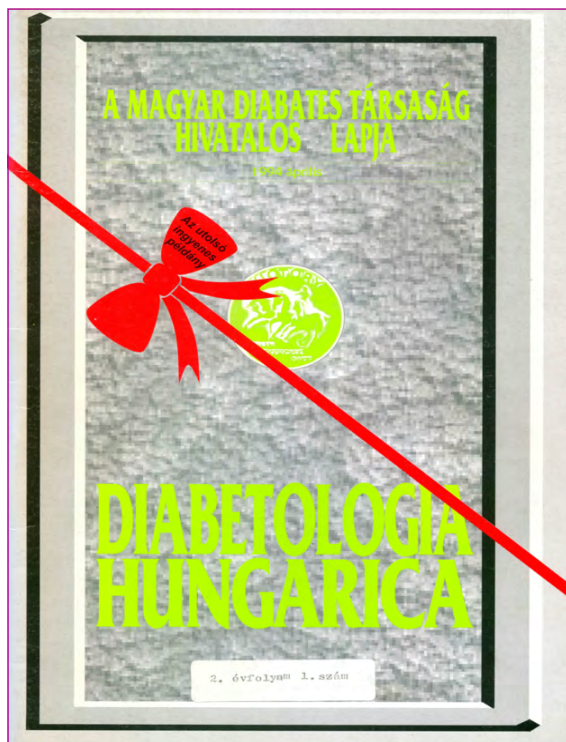
3. ábra. A Diabetologia Hungarica utolsó „ingyenes” példánya

Az első számban 36, a továbbiakban 48, A/4 méretű oldalon megjelenő, színes borítós folyóirat (2. ábra) egy sor megoldandó kérdést is napvilágra hozott: mi az a reális megjelenési gyakoriság, ami