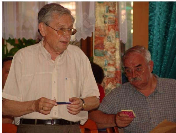
Az optimista „borsószóró” professzor és rezignált tanítványa, e sorok szerzője

Ma ezek egyértelműen hiányoznak. Az Enyedi György segítségével alapított kis kecskeméti akadémiai kutatócsoport is lassan megszűnik. Az e tanulmány szerzője által pontosan három évtizedig – a jobbító szándékú és hasznos tudományért – megvívott mindennapi harcok úgy tűnik vesztésre állnak. A tárgyul választott sajátos könyvismertető emlékezés végén, a benne foglaltak nyomán ezen nem is lehet csodálkozni.