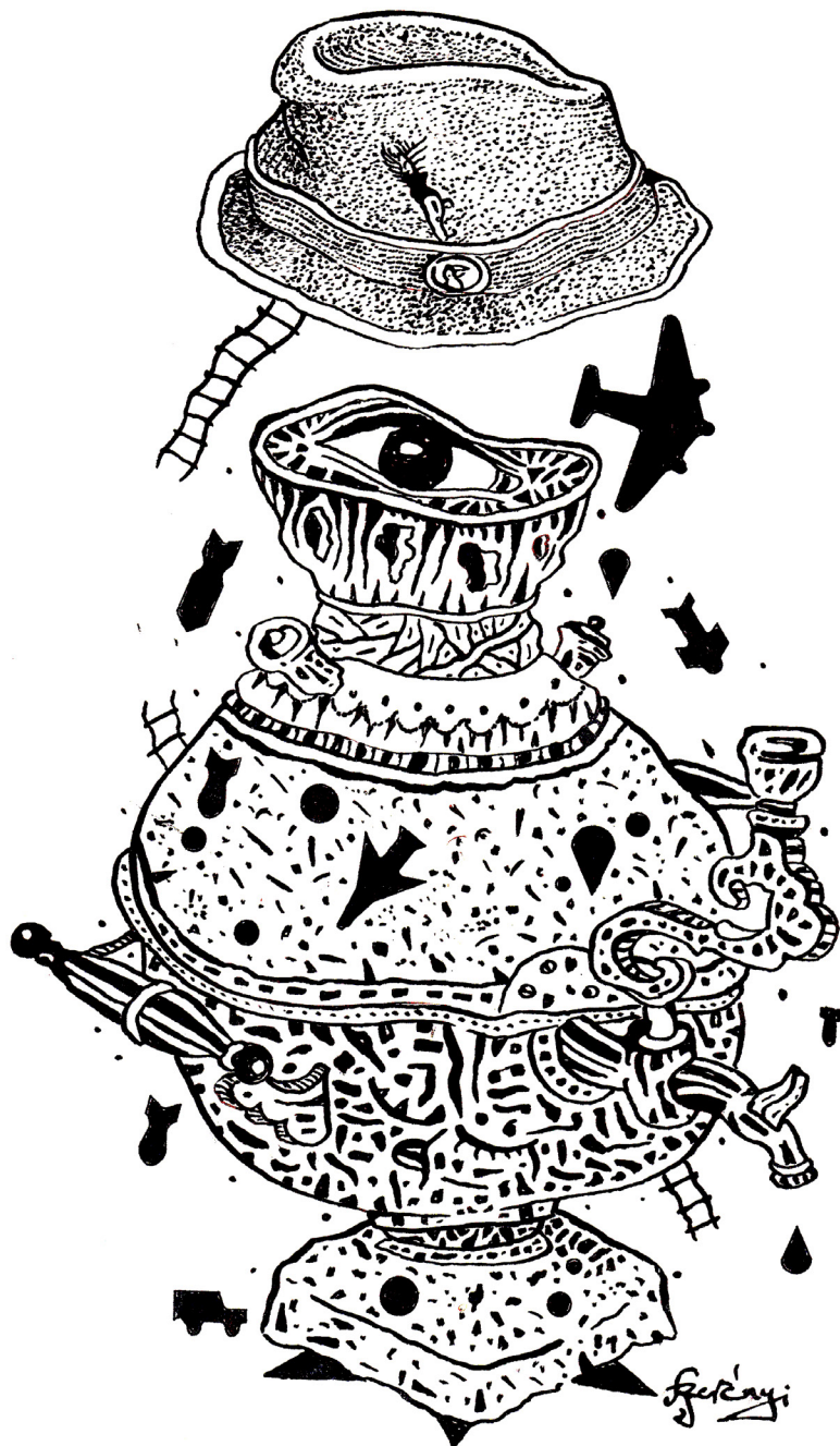
Szerényi Gábor grafikája