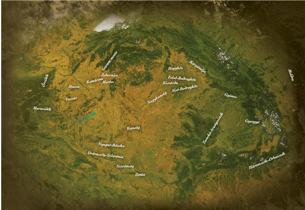
1. ábra – Az értéktartó kollégiumok Kárpát-medencei megoszlása

A tizenkilenc kollégium nyolc államot, vagyis a Kárpát-medencében elterülő összes országot érintette: