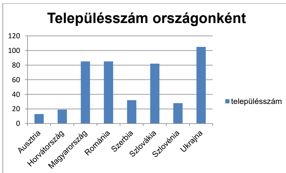
5. ábra - A kutatás alá vont települések százalékos megoszlása országonként.

A táblázatból jól kiolvasható, hogy Ukrainát figyelmen kívül hagyva, Magyarország (85), Románia (85) és Szlovákia (82) is magasan kiemelkedik a feldolgozott települések száma alapján. A legalacsonyabb számú, még élő magyarságtudatú lakossággal rendelkező település pedig Ausztriában (13) került feldolgozásra. A felkeresett települések száma nagyjából – Ukrajna kivételével – arányban van az egyes szomszédos államok magyar nemzetiségű lakosságával. A számok alapján megmutatkozik, hogy a jövőben a legindokoltabbnak a további Szerbiai kutatómunkák folytatása mutatkozik, azonban gyakorlatilag minden más területen is fontos a további feltáró tevékenység folytatása.